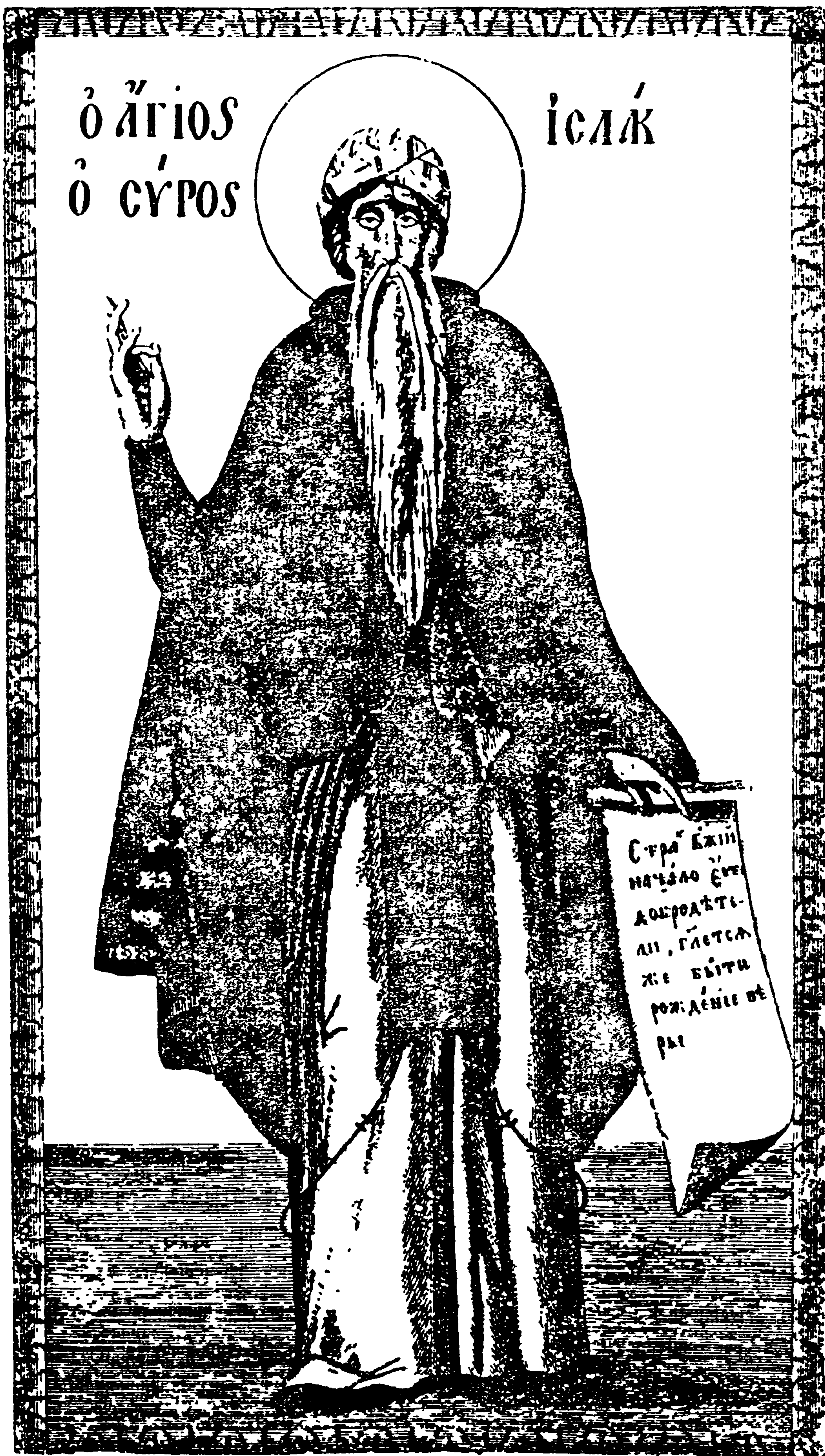
Точная копія съ изображенія СВЯТАГО ИСААКА СИРИНА, приложеннаго къ славянской рукописи его твореній, находящейся въ библіотекѣ Обители Преподобнаго Саввы Освященнаго и писанной въ 1359 г. на Афонской горѣ, въ Святой Лаврѣ преподобнаго Аевнасія, какъ значителъ въ надписи на сей рукописи.