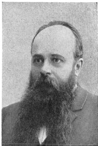
Г. А. Мачет