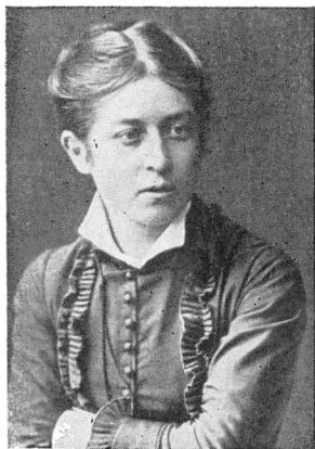
В. Н. Фигнер