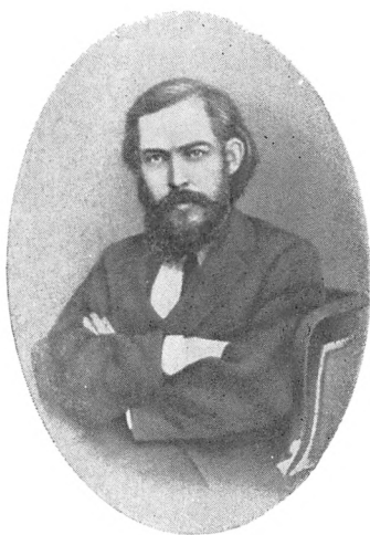
Омулевский (И. В. Федоров)