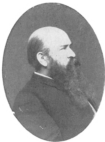
А. К. Шеллер-Михайлов