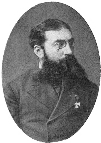
Вас. И. Немирович-Данченко