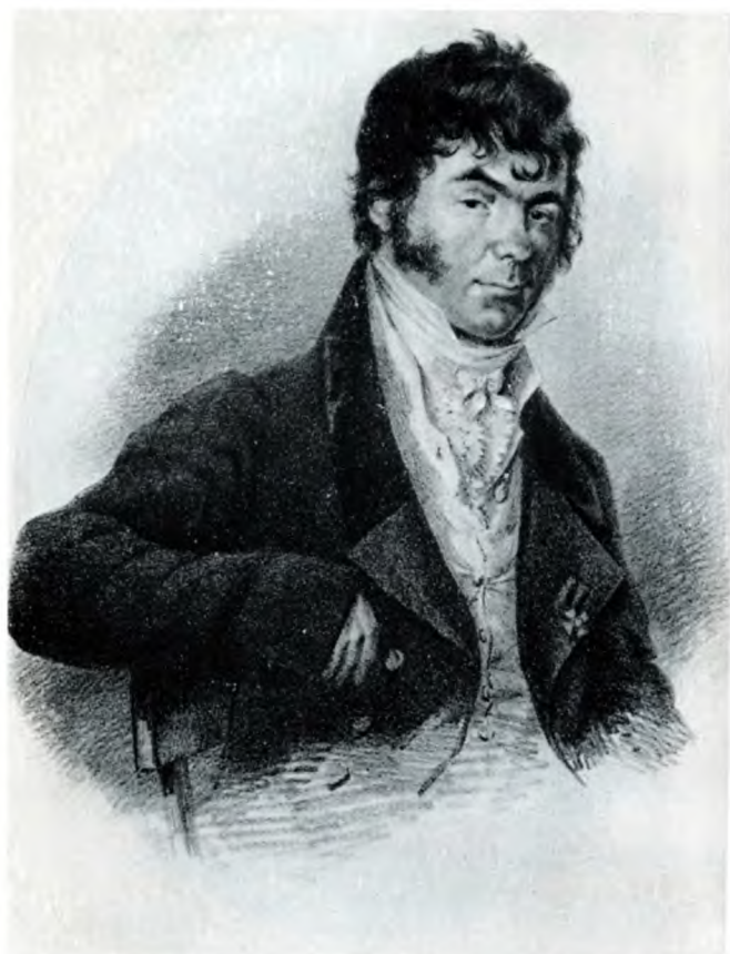
А. Х. Востоков