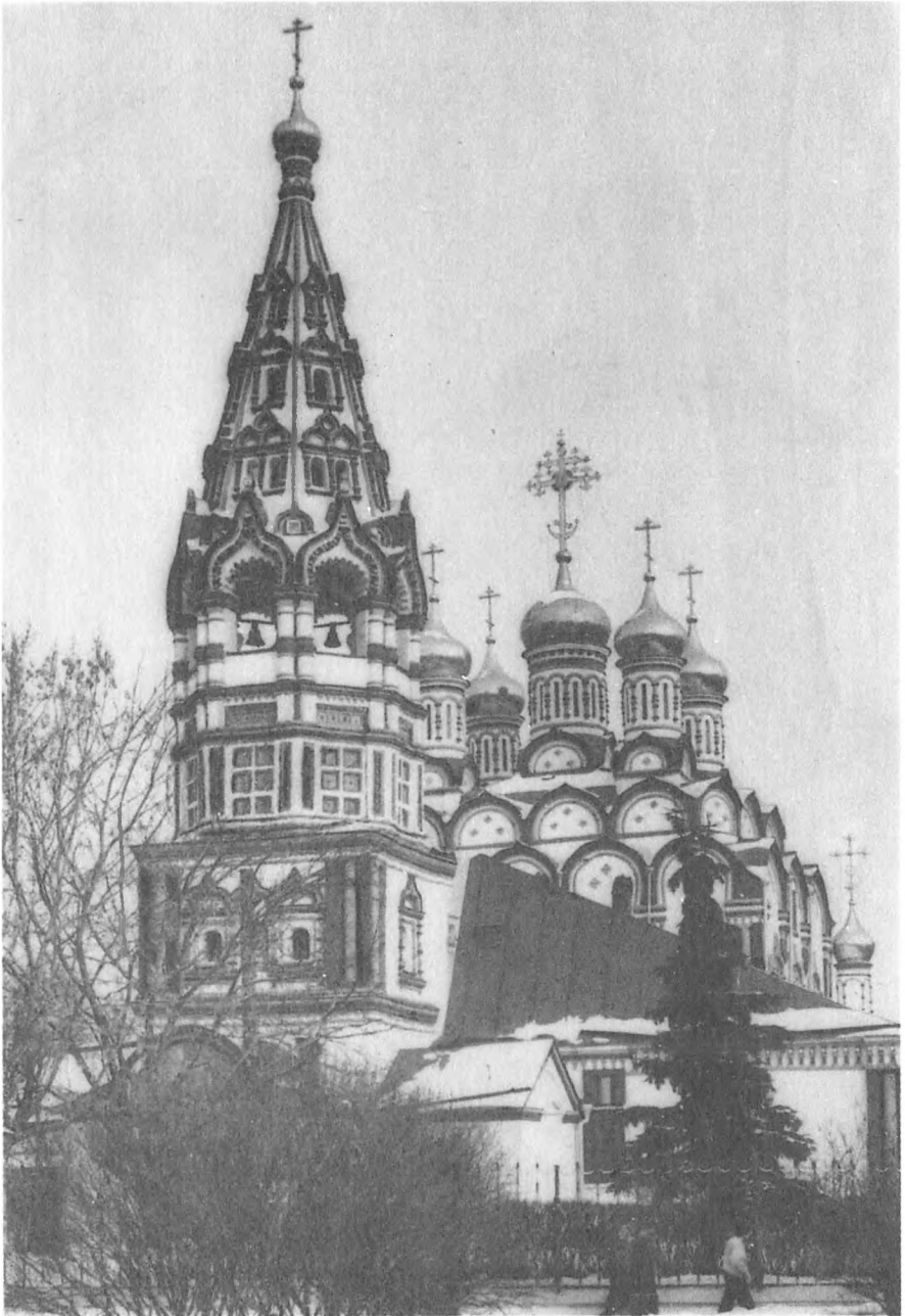
Храм Николая Чудотворца в Хамовниках. 2-я половина XVII в.