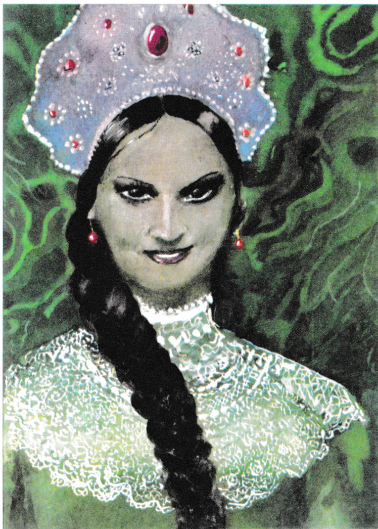
«МЕДНОЙ ГОРЫ ХОЗЯЙКА»