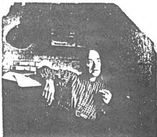
В Капкаринской ссылке. 1953 год. .....