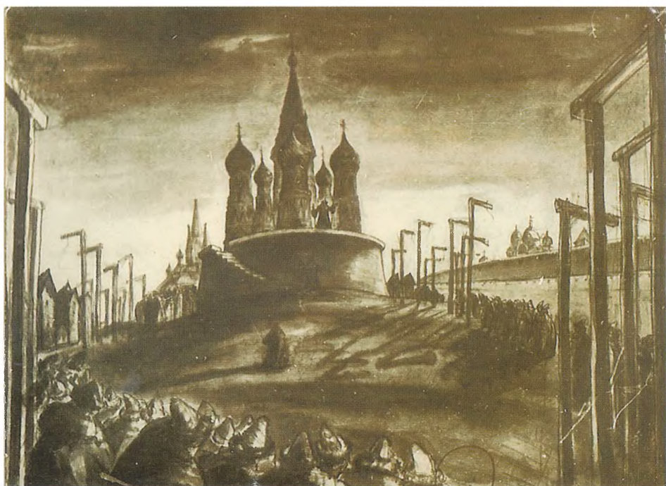
Единственный сохранившийся эскиз декорации к 3-й серии фильма «Иван Грозный». Виселицы на Красной площади