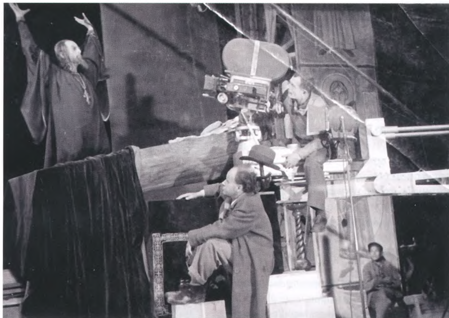
На съёмках фильма «Иван Грозный». Черкасов, Эйзенштейн и оператор Тиссэ

В нашей семье долго хранился томик Пушкина издательства Асадетиа с адресованной деду дарственной надписью Эйзенштейна. Она начиналась строкой Пушкина: «Вы помните: текла за ратью рать» ... и вместе с ней текли дни нашей совместной работы по Ледовому побоищу ...». Дальше точно не воспроизведу, так как книжка, к сожалению, не сохранилась. Но помню, что Сергей Михайлович выразил надежду на дальнейшее сотрудничество с моим дедом.