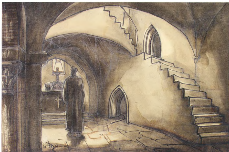
Эскиз декорации к фильму «Иван Грозный»

Заслуженный деятель искусств, лауреат Сталинской премии, дед был очень скромным человеком, и это не раз спасало ему жизнь. Наша семья из пяти человек жила в крохотной полуподвальной комнате коммуналки. Я, трёхлетняя, ходила гулять через окно. Никто не позарился на такое жилище... Когда Мосфильм построил дом для своих работников, мы и там въехали в коммуналку. Правда, уже в две комнаты.