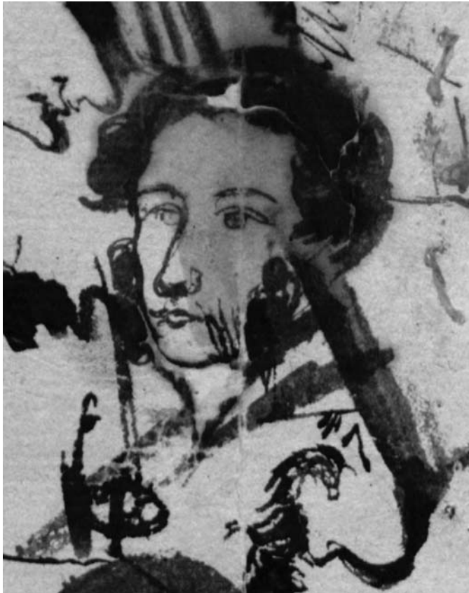
Пушкин. Автопортрет на листе с «Эскизами лиц, замечательных по 14 Декб. 825 года». Тригорское. Июль-август 1826