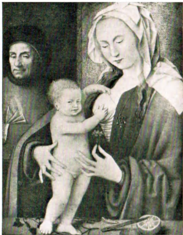
Нос ван Клеве (ок. 1464—1540). Св. Семейство с предполагаемым изображением Эразма в виде Носифа. Ленинград, Эрмитаж