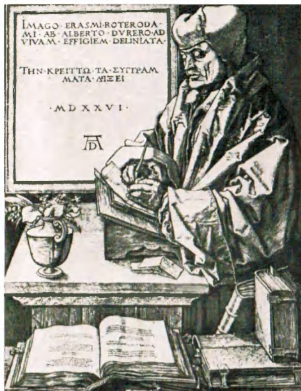
А. Дюрер. Эразм Роттердамский, гравюра, 1526