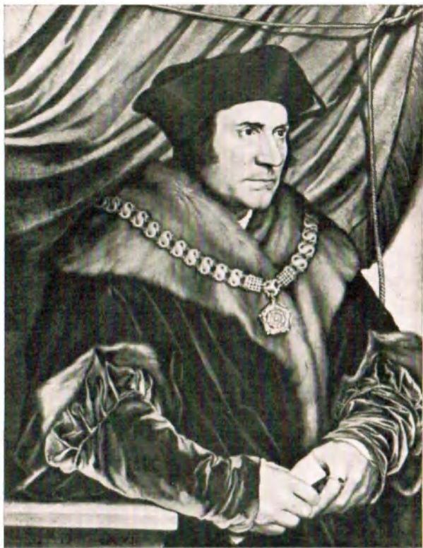
Ганс Гольбейн Младший. Томас Мор