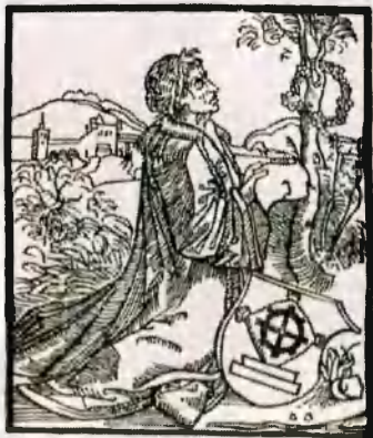
А. Дюрер. Себастьян Брант. Изображение на титульном листе его «Разных стихотворений». Базель, ок. 1493—1494