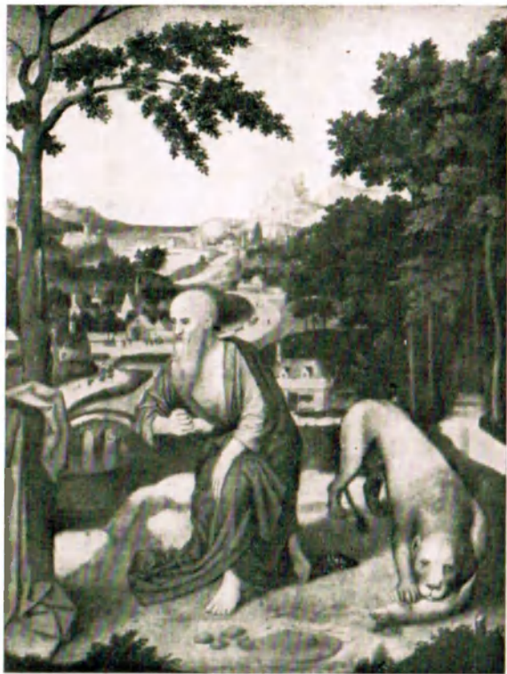
Адриан Изенбрандт (ум. в 1551). Св. Иероним в пустыне. Ленинград, Эрмитаж