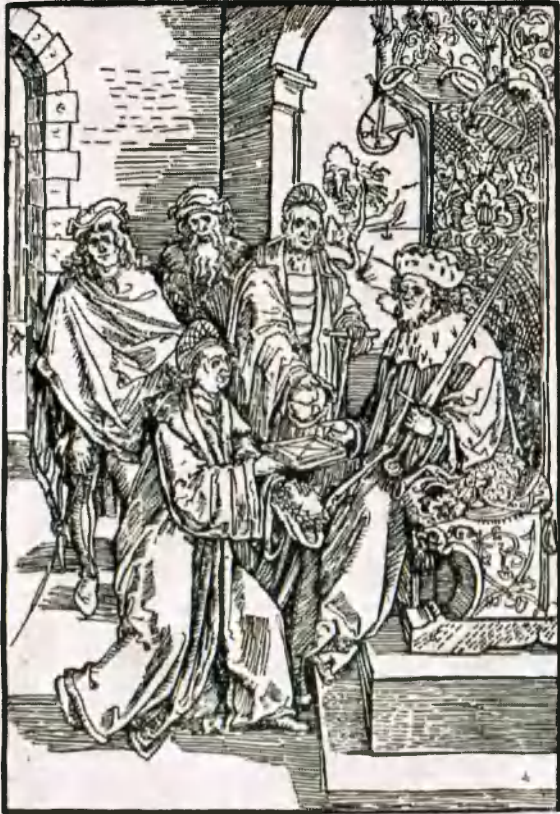
А. Дюрер. Конрад Цельтис подносит свой труд курфюрсту Саксонскому Фридриху Мудрому