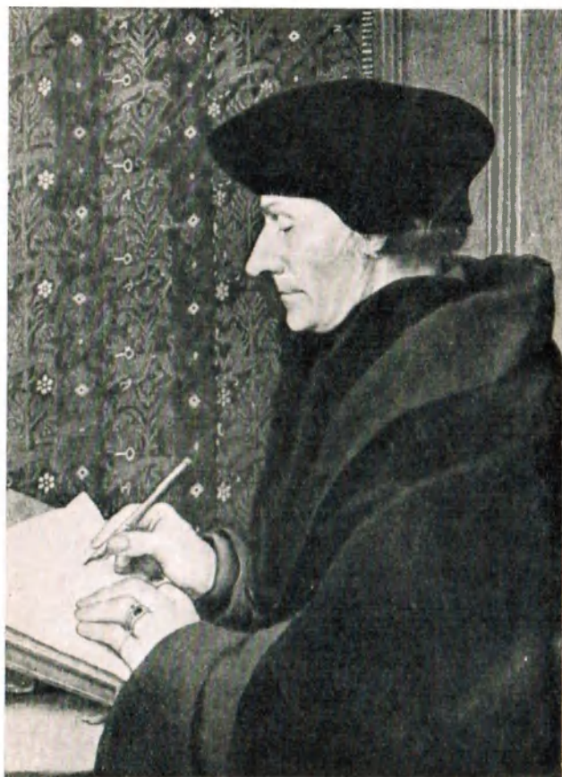
Ганс Гольбейн Младший. Эразм Роттердамский. Париж, Лувр