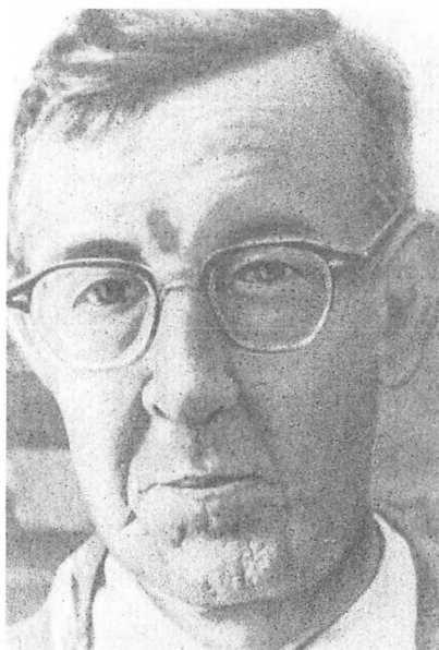
Питирим Александрович Сорокин в 70-летнем возрасте. Г. Винчестер штата Массачусетс (США). 1962(?) год.