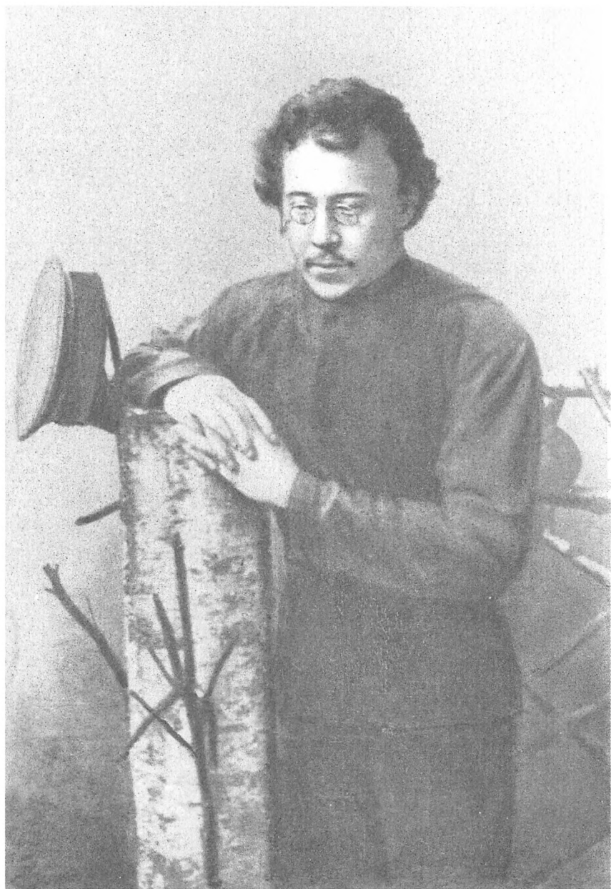
Питирим Сорокин в 1910 году. Великий Устюг.