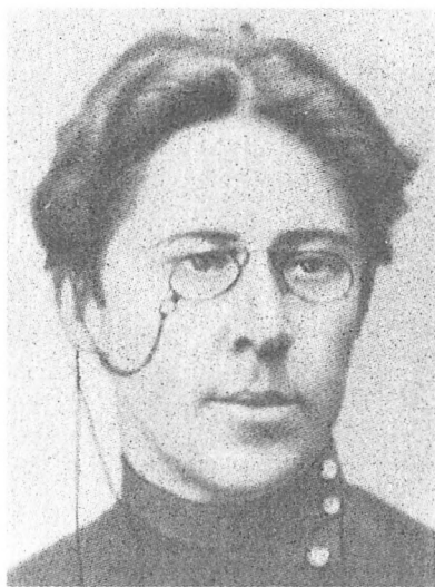
Питирим Сорокин, студент юридического факультета Санкт-Петербургского университета. 1911 год.