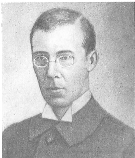
Питирим Сорокин в период выборов в Учредительное собрание. 1917 год.