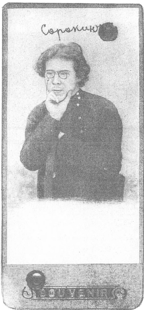
Питирим Сорокин в 1909 году. Фотография со свидетельства об окончании Великоустюжской мужской гимназии.