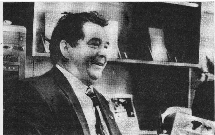
Председатель правления РАО «Газпром» Р. И. Вяхирев