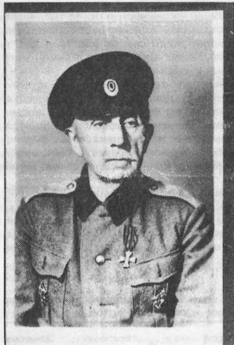
П. Н. Краснов. Фото из следственного дела НКВД. 1945 г.

Алеша Попович — герои народного эпоса, защищали Русскую землю от несметной татарской силы (врага внешнего), от Соловья-Разбойника (врага внутреннего), от Идолища поганого (защита быта и веры православной).