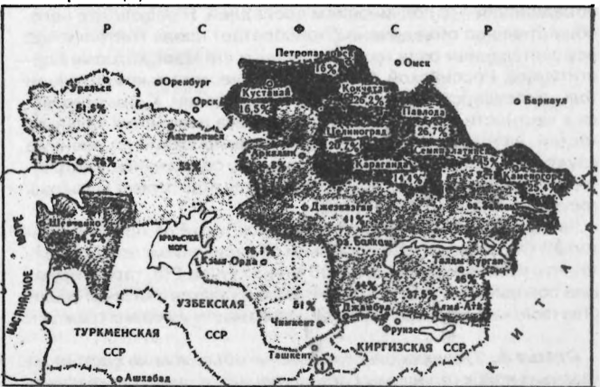
СХЕМА. КОЛИЧЕСТВО КАЗАХСКОГО НАСЕЛЕНИЯ ПО ОБЛАСТЯМ НА 1.01.1989 г. ■ Области с населением казахов 30—76% ■ Области с населением казахов 36—46% ■ Области с населением казахов 14—27% — Границы Казахской ССР и других республик — Границы областей Таджикистан ССР Продолжение на стр. 9

Однако все это лишь теория. На практике любой достаточно масштабный конфликт казачества с "армией" Казахстана возможен только при явном или хотя бы тайном "нейтралитете" России. Стоит ей перекрыть маршруты к границе, и в зоне боев не появится значительных сил