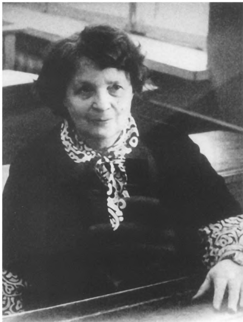
И. Грекова. Конец 60-х – начало 70-х годов