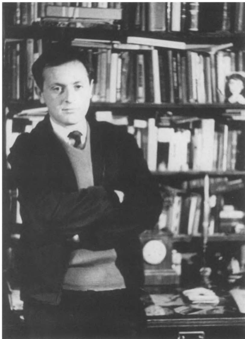
Иосиф Бродский в своей комнате в Ленинграде. На второй полке сверху, справа, стоит фотография Ф.А. – та же, что на обложке этой книги. Фото Иосифа сделано в 1968 г. его отцом А.И. Бродским, который после отъезда сына передал его М.И. Мильчику, любезно представившему нам это фото.