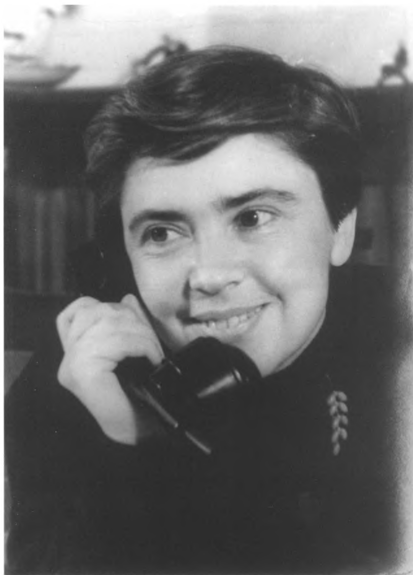
Фрида Вигдорова. Осень 1958 г.