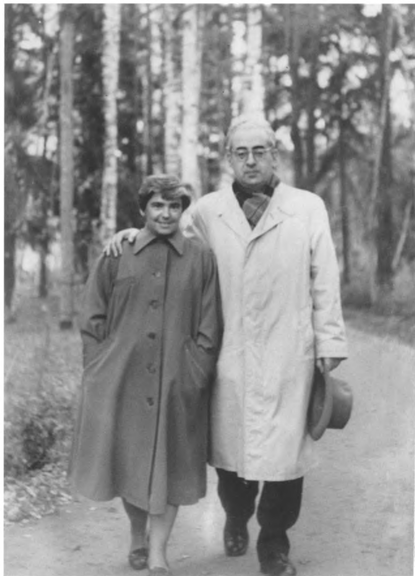
Ф.А. с мужем А.Б. Раскиным. Переделкино, 1962 г.