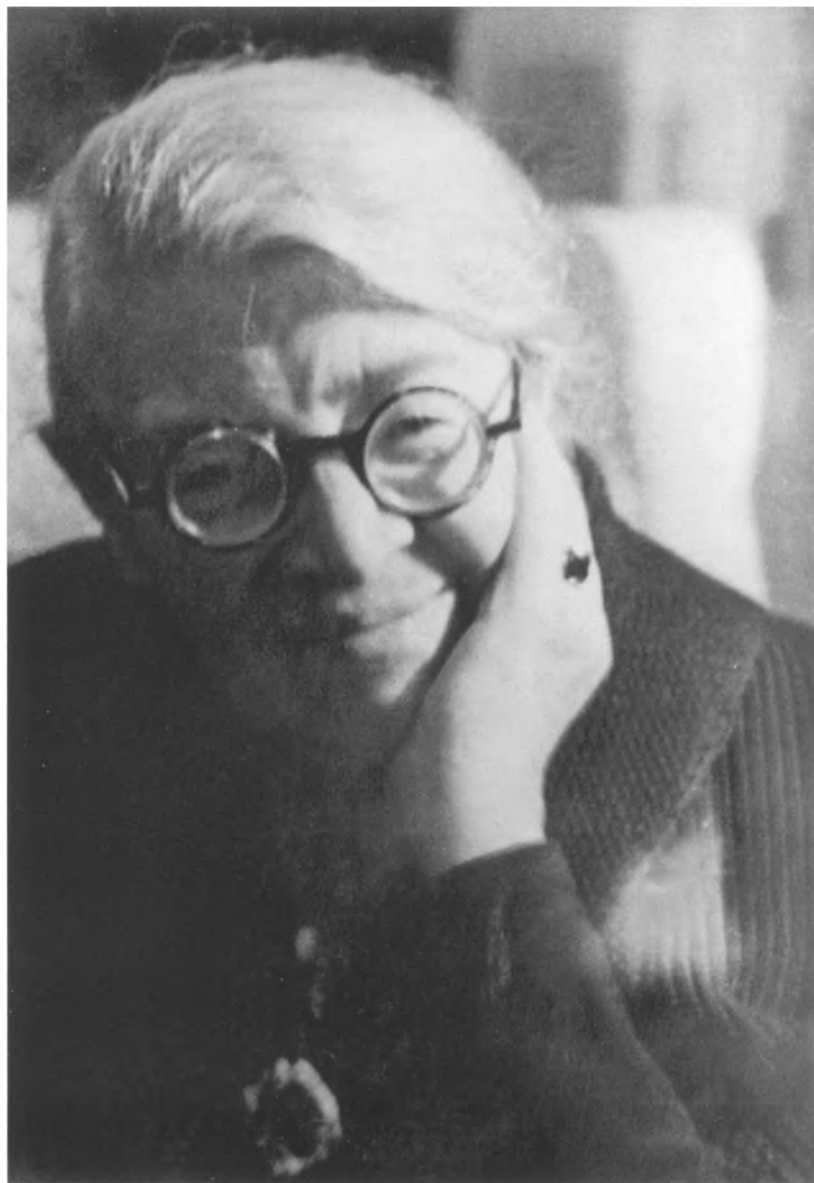
А.Я. Бруштейн. 1960-е годы.