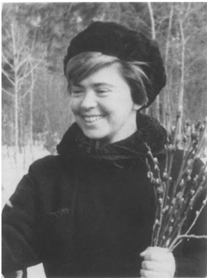
Одна из последних фотографий Ф.А. Перedelкино, март 1965 г.