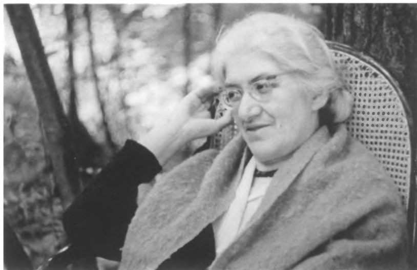
Л.К. Чуковская. 1965 г.