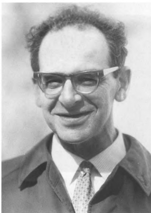
Е.Г. Эткинд. Конец 60-х годов