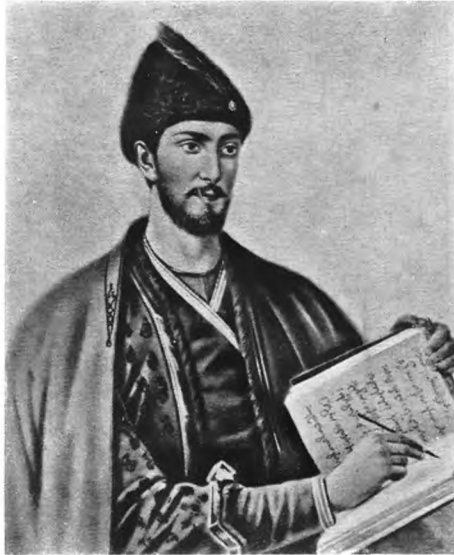
Шота Руставели Chota Roustavéli