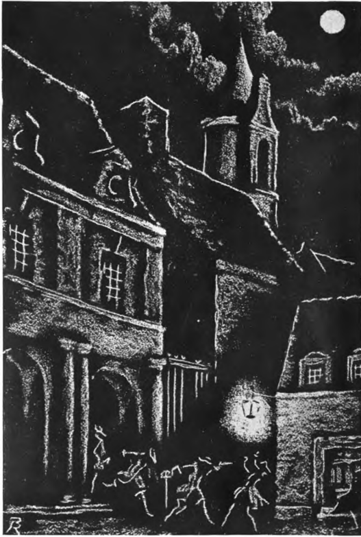
Иллюстрация В. М. Конашевича к „Манон Леско“ L'Abbé Prévost. „Manon Lescaut“. Dessin de V. Conachevitch