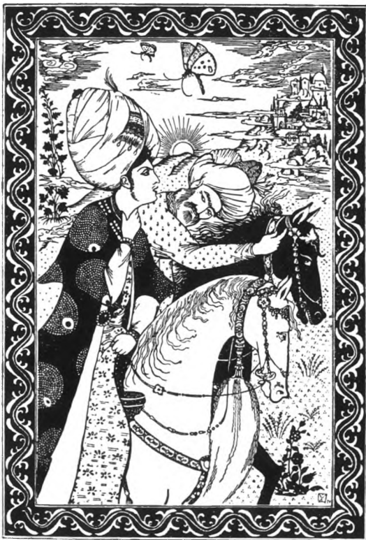
Фронтиспис Н. А. Ушина к книге „1001 ночь“ „Livre des Mille et une nuits“. Frontispice dessiné par N. A. Uchine