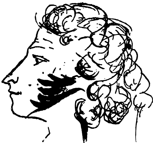
Александр Пушкин. Автопортрет Alexandre Pouchkine. Autoportrait