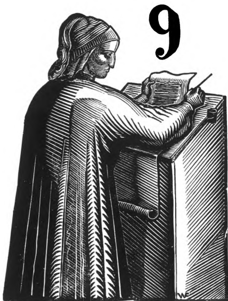
Фронтиспис В. А. Фаворского к „Vita nova“ Данте Dante. „Vita nova“. Frontispice dessiné par V. Favorski