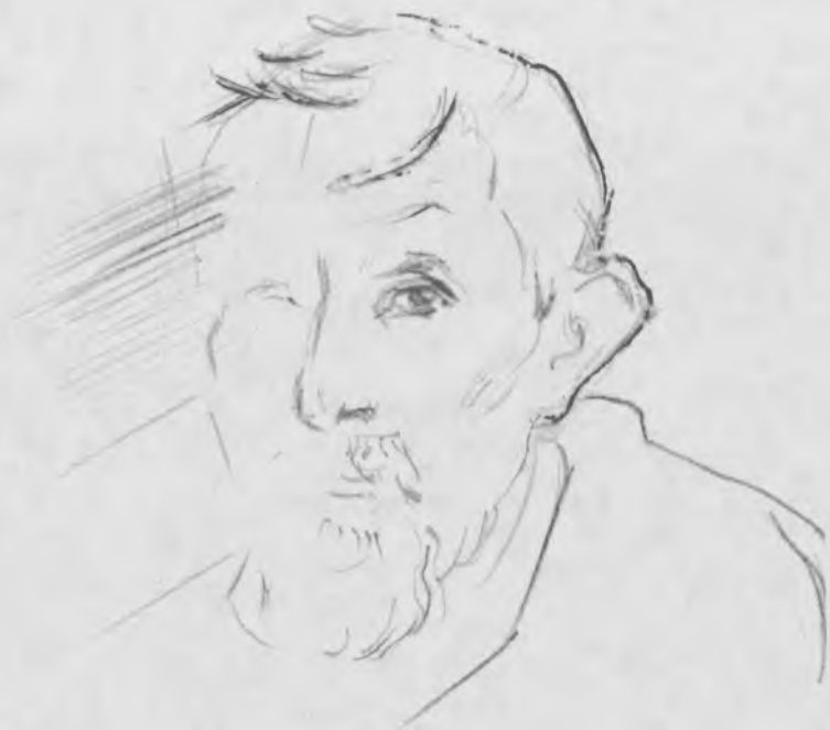
рис. Н.Н. Гласкова