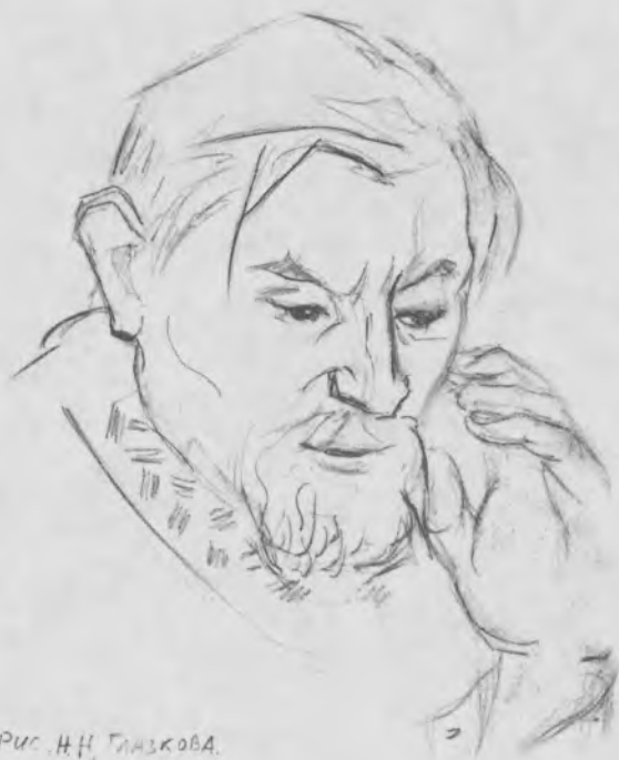
Рис. Н. Н. ГИЗКОВА.