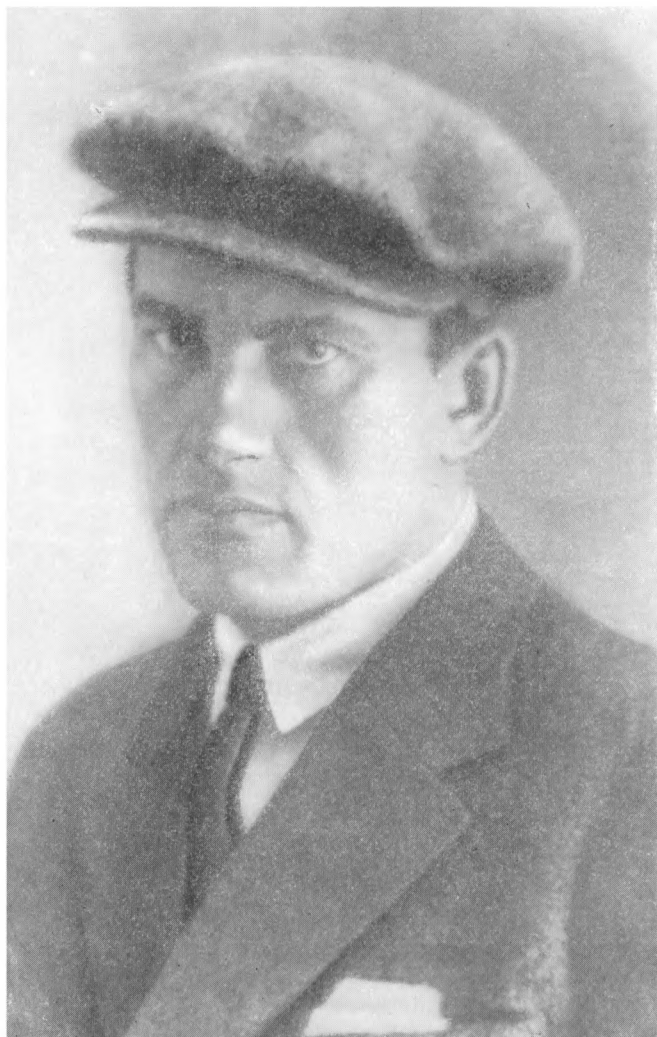
В. МАЯКОВСКИЙ Фото. 1929 г.