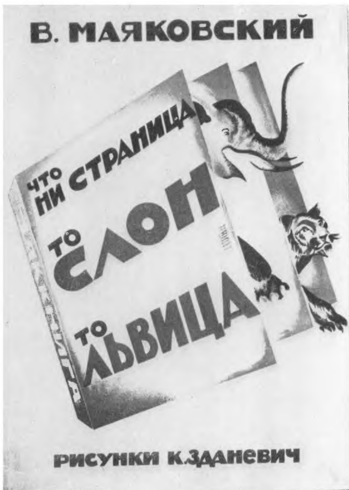
Обложка книжки для детей «Что ни страница,— то слон, то львица».