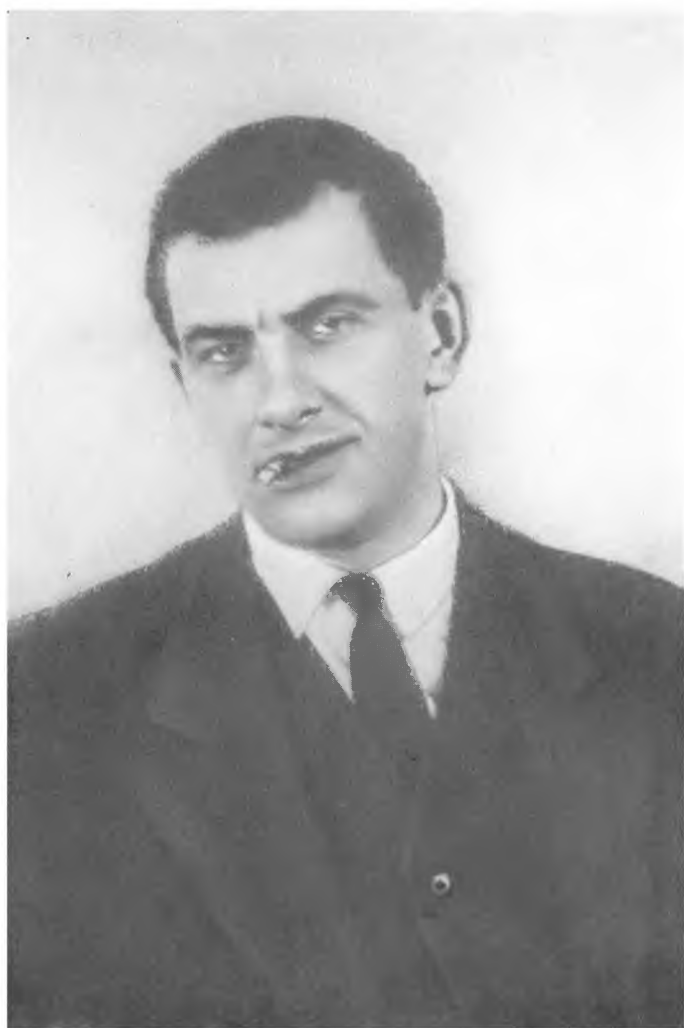
В. МАЯКОВСКИЙ. Фото. 1929 г.