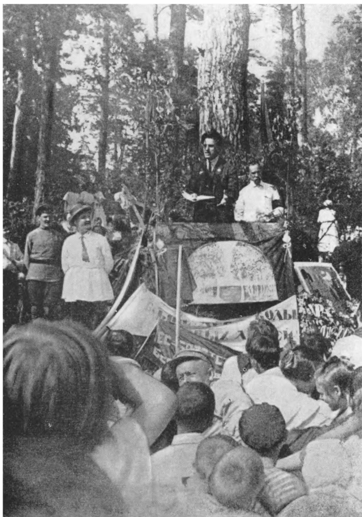
Выступление Маяковского перед школьниками в Сокольниках 10 мая 1925 г.