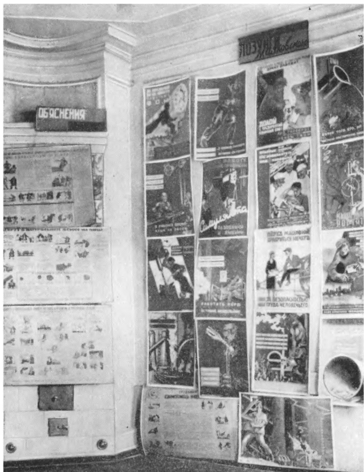
Стенд выставки «20 лет работы Маяковского».