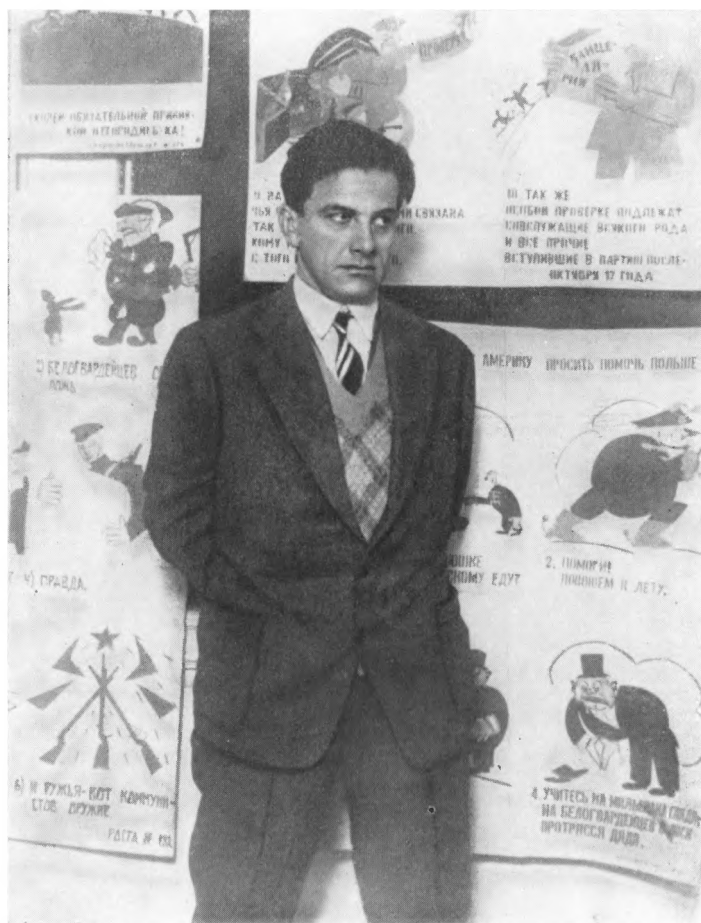
В. Маяковский на выставке «20 лет работы Маяковского».