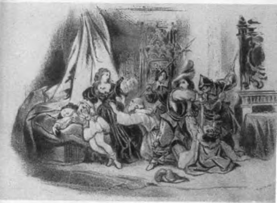
Иллюстрация к «Христине Шведской» (акт V). С литографии Ашиля Девериа.