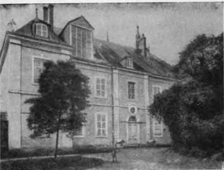
Ноан — имение Жорж Санд.