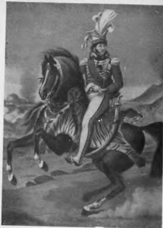
Иоалим Мюрат. С картины А. Ж. Гро