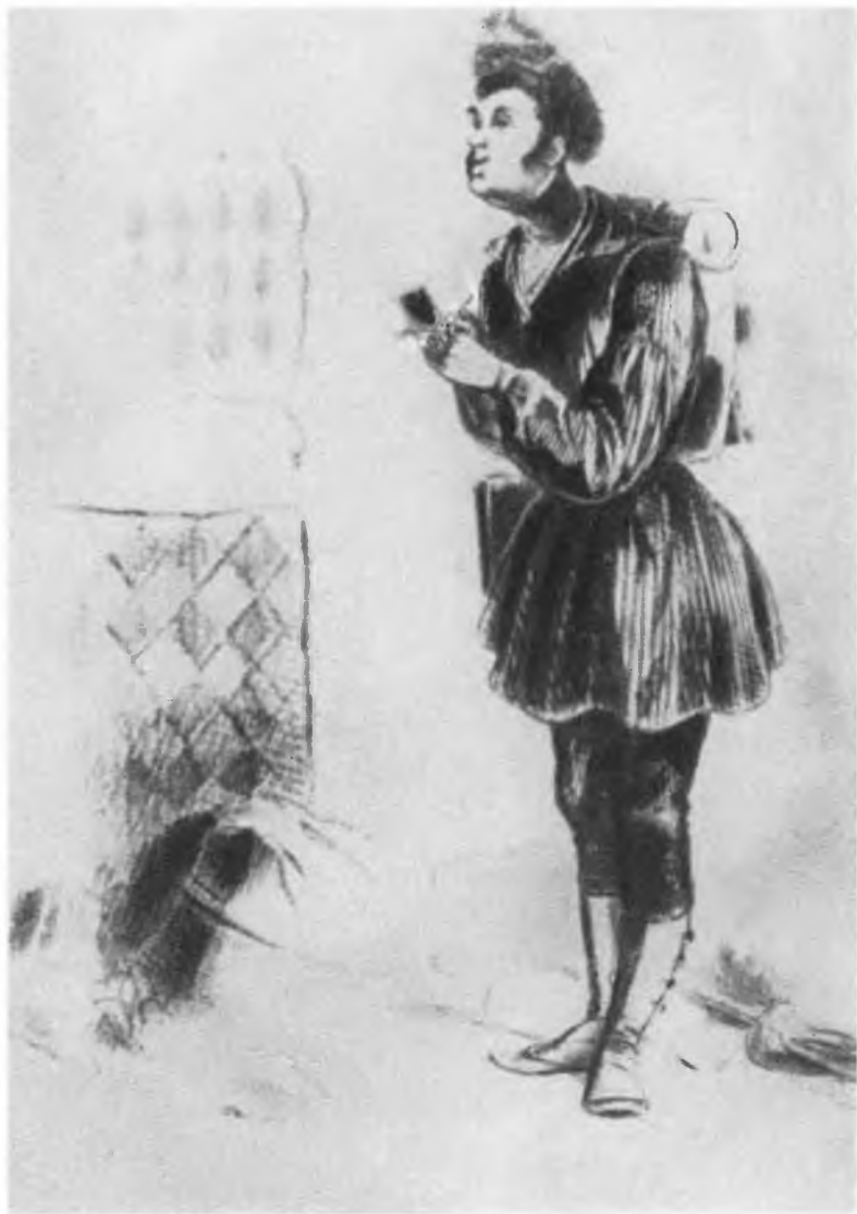
А. Дюма-отец в охотничьем costume. С штографии Платье.