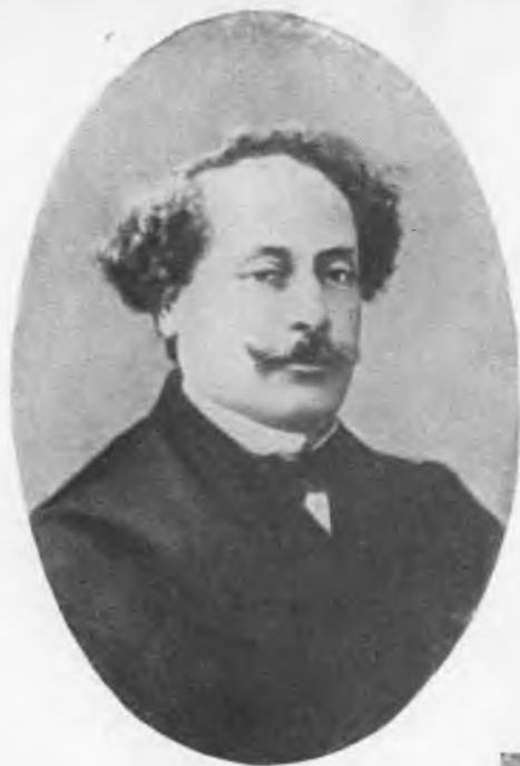
Александр Дюма-сын в 1864 году.