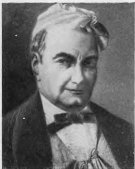
Сент-Бёв С портрета работы Демарка