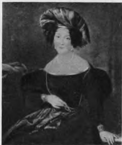
Мадемуазель Марс. С картины Кинсэна.