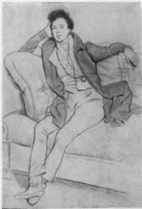
А. Дюма-отец. С рисунка Ашля Девериа.