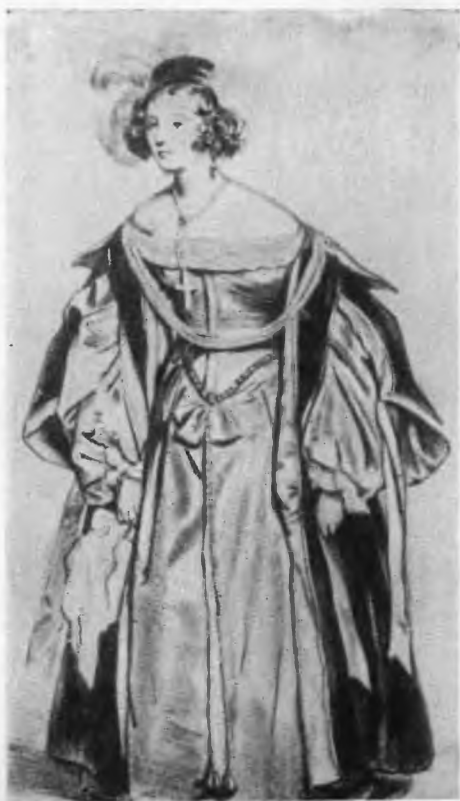
Мари Дорваль в роли Марион Делорм. С цветной литографии Ашиля Девериа.