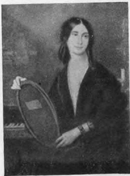
Марселлина Деборд-Вальмор С портрета работы Илера Ледрю.