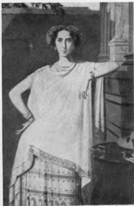
Рашель Портрет работы Амори Дюваля.