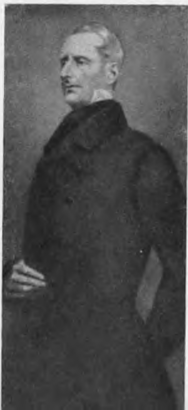
Ламартин. С портрета Гонзаго Привата.