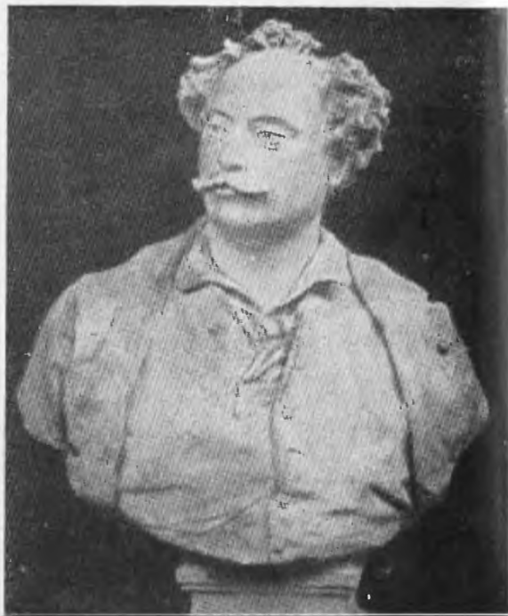
А. Дюма-сын Бюст работы Карно.