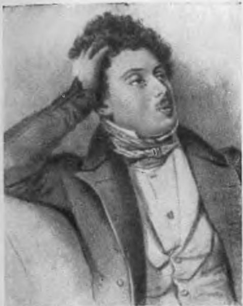
А. Дюма-сын в молодости. С литографии Риссо по рисунку Ноэля.