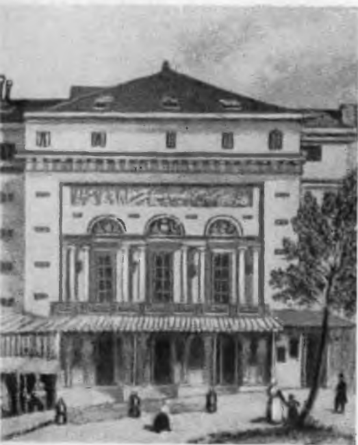
Порт-Сен-Мартэн. С гравюры А. Тессара.