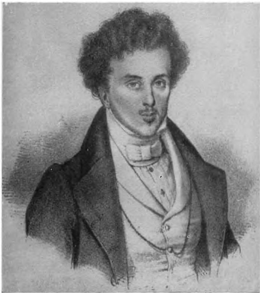
А. Дюма-отец в 1832 году