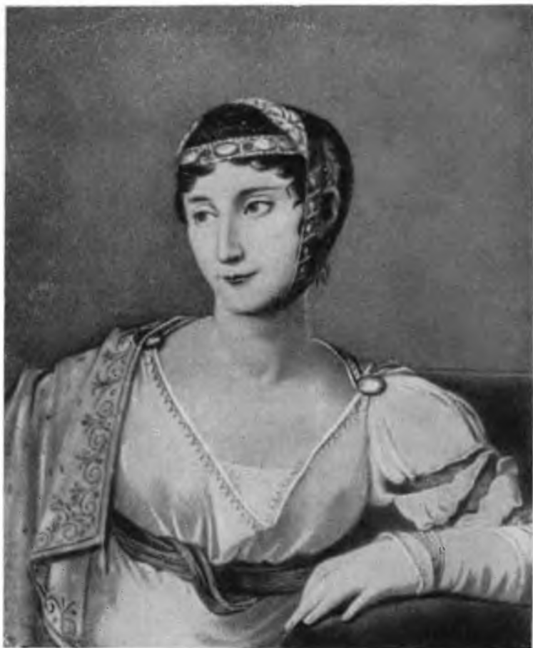
Полина Бонапарт, княгиня Боргезе. С портрета работы Лефевра.