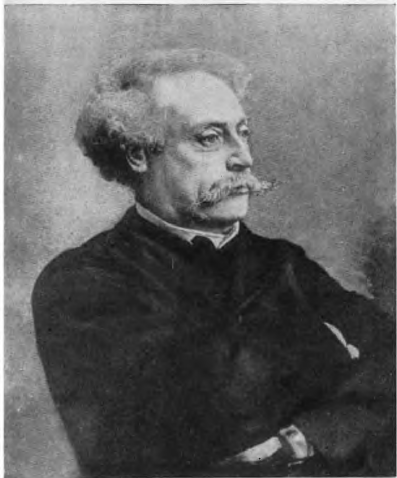
А. Дюма-сын. С портрета работы Леона Бонна.