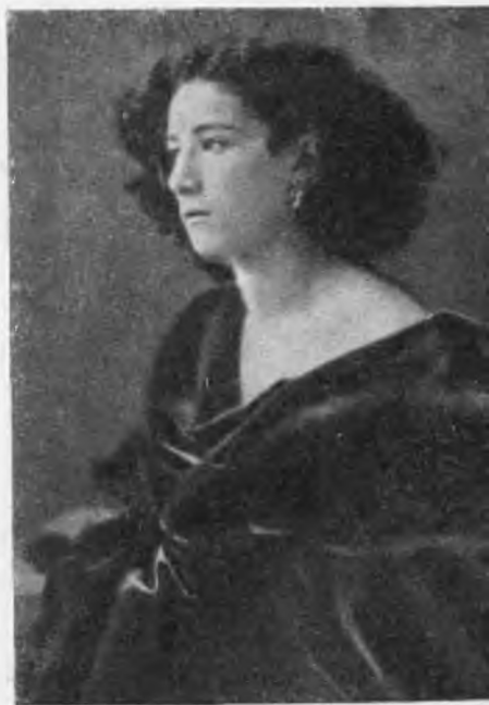
Сара Бернар. Фотография.