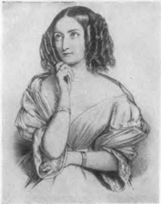
Дельфина Гэ С современной литографии.