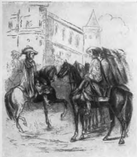
Иллюстрация Босэ к роману «Три мушкетера». Париж, Кальман-Леви, 1884.