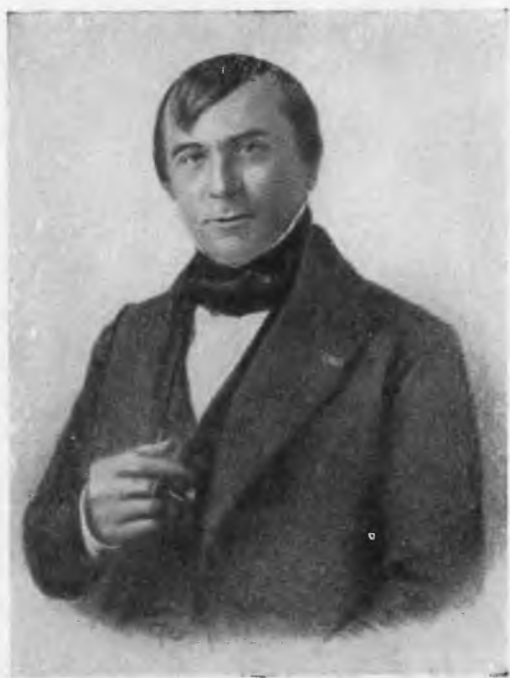
Эмиль де Жирардэн.