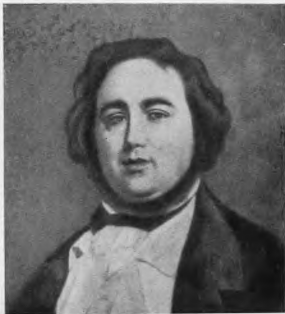
Жюль Жанен. С портрета работы Шанмартена.