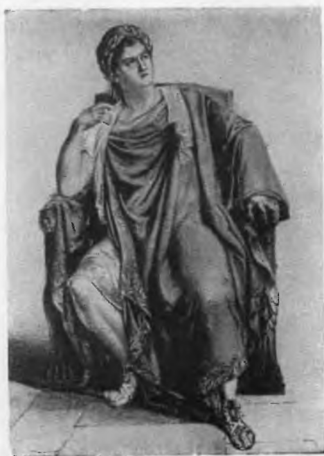
Тальма в роли Нерона («Британик»). С современной гравюры.