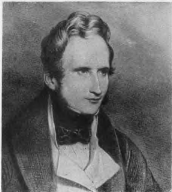
Альфред де Виньи С литографии Ашиля Деверип