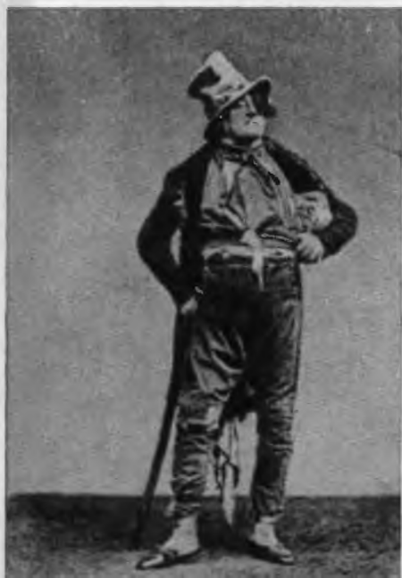
Фредерик Леметр в роли Робера Макера («Трактир Адре»).