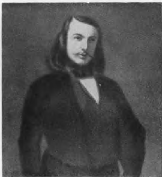
Геофиль Готье С портрета работы Шатийона