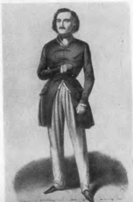
Пьер Бокаж в роли Антони