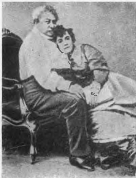
А. Дюма-отец с Адой Менкен.