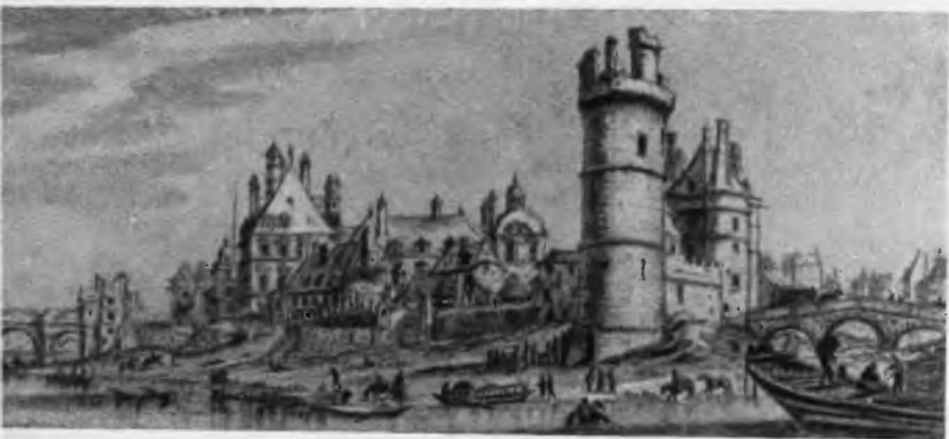
Нельская башня. С гравюры Израэля Сильвестра (середина XVII века).