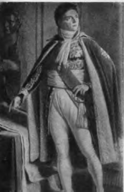
Луи-Александр Бертье. С картины Пажу.