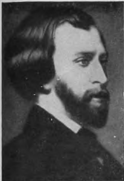
Альфред де Мюссе С портрета работы Шарля Ленделя