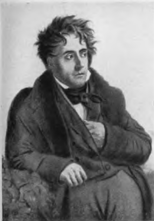
Шатобриан. С портрета работы А.-Л. Жирод де Тиосона.