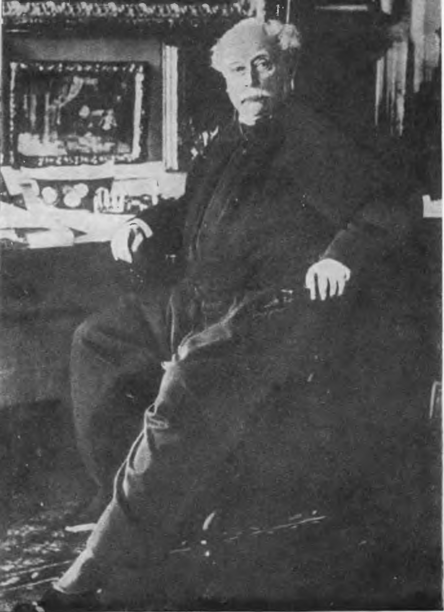
А. Дюма-сын в 1891 году в своей квартире на улице Ампер.