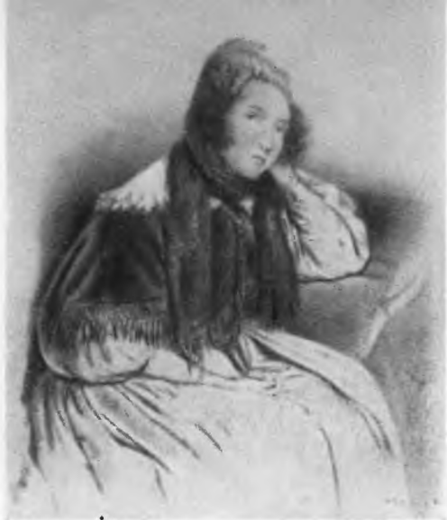
Мари Дорваль С литографии Френ по портрету Леона Нозля.