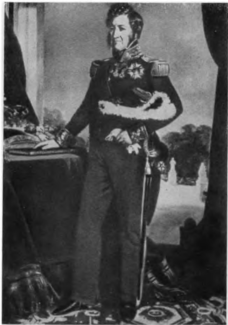
Луи-Филипп. С портрета работы Винтергальгера