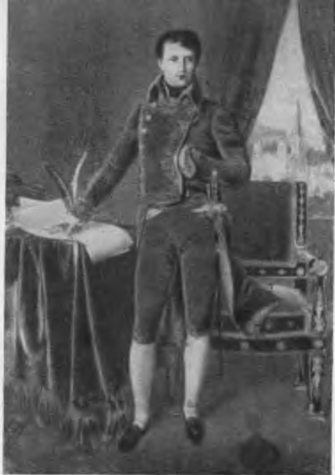
Наполеон Бонапарт, первый консул. С портрета работы Энгера.