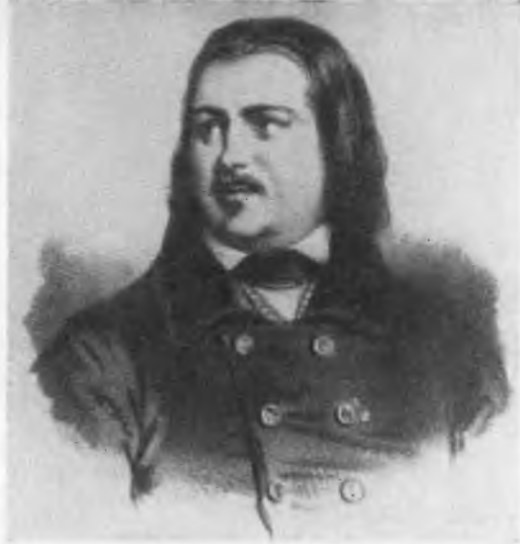
Бальзак. С литографии Жюльена