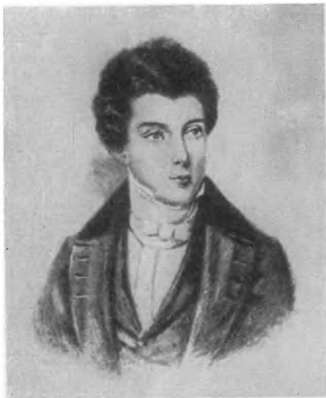
А Дюма сын в молодости.