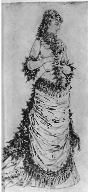
Сара Бернар в роли миссис Кларксон («Иностранка»).