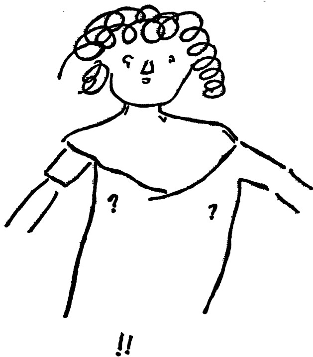
«Точное изображение барышни» Рисунок В. В. Розанова (ИРЛИ. Ф. 256. Оп. 1. № 1)