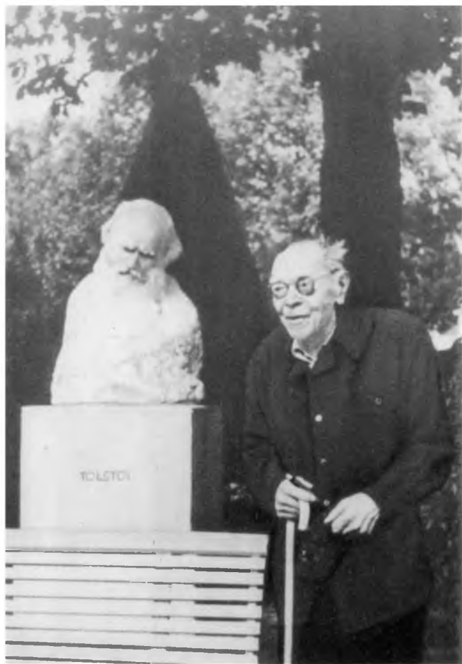
А. М. Ремизов. Париж. 1956 г.