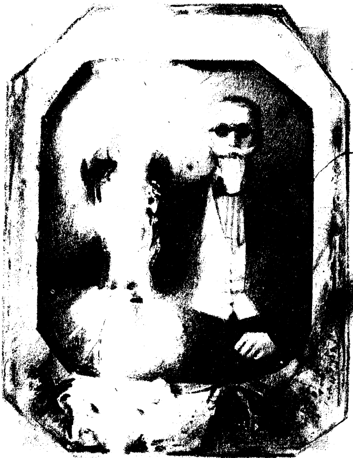
Illustration of a man and a woman in 18th-century attire, framed in an octagonal shape. The man is on the right, wearing a long coat and a cravat, and the woman is on the left, wearing a large, ornate wig and a dress. The image is heavily stylized with high contrast, making details difficult to discern.