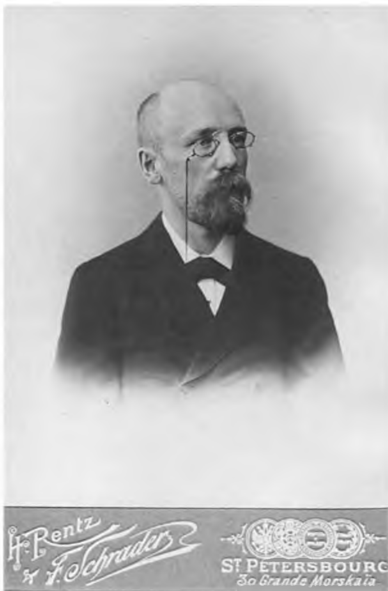
Федор Сологуб. Фотография «Рентц и Шрадер». Санкт-Петербург. 1899 г. Музей ИРЛИ.