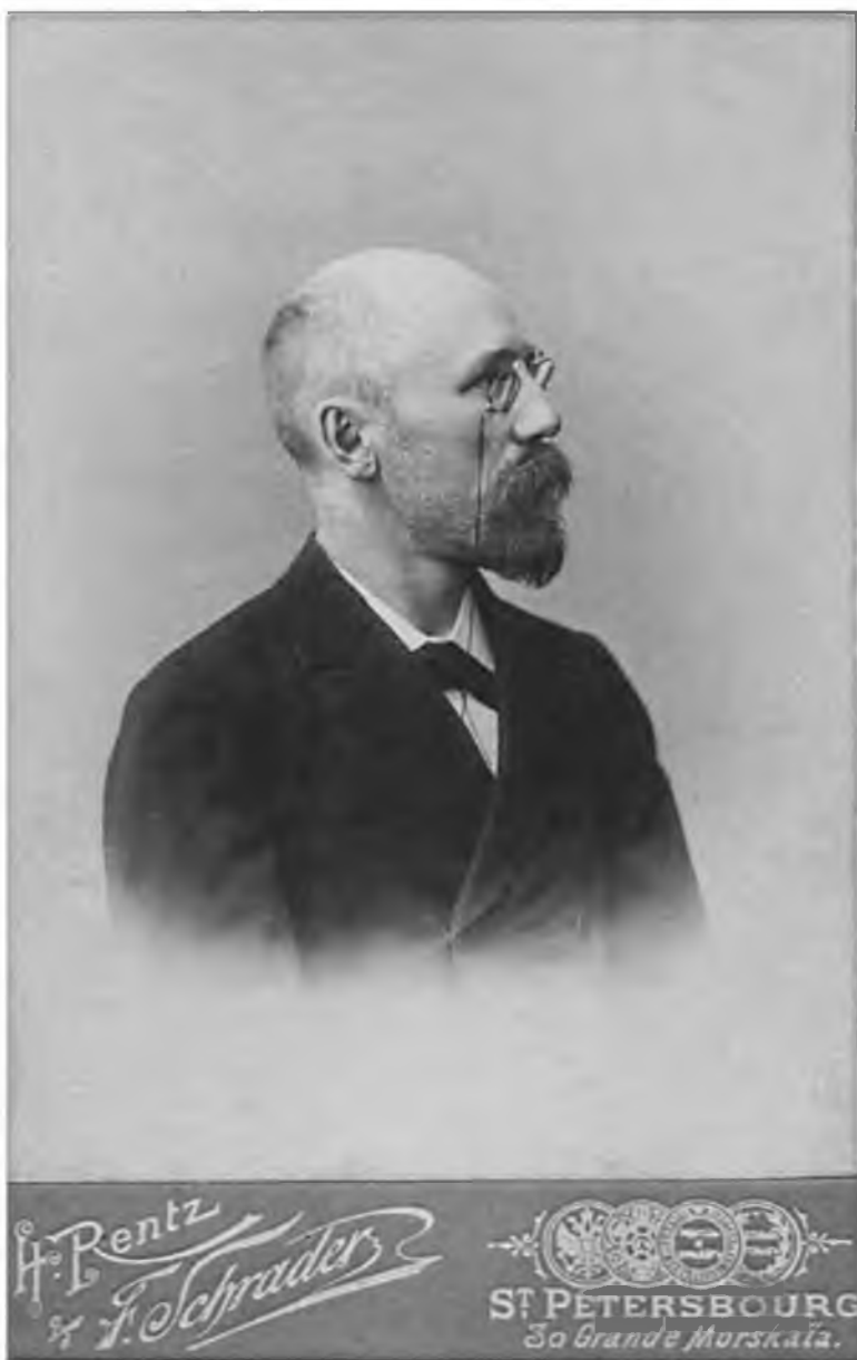
Федор Сологуб. Санкт-Петербург. 1899 г.