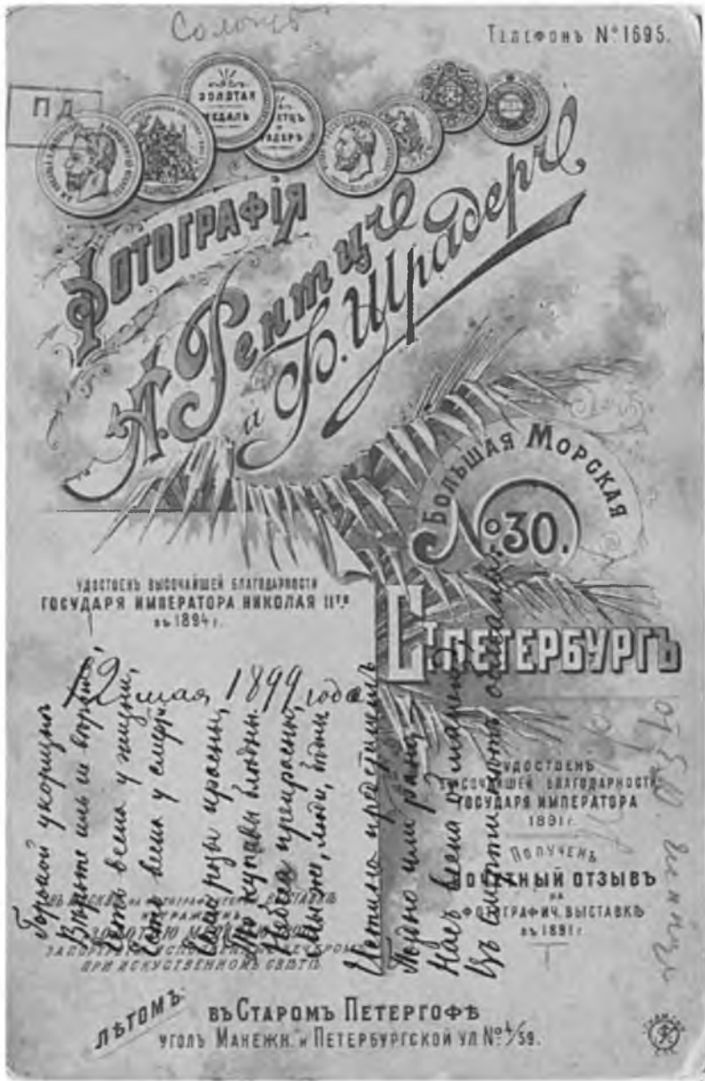
Стихотворение «Горькой укоризне...». 12 мая 1899 г. Автограф. Запись на обороте фотографического портрета Федора Сологуба. Фотография «Рентгено и Шрадер». Санкт-Петербург. 1899 г. Музей ИРЛИ.