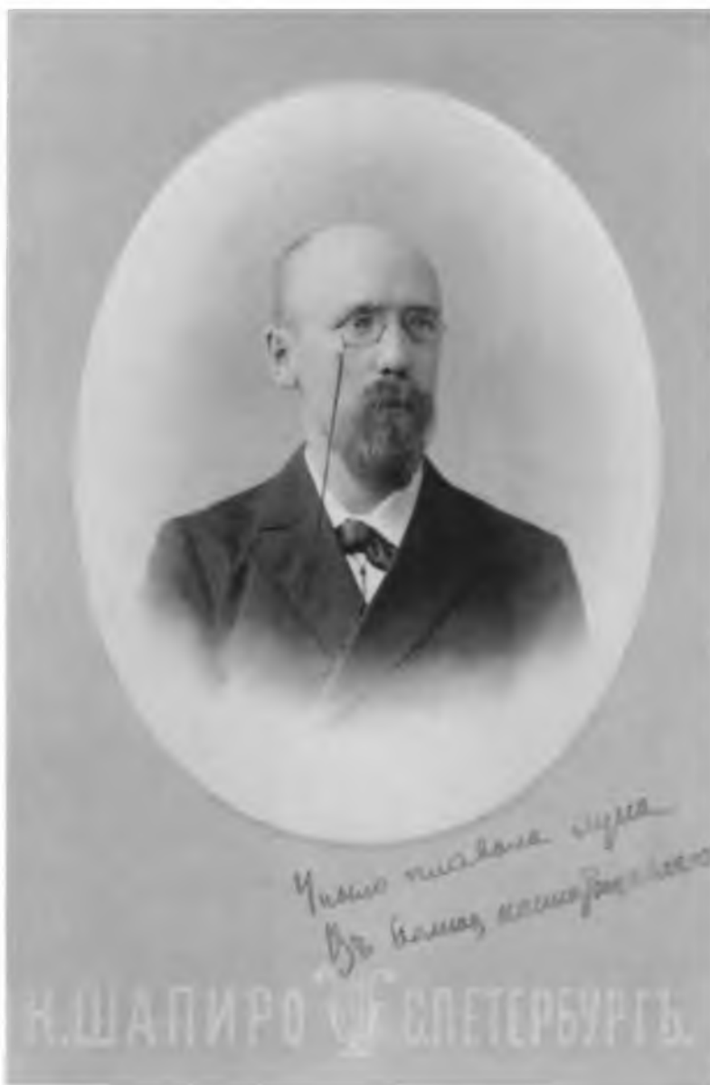
Федор Сологуб. Фотография К. Шапиро. Санкт-Петербург. 1896 г. Музей ИРЛИ.