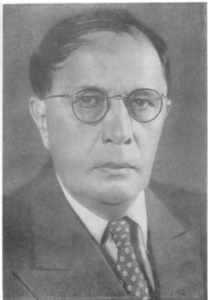
А. Н. ТОЛСТОЙ