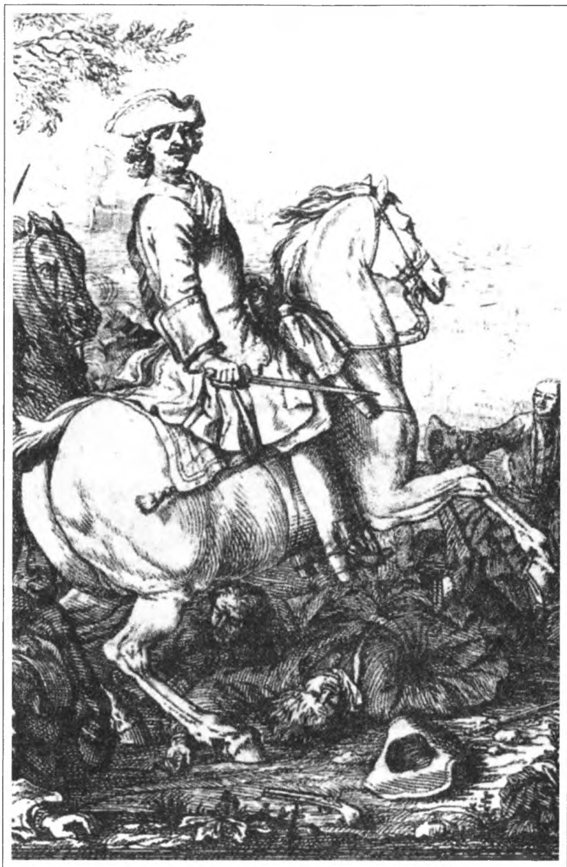
Петр I в Полтавском сражении.