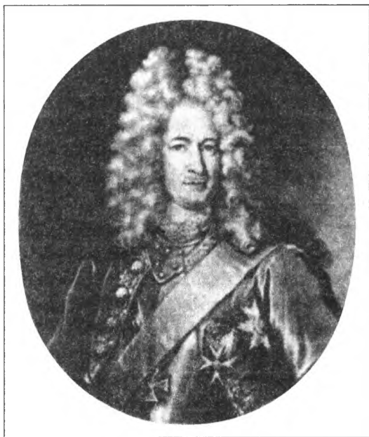
Меншиков А. Д. (1673–1729 гг.). Гравюра С. Лондини. 1697 г.