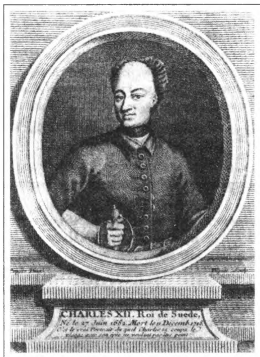
Карл XII. 1697–1718 гг. Гравюра Э. Финке по оригиналу Крафа. Конец XVIII—начало XIX века