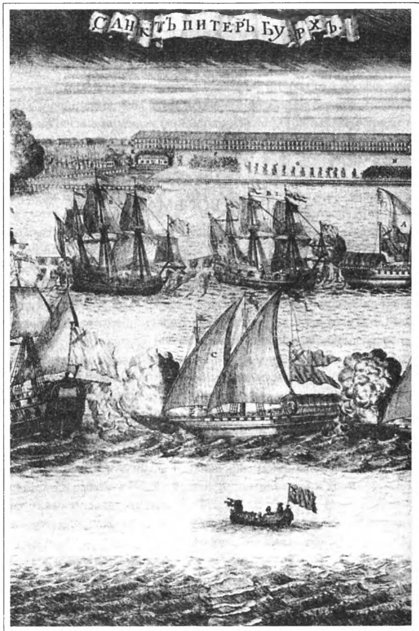
Торжественный въезд в Петербург 8 сентября 1720 г. четырех шведских фрегатов, взятых в плен в сражении при Гренгаме. Гравюра А. Зубова. 1720 г. Фрагмент.