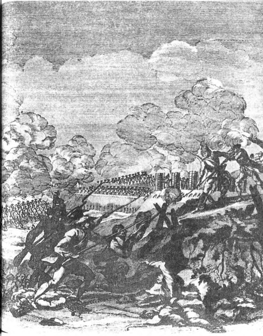
Сражение при Госс-Естердорф 30 августа 1757 г. Гравюра неизвестного художника. 3-я четверть XVIII века