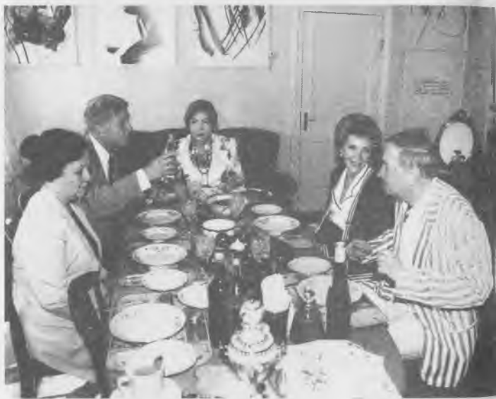
С Ненси Рейган. Переделкино, 1993 г.