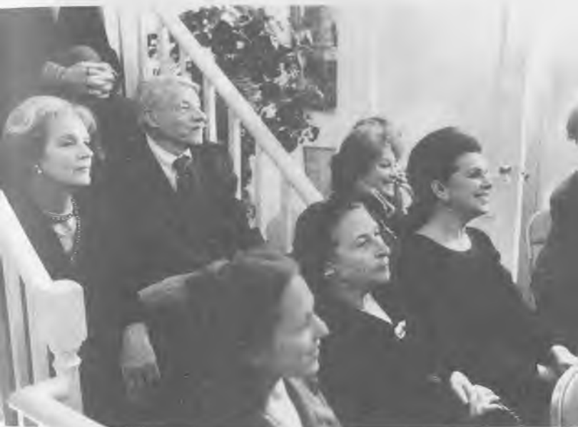
Нью-Йорк, 1972 г. Г.Вишневская и Гарри Солзбери с супругой слушают А.Вознесенского в салоне Т.Яковлевой