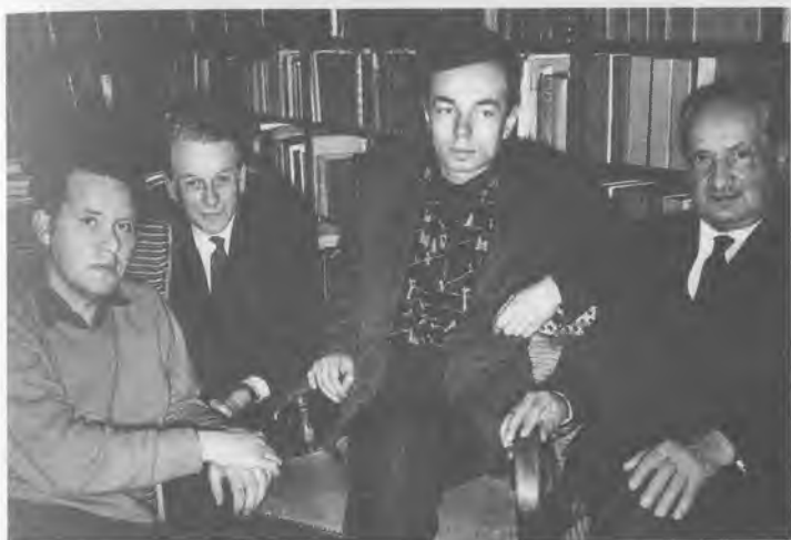
С графом Подвельсом, Мартином Хайдегером. Германия, 1972 г.