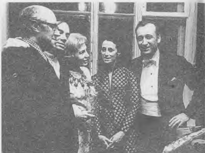
С М.Ростроповичем, З.Богуславской, М.Плисецкой, Р.Щедриным. На исполнении «Поэтории» А.Вознесенского, г. Владимир, 1972 г.