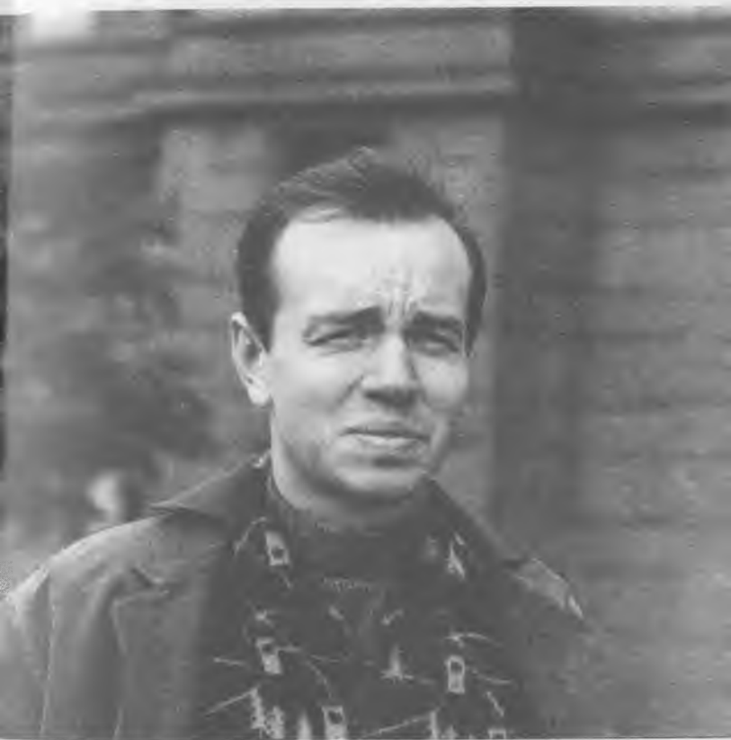
А.Вознесенский, 60-е годы