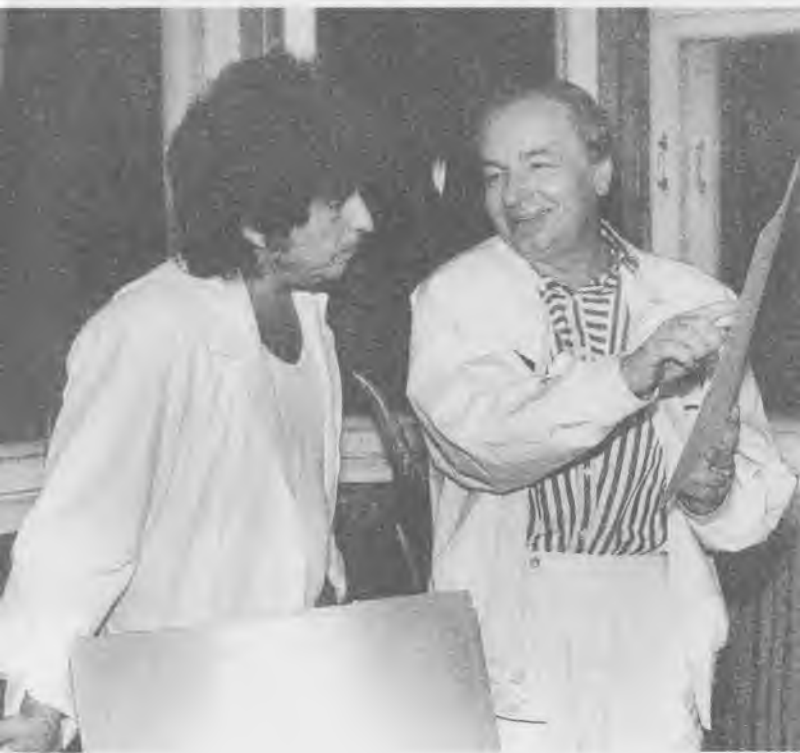
С Бобом Диланом в Переделкино