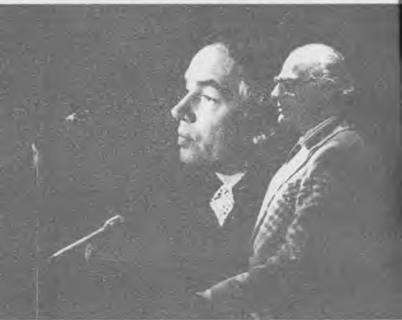
Линкольн-центр, Нью-Йорк, 1967 г. Выступает Артур Миллер.