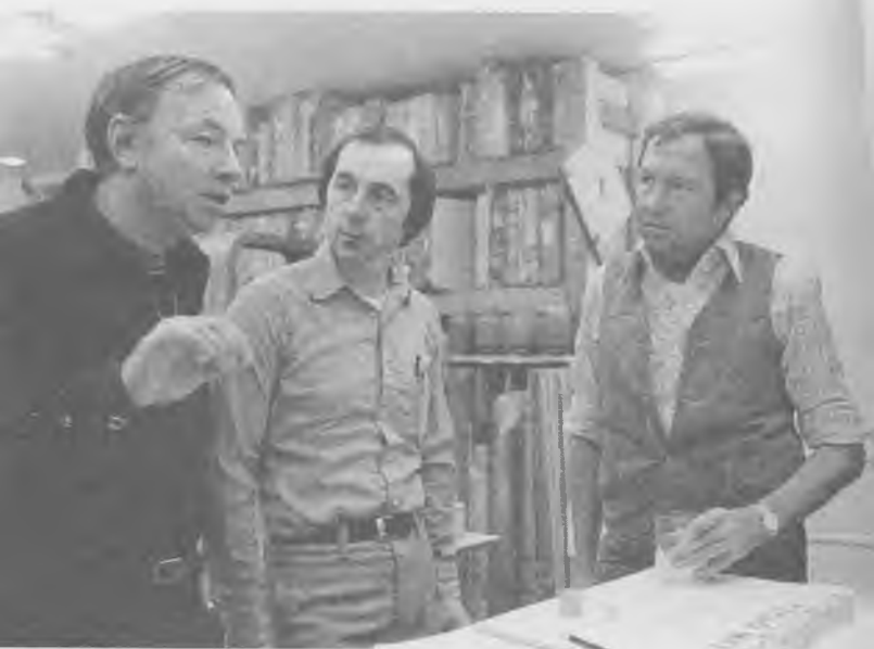
С Бобом Раушенбергом - отцом поп-арта. В его мастерской.