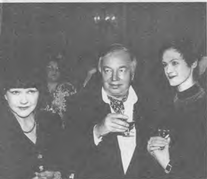
С Б.Ахмадулиной и балериной У.Лопаткиной. Москва, Большой театр, 1998 г.