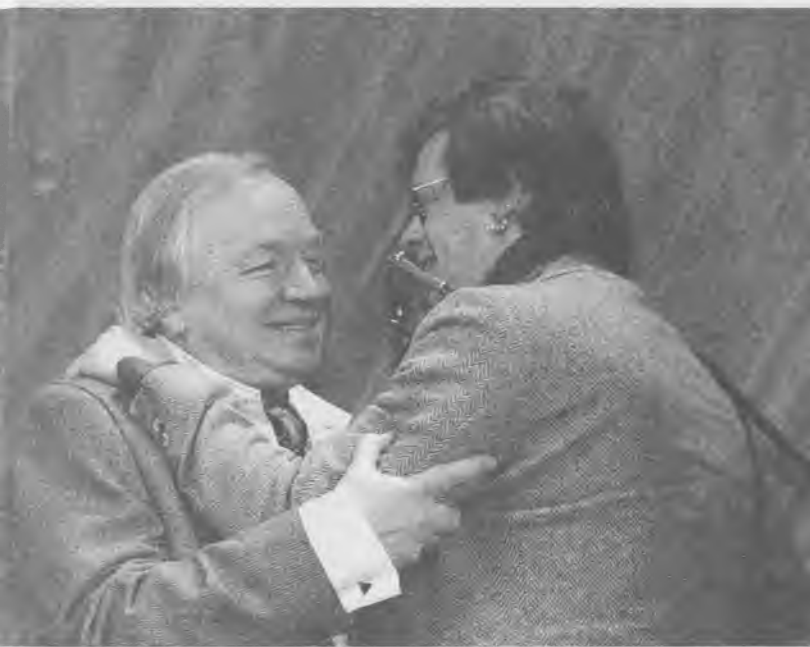
С Борисом Гребенчиковым, 1998 г.