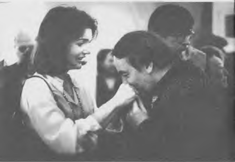
С Жаклин Кеннеди, Нью-Йорк, 1978 г.