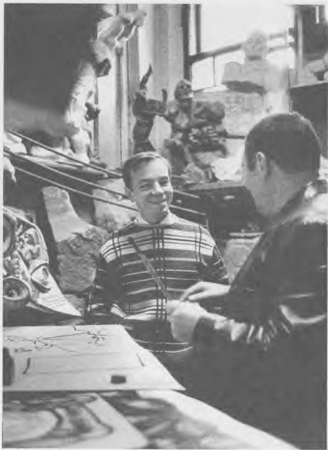
В мастерской Эрнста Неизвестного. Москва, 1963 г.