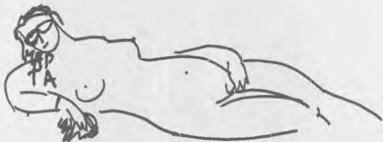
Рисунок А. Вознесенского.