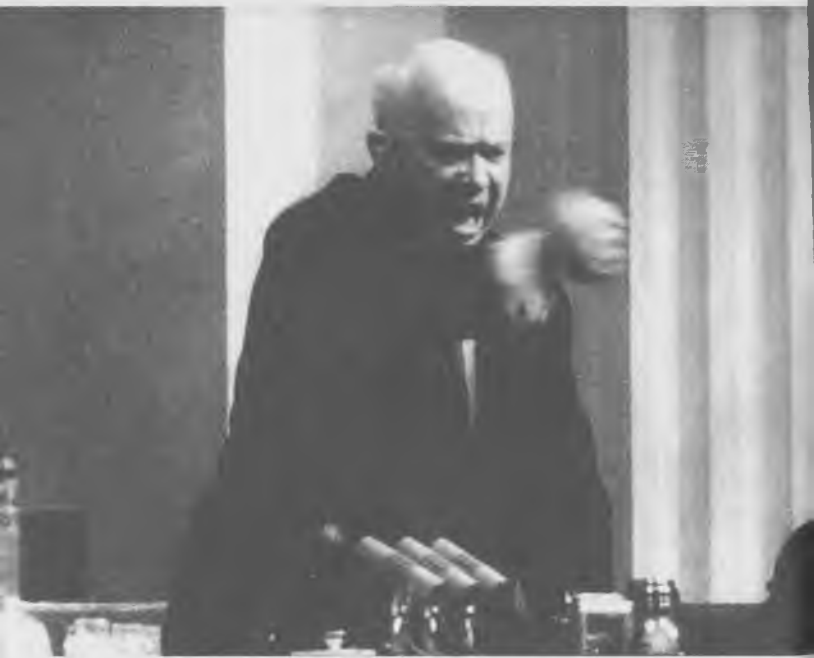
Н.С.Хрущев. Москва, Кремль, 1963 г.