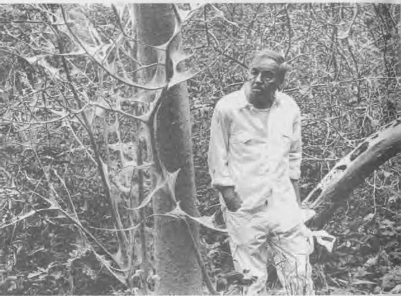
В «мертвом» лесу, 1995 г.