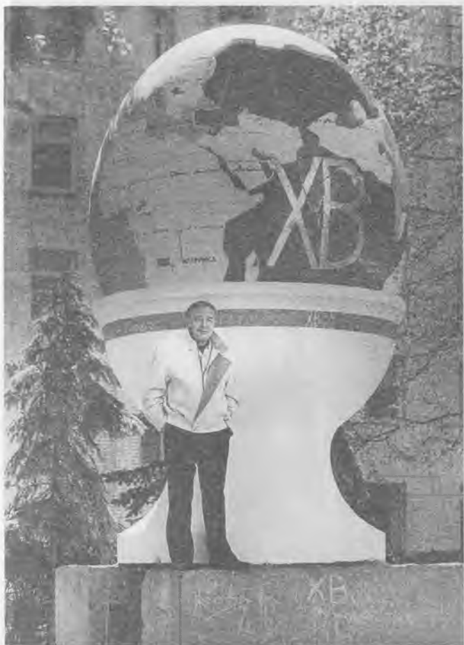
Пасхальная эсталяция. Авторский проект. Москва, ул. Неждановой, 1990 г.