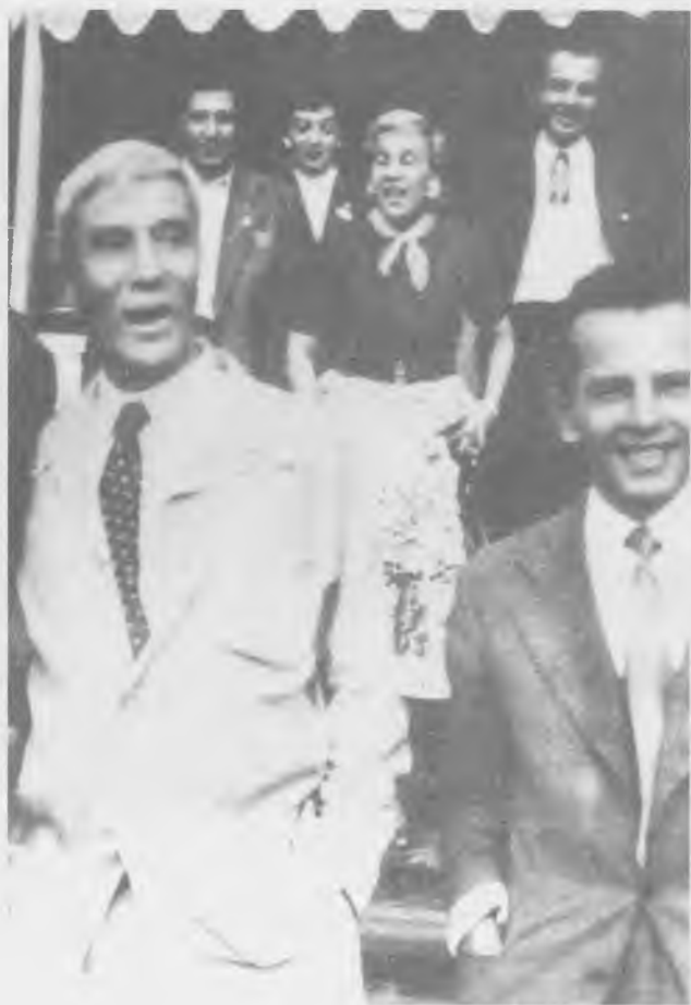
Б.Пастернак. На даче в Перedelкино, 1958 год