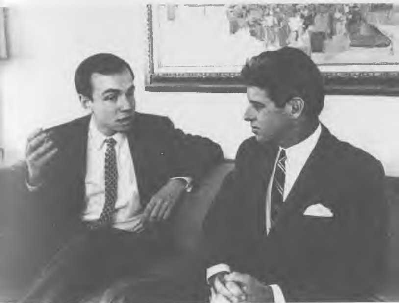
С Робертом Кеннеди. Нью-Йорк, 1967 г.