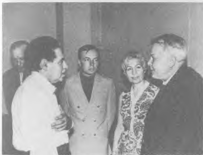
С А.Райкиным, А.Твардовским и З.Богуславской. Дом литератора, Москва, 1970 г.