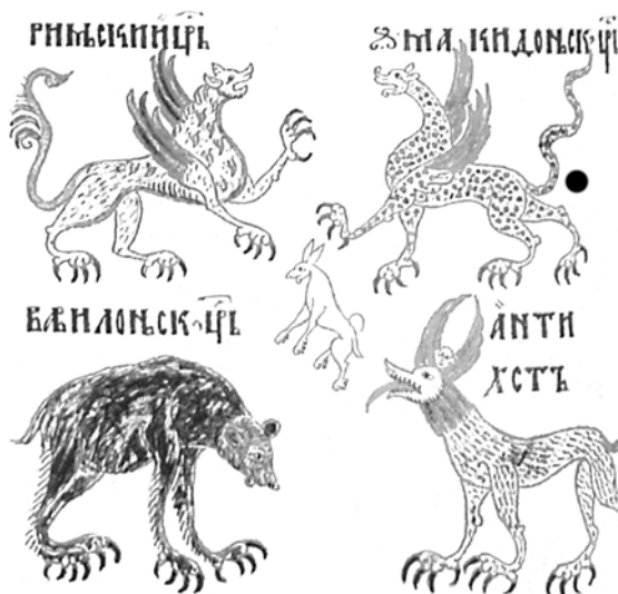
Илл. 3. Фрагмент миниатюры, изображающий животных из видения пророка Даниила (XIV в.).

морфная смерть восседает на льве на множестве икон и миниатюр 1 . Помимо смерти, человека атакует немощь в виде верблюда — это образ восточного происхождения 2 . В известном по гравюрам и миниатюрам с конца XVII века аллегорическом сюжете о распятом монахе 3 встречается ополчившийся на праведника Мир, иногда в виде девушки (в духе Frau Welt), а ча-