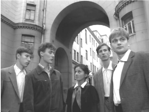
Кадр из фильма «Железный занавес»

Ретро-стистика позволяет экстраполировать десятилетие середины века (1947 — 1957) на всё XX столетие.