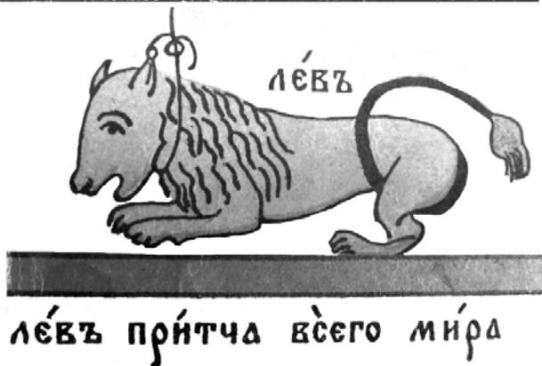
Илл. 1. Фрагменты визуальной аллегории «Душа Чистая» со львами: лубок с гравюры П. Берынды (XVII в.) и рукописная копия по гравюре (XIX в.).

Звери-людоеды изображались на апокалиптических иконах 1 , а в драматургии XVIII в. призыв на свою голову смерти от диких животных сделался клише жалобы влюблённого.