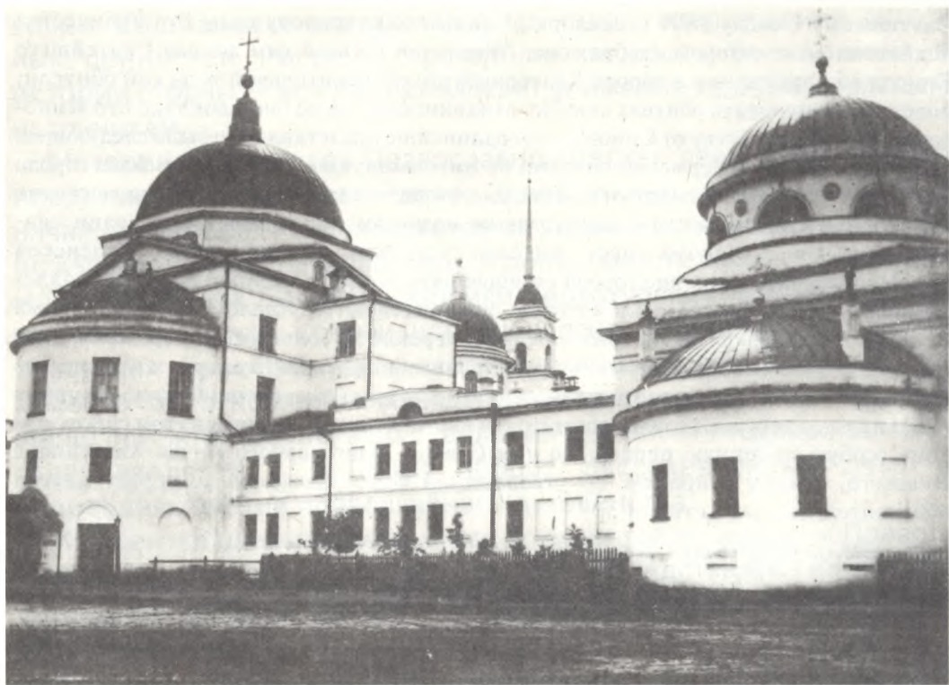
Новотихвинский женский монастырь [конец XIX — начало XX в.]

Православные русские обители. Спб, 1910. — С.167-168.