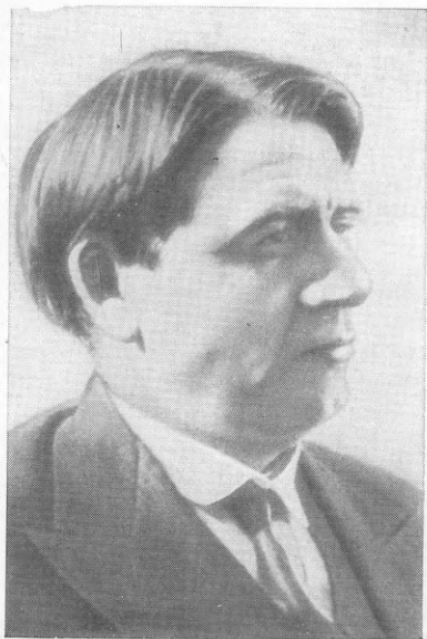
Э. И. Квиринг. 1936 г.