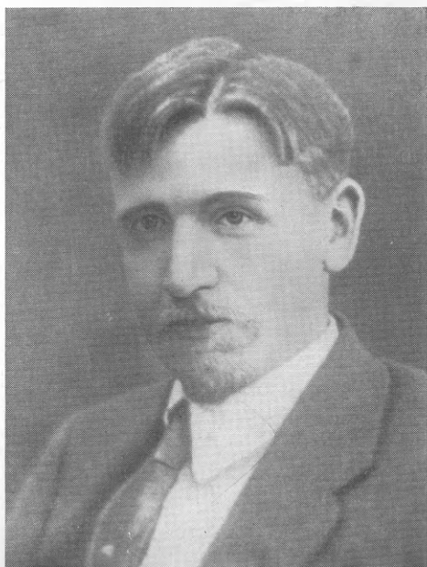
Э. И. Квиринг в Екатеринославе 1917—1918 гг.