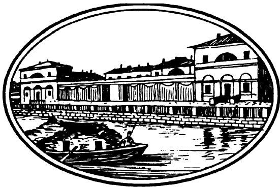
Дом Державина на Фонтанке