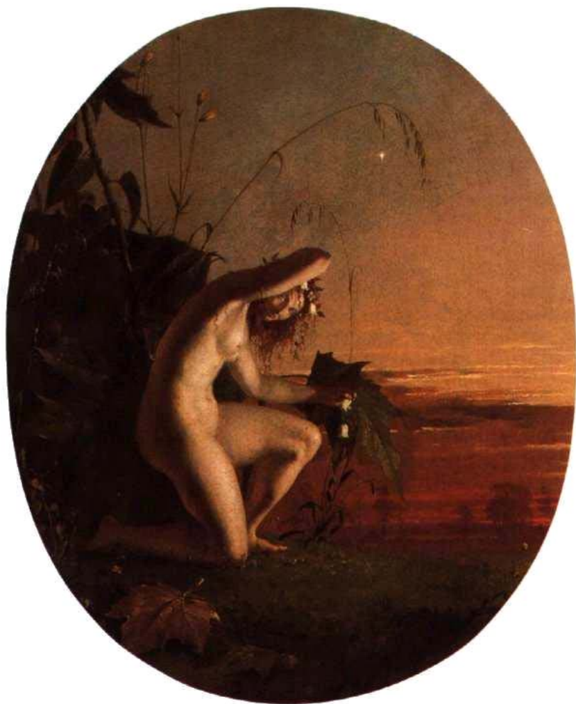
РИЧАРД ДАДД. «ЛОГОВО ФЕЙ»