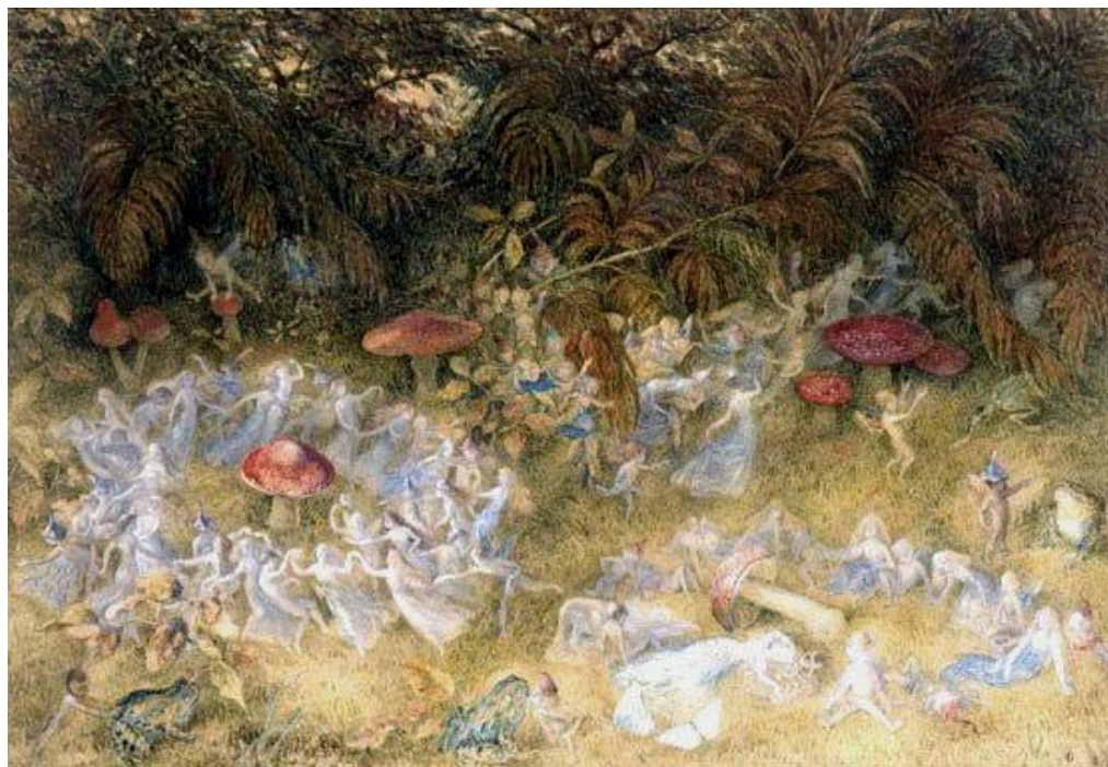
РИЧАРД ДОЙЛЬ. «МУХОМОРЫ И ХОРОВОДЫ ФЕЙ»