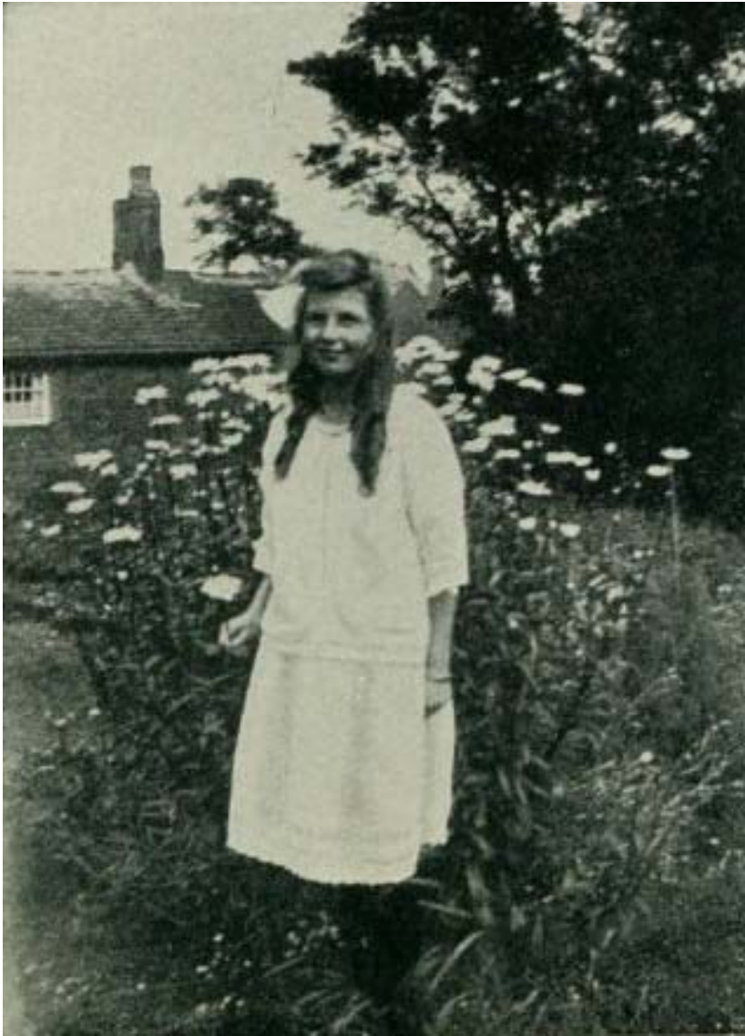
& ФРЕНСИС В 1920 ГОДУ &