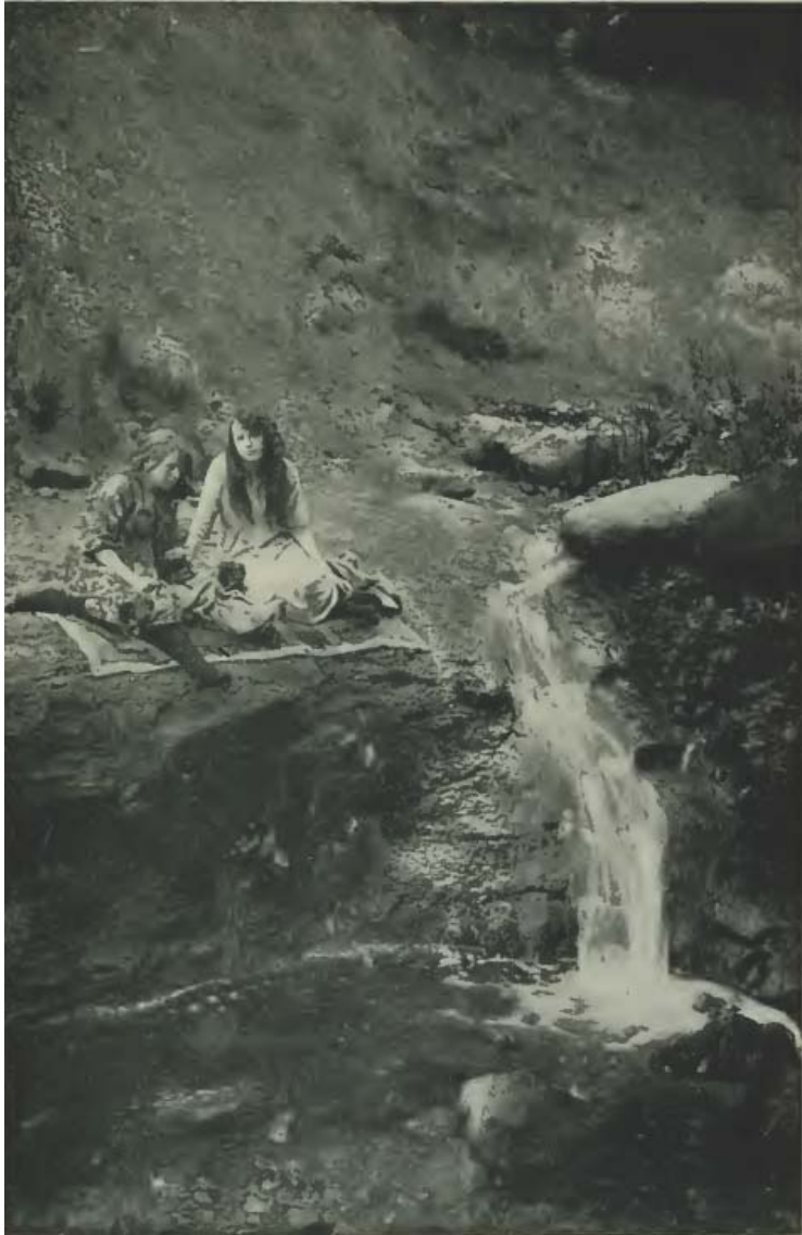
& ВИД РУЧЬЯ В 1921 ГОДУ &