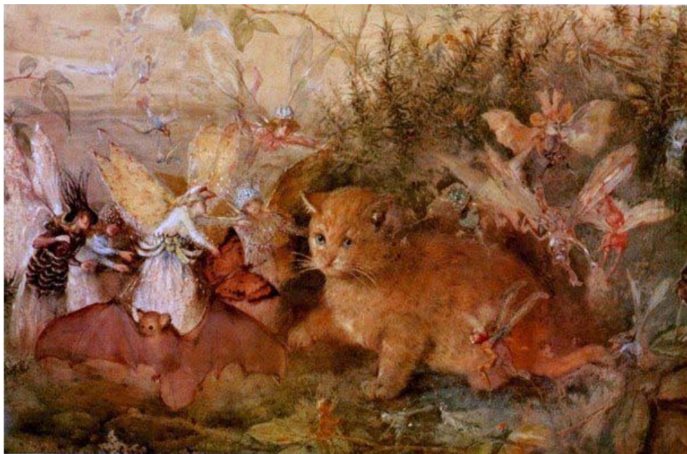
ДЖОН АНСТЕР ФИЦДЖЕРАЛЬД. «КОТ И ФЕИ»