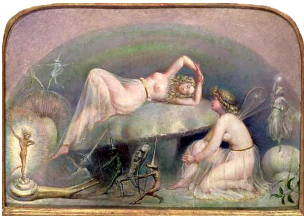
ТОМАС ХИТЕРЛЕЙ. «ФЕЯ, СПЯЩАЯ НА ГРИБЕ»