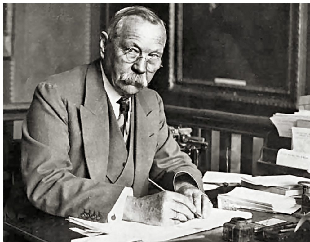
Arthur Conan Doyle.