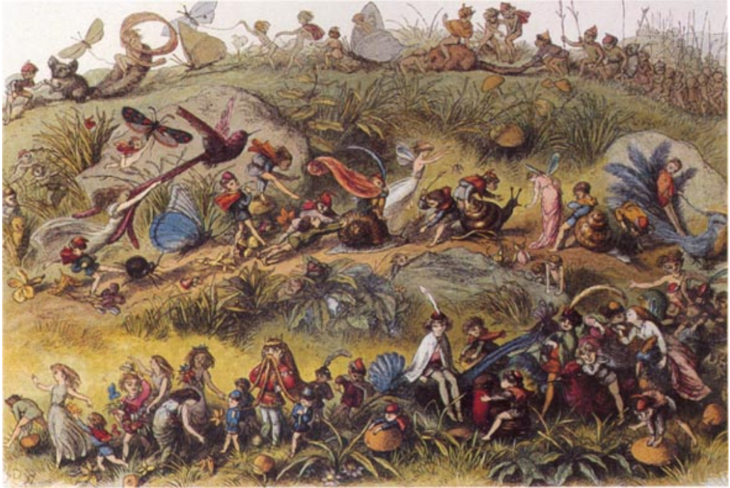
РИЧАРД ДОЙЛЬ. «НОЧНОЙ ТРИУМФАЛЬНЫЙ МАРШ КОРОЛЯ ЭЛЬФОВ»