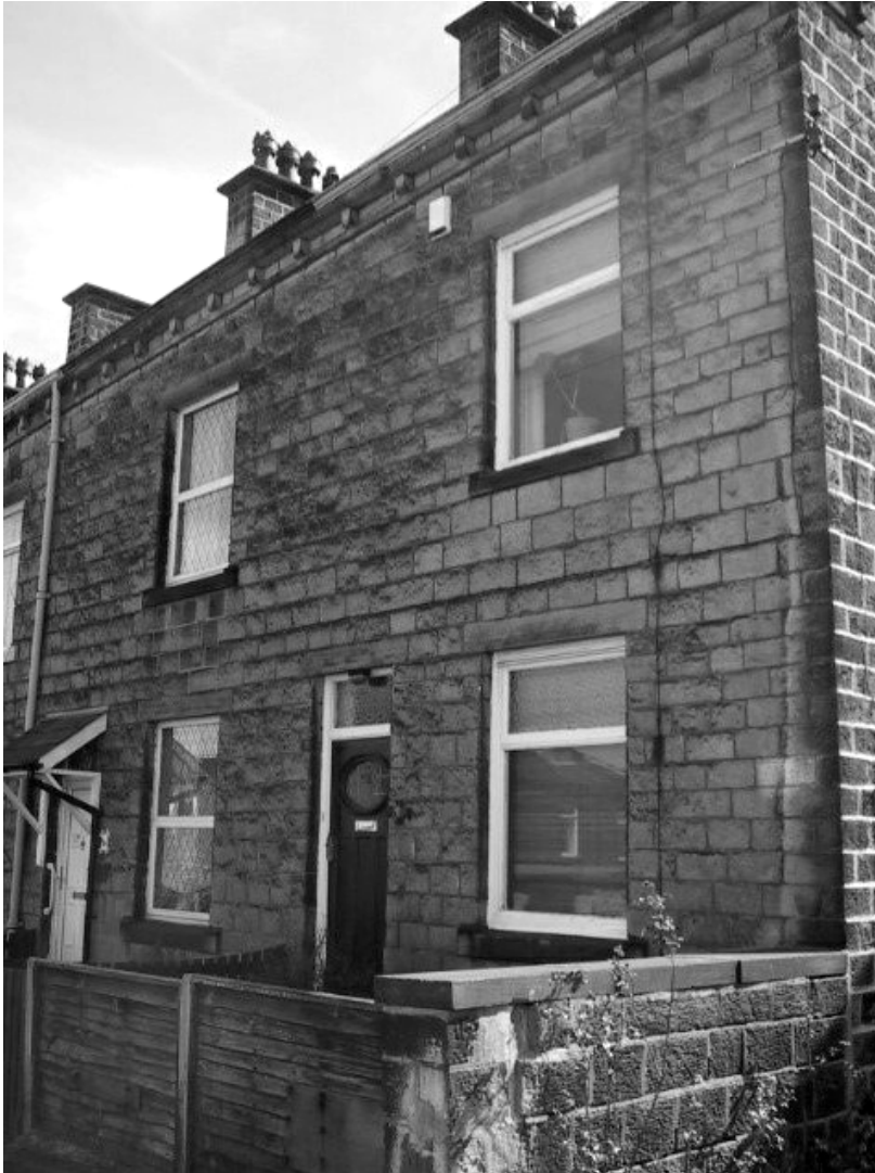
ДОМ СЕМЕЙСТВА РАЙТ В КОТТИНГЛИ