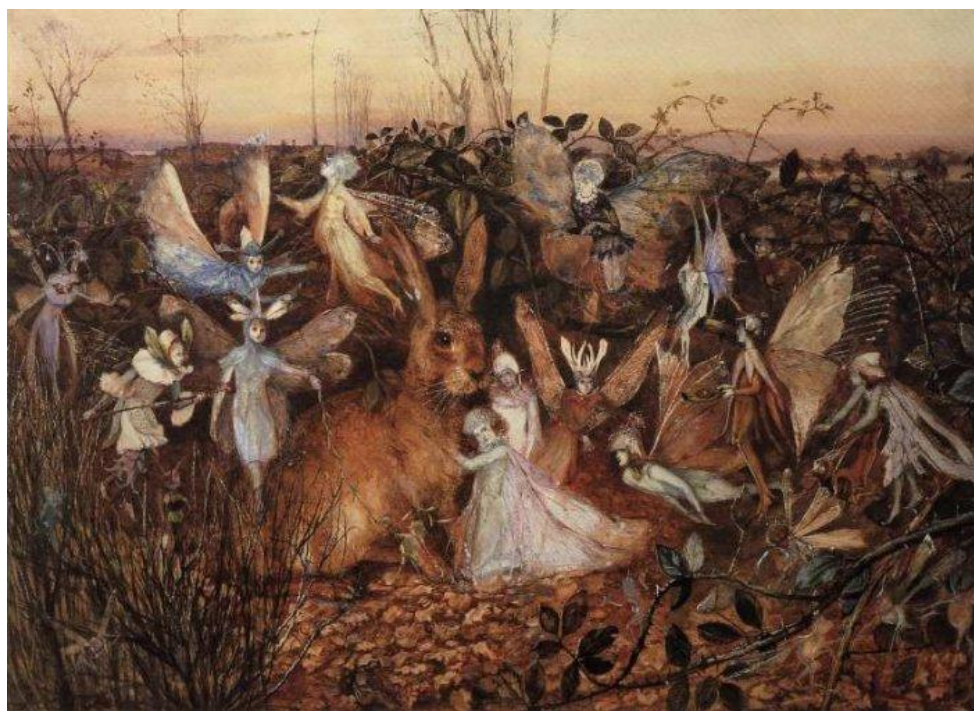
ДЖОН АНСТЕР ФИЦДЖЕРАЛЬД. «КРОЛИК СРЕДИ ФЕЙ»