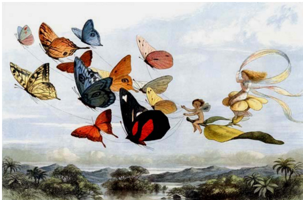
РИЧАРД ДОЙЛЬ. «КОЛЕСНИЦА БАБОЧЕК»