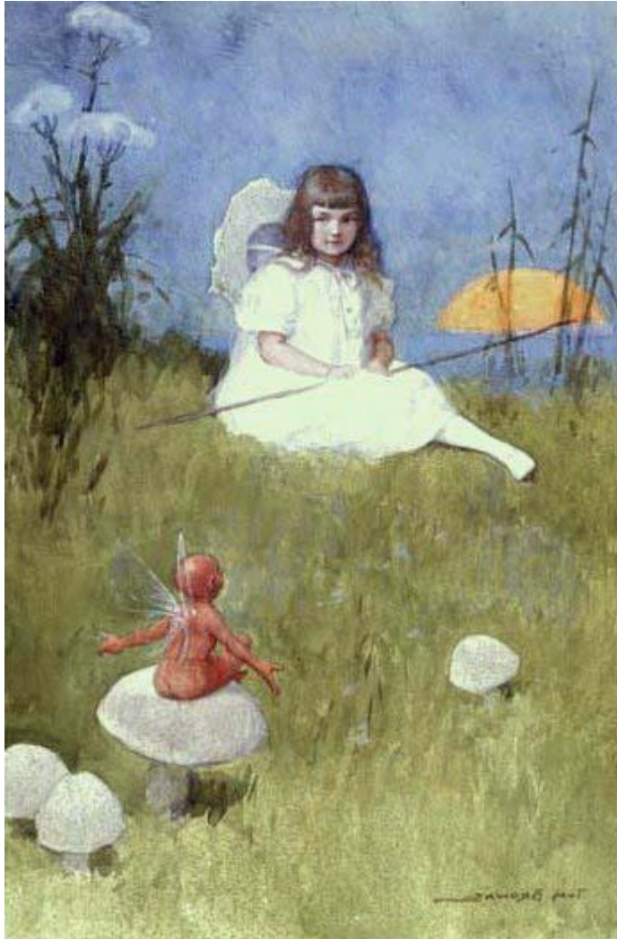
ТОМ БРАУН. «ФЕИ В НАШЕМ САДУ»