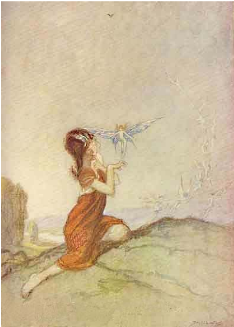
«ЗАГОВОР ФЕИ». РИС. К. ШЕППЕРТОНА