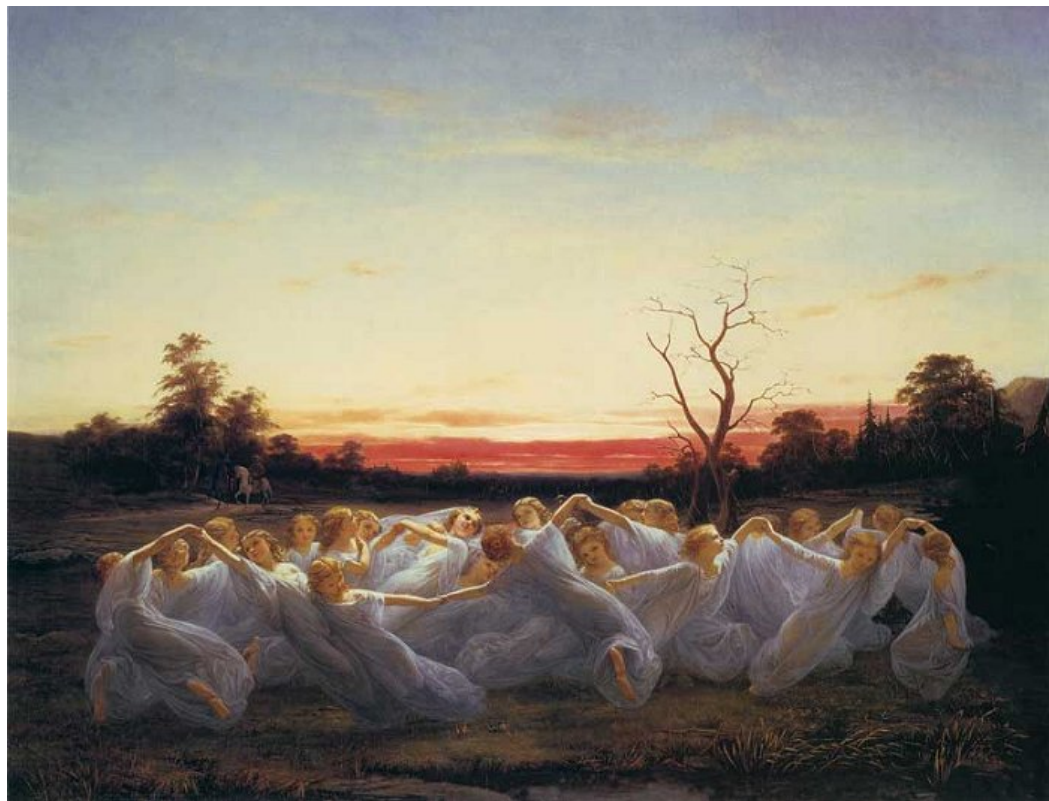
НИЛЬС БЛОММЕР. «ЛУГОВЫЕ ФЕИ»