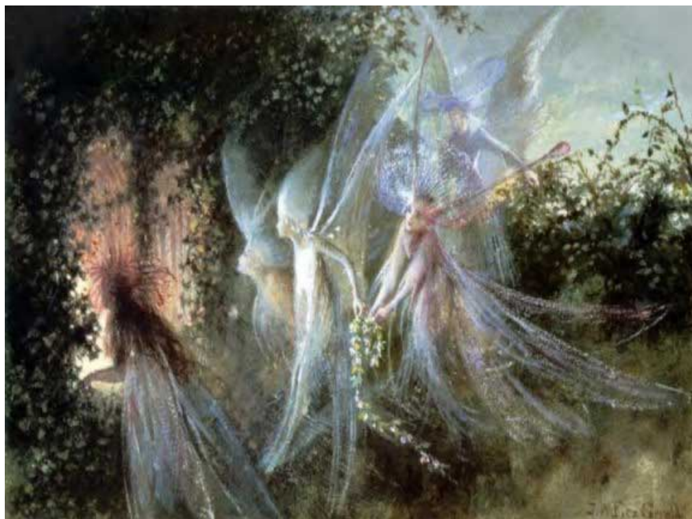
ДЖОН АНСТЕР ФИЦДЖЕРАЛЬД. «ФЕИ У ОКНА»