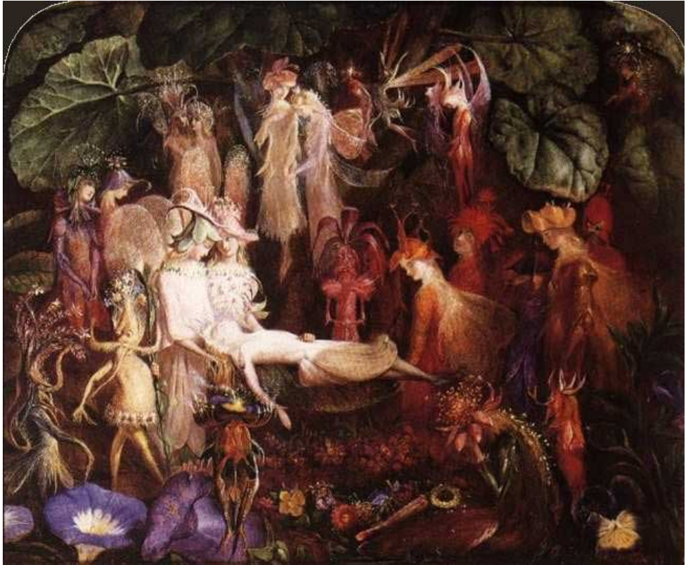
ДЖОН АНСТЕР ФИЦДЖЕРАЛЬД. «ПОХОРОНЫ ФЕИ»