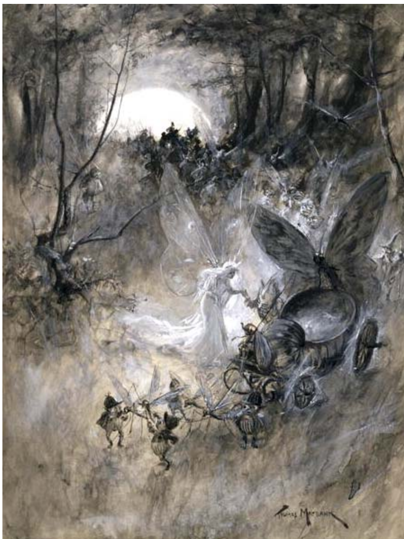
ТОМАС МЭЙБЕНК. «ДВОР ФЕЙ»