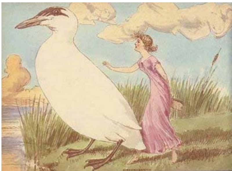
ЧАРЛЬЗ АЛТАМОНТ ДОЙЛЬ. «ЭЛЬФИЙСКИЕ ПТИЦЫ»