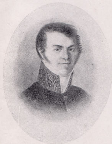
Михаил Андреевич Достоевский