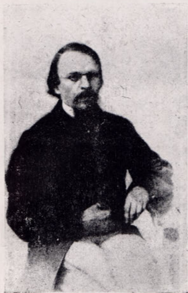
Михаил Михайлович Достоевский (начало 1860 годов)