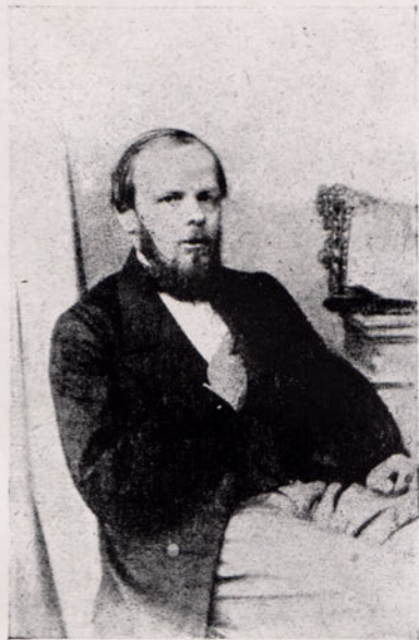
Федор Михайлович Достоевский (1860 г.)