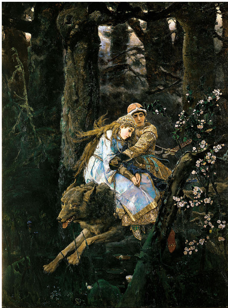
Виктор Васнецов. Иван-Царевич на Сером Волке. 1889