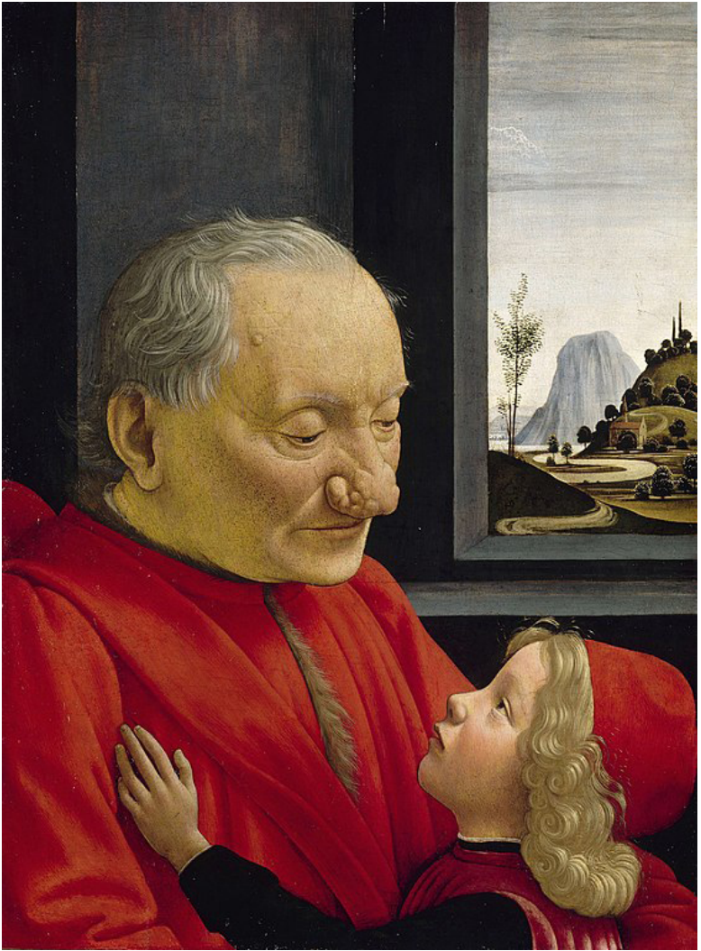
Доменико Гирландайо. Портрет старика с внуком. 1490