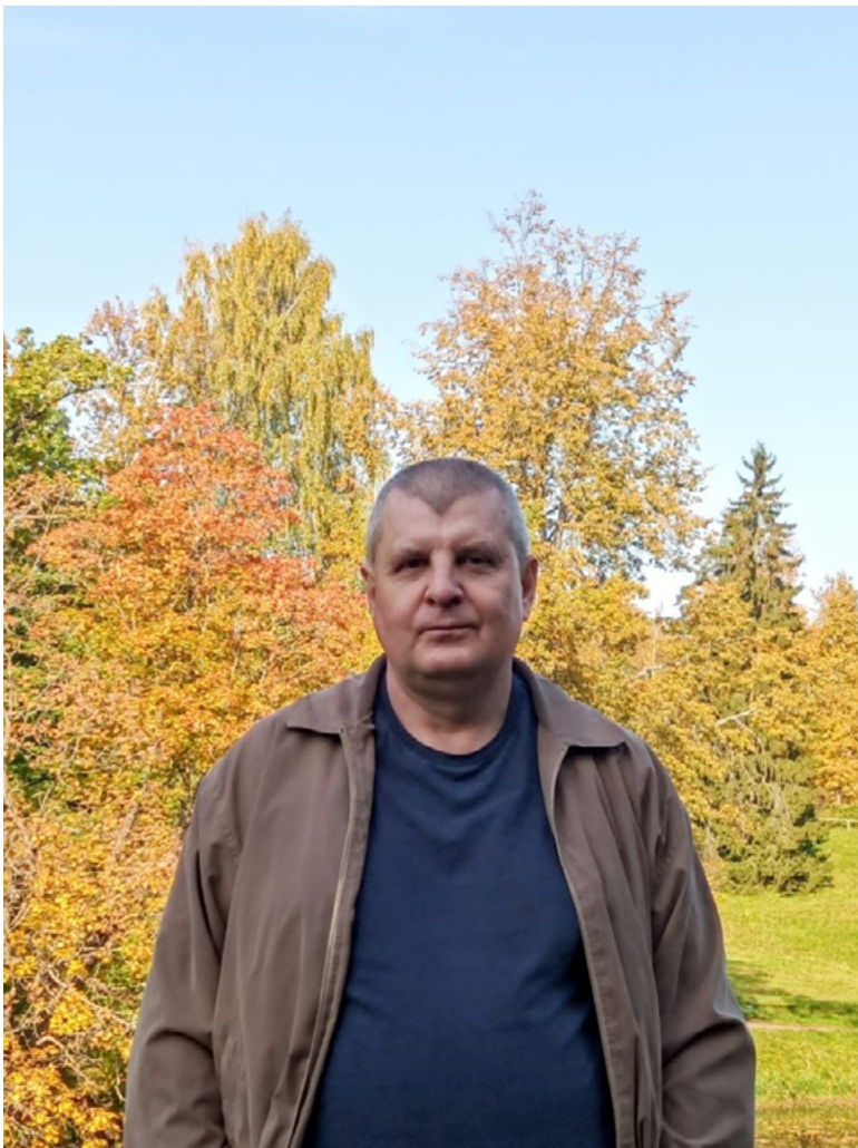
А это сам печальный дядя. 2021 год, в Павловском парке