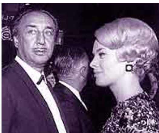
Ромен Гари и Джин Сиберг

Ромен Гари мечтал о настоящей семье, где есть дети. А феминистка Джин считала, что дети будут мешать ее свободе, ее карьере и борьбе. Но в 1969 году ей исполнился тридцать один год, и она чувствовала, что карьера ее близится к финалу. Незадолго до этого у них с Гари произошла длительная размолвка, счастливо завершившаяся примирением. Во время примирения, ставшего для них вторым медовым месяцем, Джин забеременела. И решила оставить ребенка. Природа взяла свое: феминистке захотелось стать матерью. Она даже пошла с «Черными пантерами», и со всем пылом, присущим ее натуре, принялась готовиться к появлению на свет ребенка: читала книги по передовым методикам воспитания, покупала чепчики и распашонки. Восемь месяцев ее беременности были счастливейшими в их с Гари семейной жизни. Возможно, для него это было даже важнее, чем для Джин: в 56 лет он впервые должен был стать отцом*.