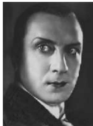
Иван Ильич Мозжухин (1889-1939)