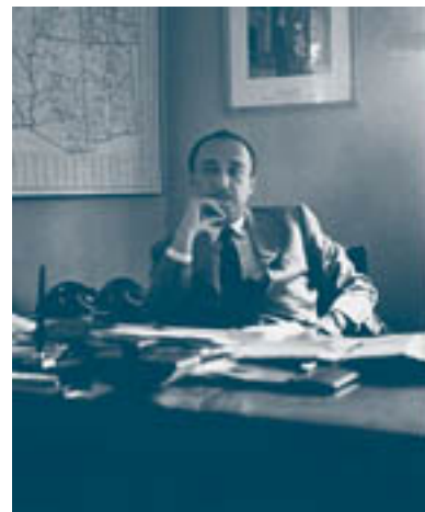
Ромен Гари на дипломатической работе

Но на самом деле он ждал и искал одну-единственную – свою женщину.