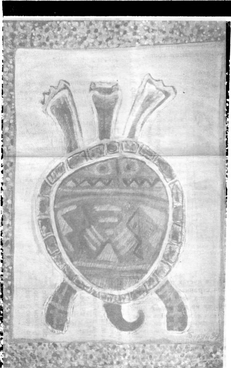
Олег Бурьян. “Черепашка”: х.м. воск. 60×80. 1989.

ХЭЙДЛЭНДСКИЙ ЦЕНТР ИСКУССТВ, 944 Форд Бэрри Сосэлито, Калифорния 94965