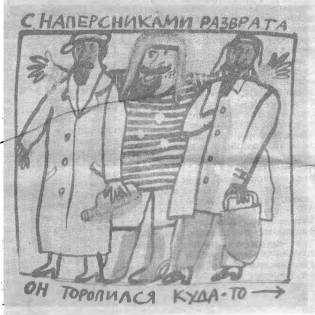
С наперсниками разврата Он торопился куда-то.

РАНА Я хвастаю раной на животе Перед группой Девичат. — Вот это да! — восхищаются те, И в рану палец вложить норовят. Вперед пробилась самая резвая. Малый рост, а сила недюжинная. — Смотрите, а рана-то колото-резанная! — Не колото-резанная, а рвано-уклушенная. Стою и внимаю с ужасом: В какую оргию втянут я, Ведьмы терзают меня и кружатся, Открылась рана полузагнанная. Надо бы рану перевязать И «Скорую помощь» вызвать. Кончили ведьмы меня терзать, Принялись кровь зализывать.