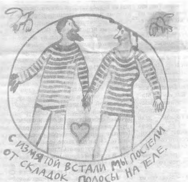
С измятой встали мы постели От складов полосы на теле.

Смерть прекрасна и так же легка Как вылет из куколки мотылька.