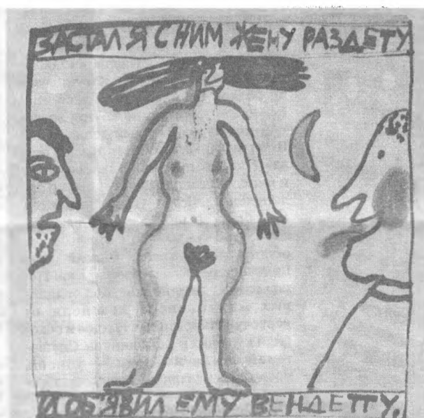
Застал я с ним жену раздету И объявил ему вендетту.

РОМ Иван лежал с открытым ртом В фуфайке на спине, И сверху вниз кубинский ром Лить приходилось мне. Вдруг замечаю — что за черт! Осталось мне так мало! Я лью и лью, а он уж мертв — Грамм восемьсот пропало.