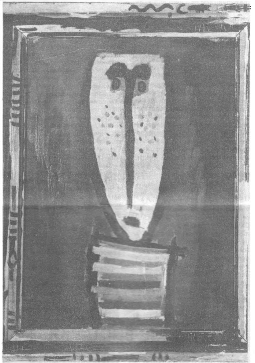
Портрет. х. м. воск. 60x80. 1989