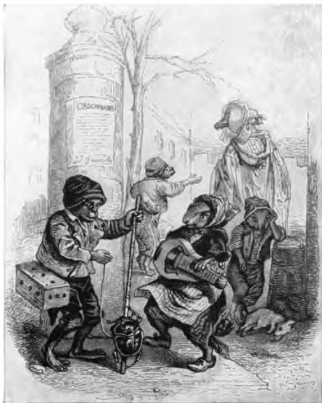
«Способ сравняться с Фанни Эльслер».