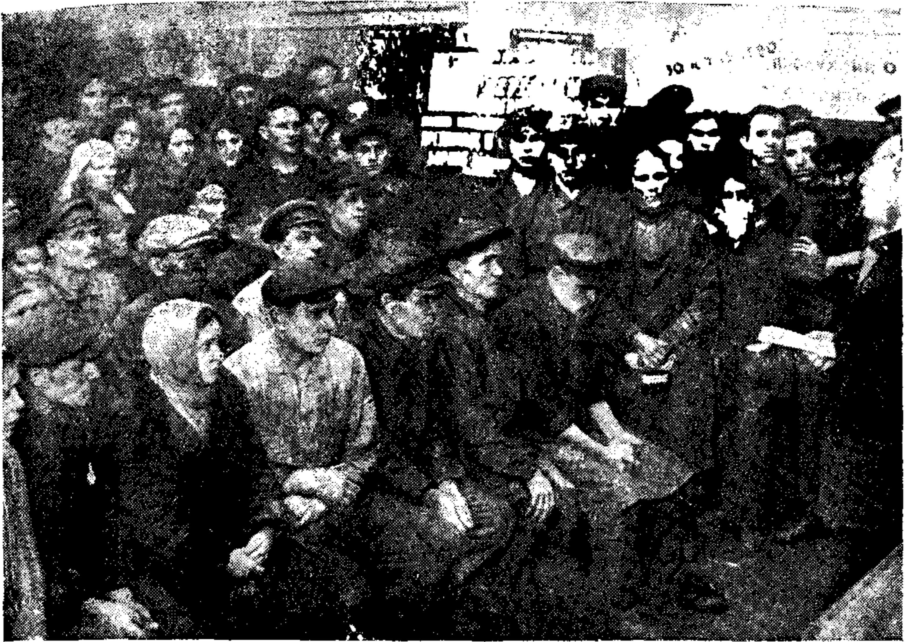
Траурный митинг на предприятии

слово. Вместе с вами вся многомиллионная страна скорбит об утрате погибшего от руки убийцы Сергея Мироновича Кирова. Тесней сплотим ряды. Будем охранять своих вождей, как знамя на поле битвы, удесятерим бдительность и охрану наших предприятий.