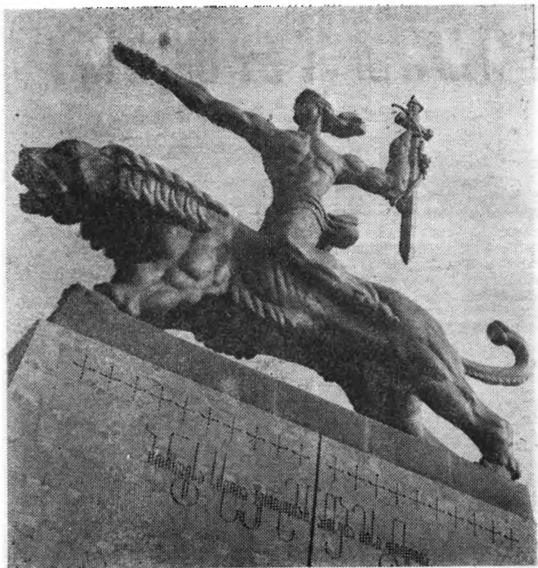
Монумент Победы в г. Гори (1979 год).

Основной компонент композиции — символ креста — меча — лозы: опущен вниз, и это незаметное движение подспудно вносит во всю скульптуру, в ее эмоциональную партитуру