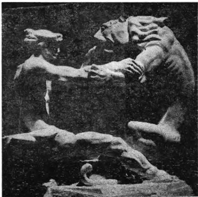
«Баллада о гигре и юноше».

Общую идею этой скульптуры можно выразить в двух словах — лев и человек, а еще лучше в одном — богатырь. Вера и добро воплощены в физической форме льва, однако это не только телесная, материальная форма. Эгуджа Амашукели воплощает в фигуре льва дух непобедимости, веры, несокру-