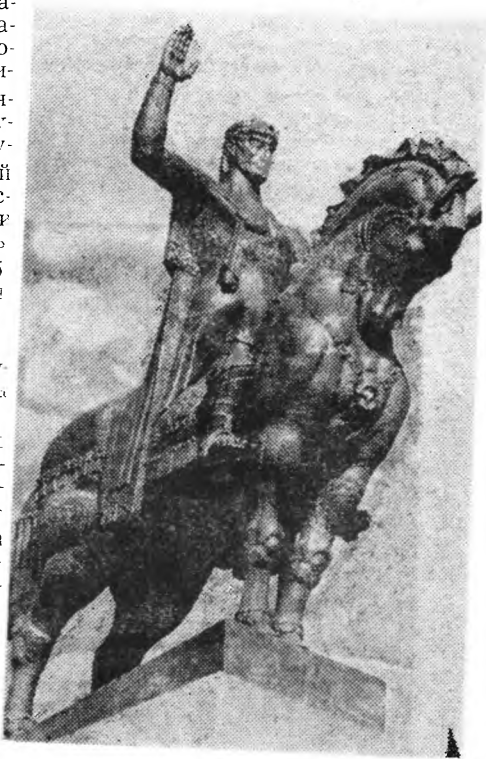
Ваханг Горгасали (1967 год).

Всю структуру произведения создает авторская концепция, вызывающая из реалий мира соответствующие бытий-