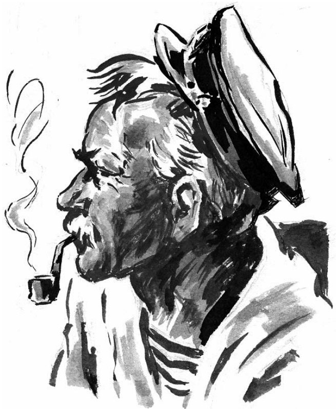
Морской волк. Балтика.