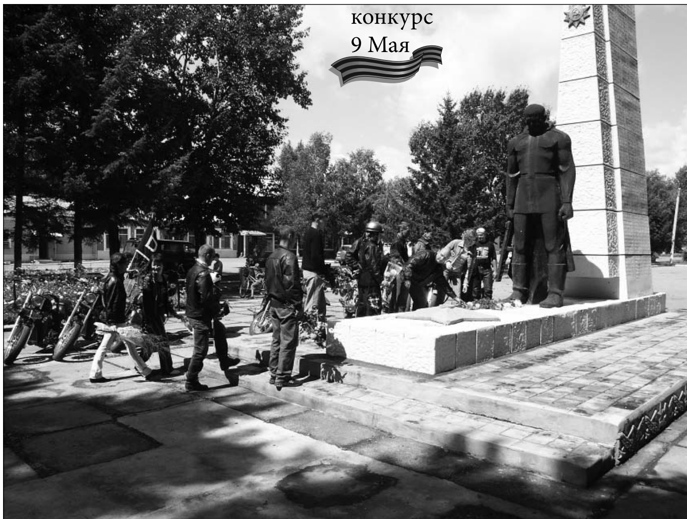
Возложение арсеньевскими байкерами цветов к мемориалу, посвященному погибшим в годы Великой Отечественной войны приморцам. с. Анучино, 2005 год.