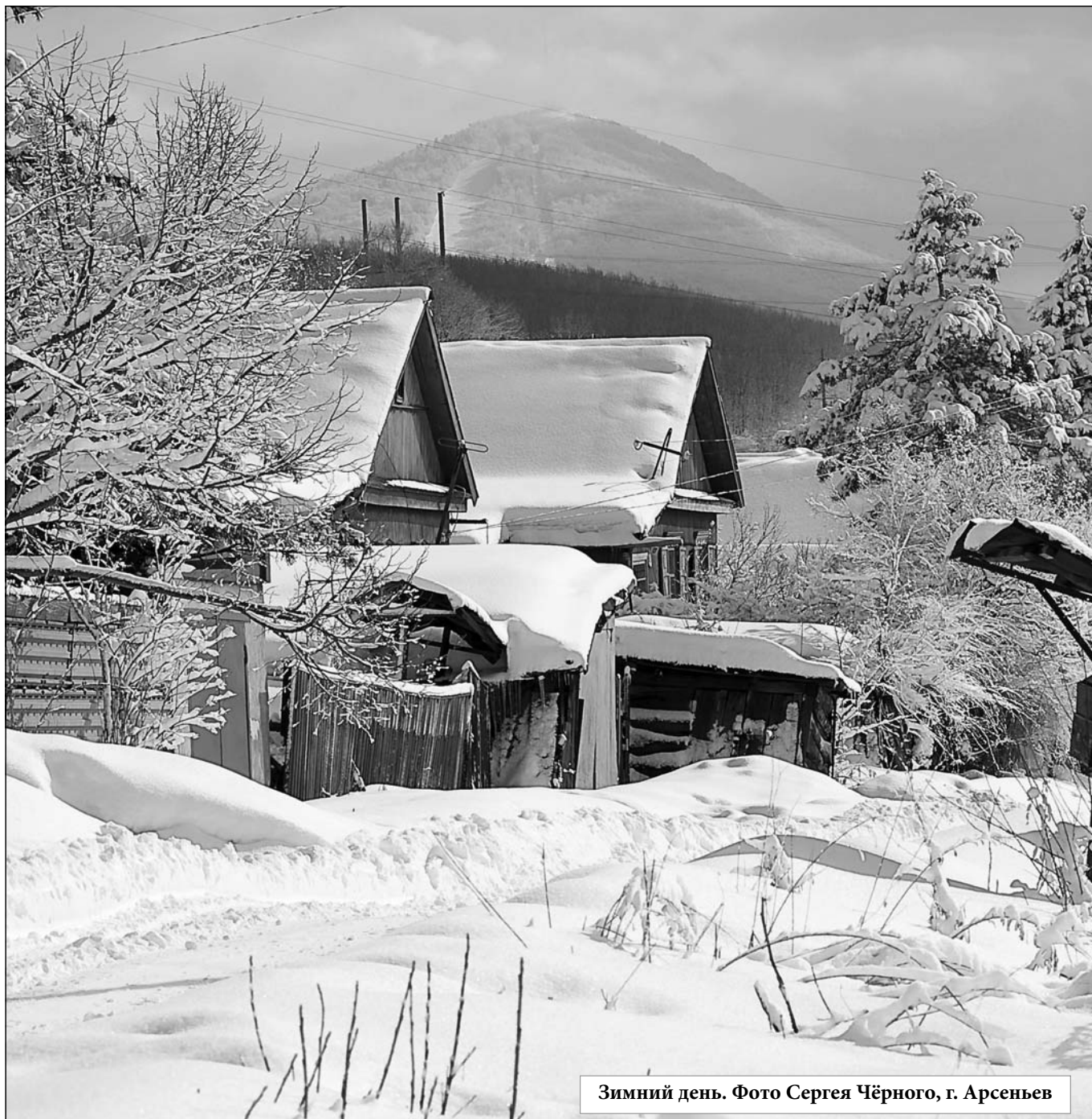
Зимний день. Фото Сергея Чёрного, г. Арсеньев

ЕЖЕМЕСЯЧНИК ИЗДАЕТСЯ ПРИ ПОДДЕРЖКЕ ИЗДАТЕЛЬСКОГО ЦЕНТРА «МИЛИЦЕЙСКИЙ ВЕСТНИК», г. АРСЕНЬЕВ ПРИМОРСКОГО КРАЯ