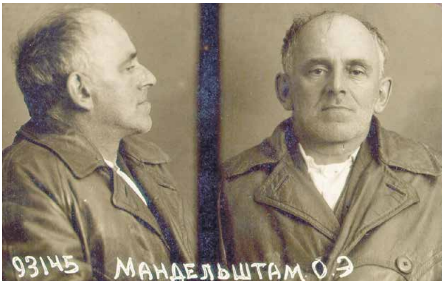
Второй арест — май 1938-го

Газетный вариант. Полностью текст будет опубликован на сайте «Новые медиа».