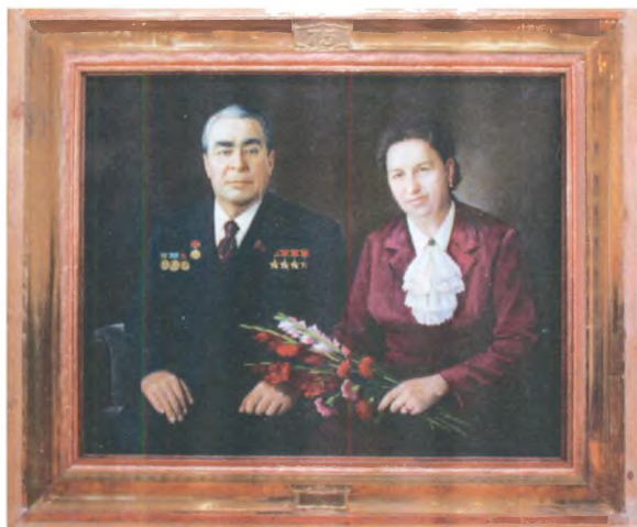
М. М. Степаньянц. Портрет Леонида Ильича Брежнева с супругой. 1981 г. Выставка «Первые леди России XX века». 2007–2008 гг. Государственный центральный музей современной истории России.