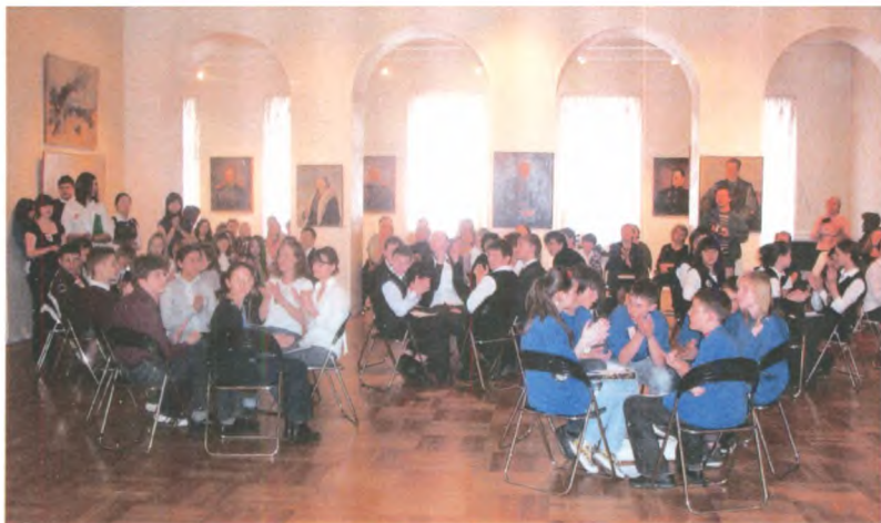
Обсуждение заданий первого этапа Московского городского конкурса «Символы и награды России». Май 2009 г. Государственный центральный музей современной истории России.