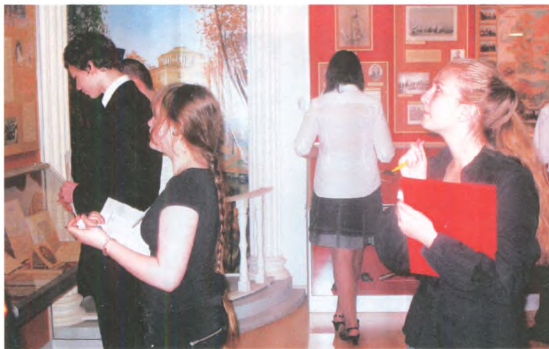
Музейный тур Московского городского конкурса «Символы и награды России». Работа команд на экспозиции ГЦМСИР. Май 2009 г. Государственный центральный музей современной истории России.