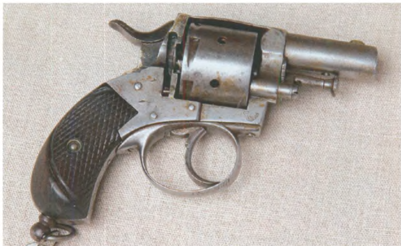
Револьвер модели «Кобольд». Бельгия, начало XX в. Государственный центральный музей современной истории России.