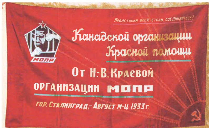
Знамя дарственное от Нижневолжской краевой организации МОПР СССР Канадской организации Красной помощи. г. Сталинград, 1933 г. Государственный центральный музей современной истории России.