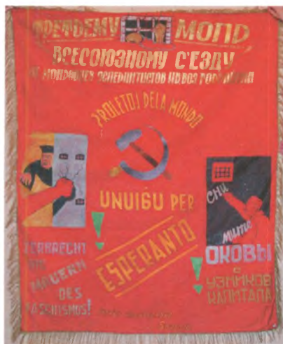
Знамя дарственное 3-му Всесоюзному съезду МОПР от мопровцев-эсперантистов г. Иваново-Вознесенска. 1931 г. Государственный центральный музей современной истории России.