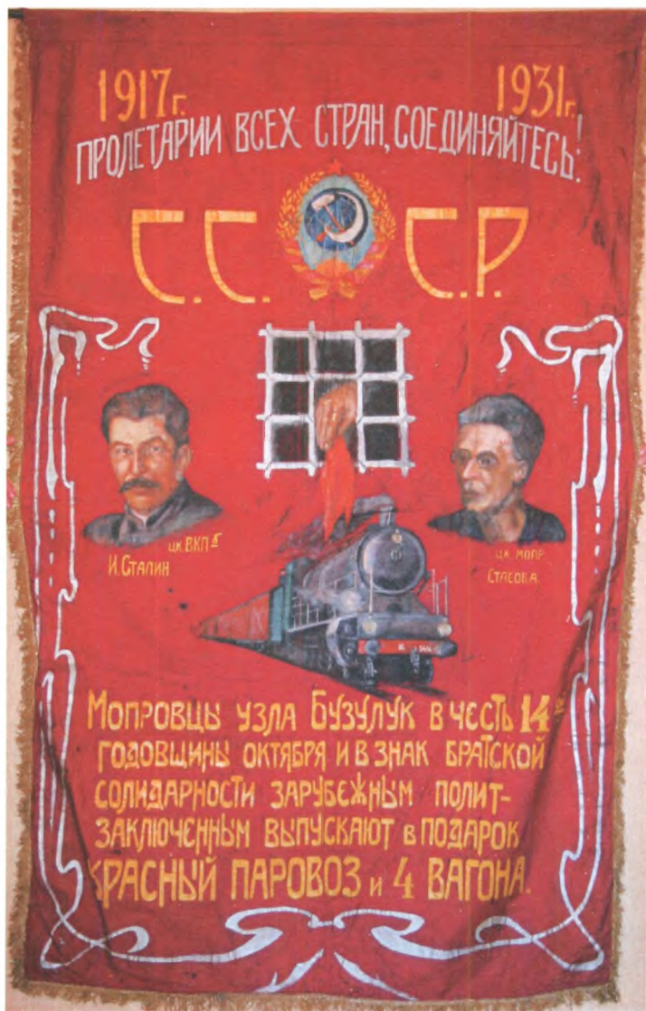
Знамя дарственное 3-му Всесоюзному съезду МОПР от мопровцев станции Бузулук. 1931 г.

Государственный центральный музей современной истории России.