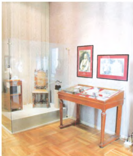
Раздел выставки «Первые леди России XX века», посвященный Н. К. Крупской. 2007–2008 гг. Государственный центральный музей современной истории России.