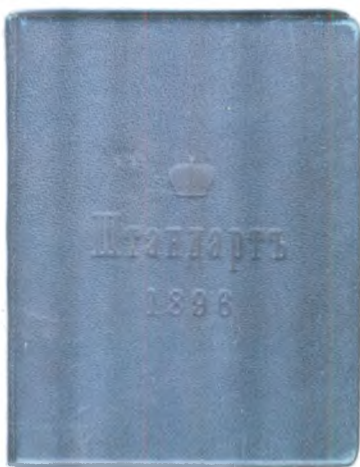
Обложка гостевой книги императорской яхты «Штандарт». 1896–1914 гг. Государственный центральный музей современной истории России.