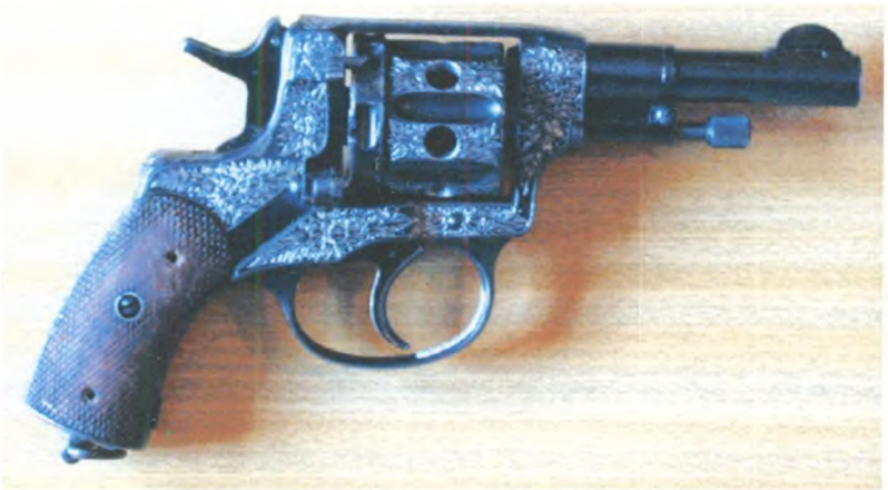
Револьвер системы Наган укороченный. СССР, г. Тула, 1927 г. Принадлежал С.М. Кирову. Государственный центральный музей современной истории России.