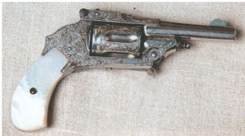
Револьвер модели «Велодог». Бельгия, Льеж, фирма Лепаж, начало XX в. Государственный центральный музей современной истории России.