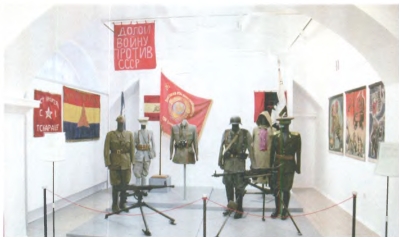
Выставка «И вспыхнул мировой пожар...». 2009 г. Государственный центральный музей современной истории России.