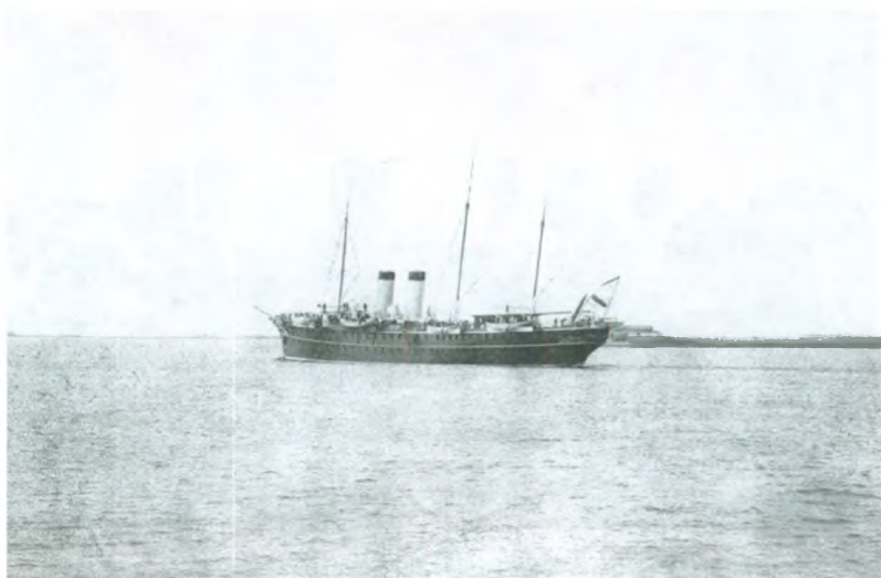
Императорская яхта «Штандарт» в Балтийском море. 1890-е гг. Фотография на паспорту. Государственный центральный музей современной истории России.