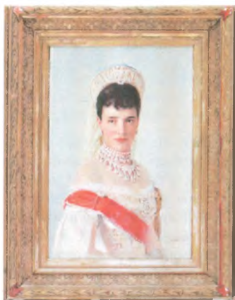
В.Е. Маковский (1846 – 1920). Портрет императрицы Марии Федоровны. 1900 г. Частное собрание. Выставка «Императрица Мария Федоровна. Возвращение...». 2006 г. Государственный центральный музей современной истории России.