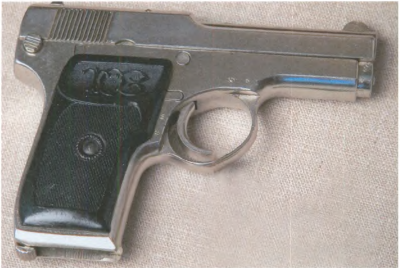
Пистолет самозарядный системы С.А. Коровина образца 1926 г. СССР, г. Тула. Государственный центральный музей современной истории России.