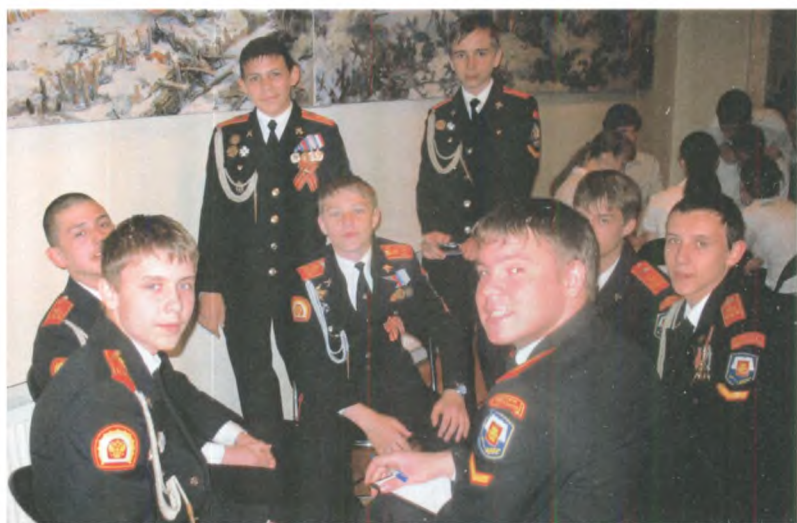
Одна из команд перед началом первого этапа Московского городского конкурса «Символы и награды России». Май 2009 г. Государственный центральный музей современной истории России.