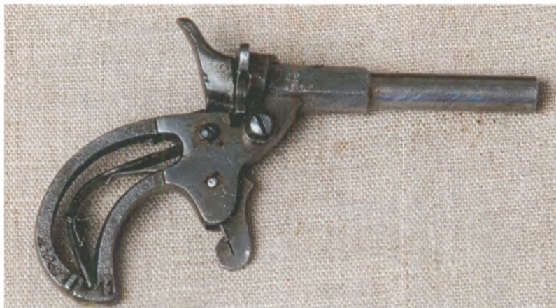
Пистолет малокалиберный типа «Флобер». Германия, конец XIX – начало XX вв. Государственный центральный музей современной истории России.