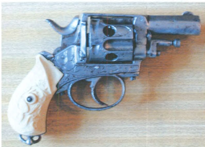
Револьвер модели «Булдого». Бельгия, начало XX в. Государственный центральный музей современной истории России.