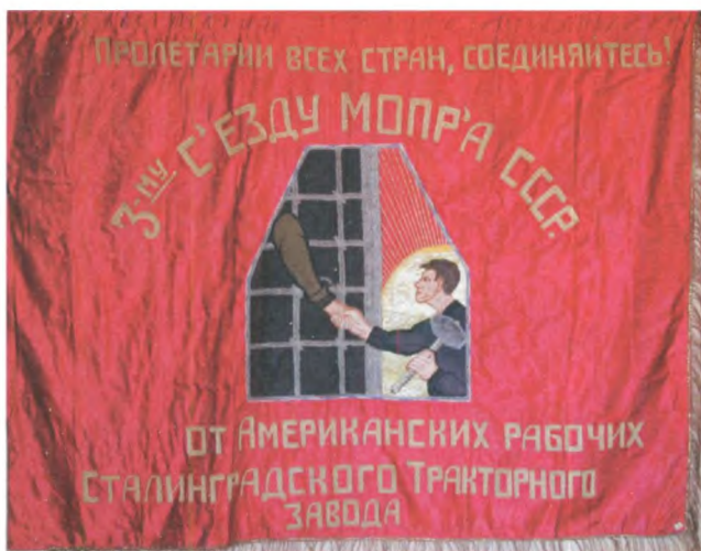
Знамя дарственное 3-му Всесоюзному съезду МОПР от американских рабочих Сталинградского тракторного завода. 1931 г. Государственный центральный музей современной истории России.