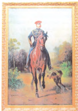
Н.Е.Сверчков (1817-1898). Портрет императора Александра II. Музей-усадьба Останкино. Выставка «Дед и внук. Жизнь за Россию». 2008 г. Государственный центральный музей современной истории России.