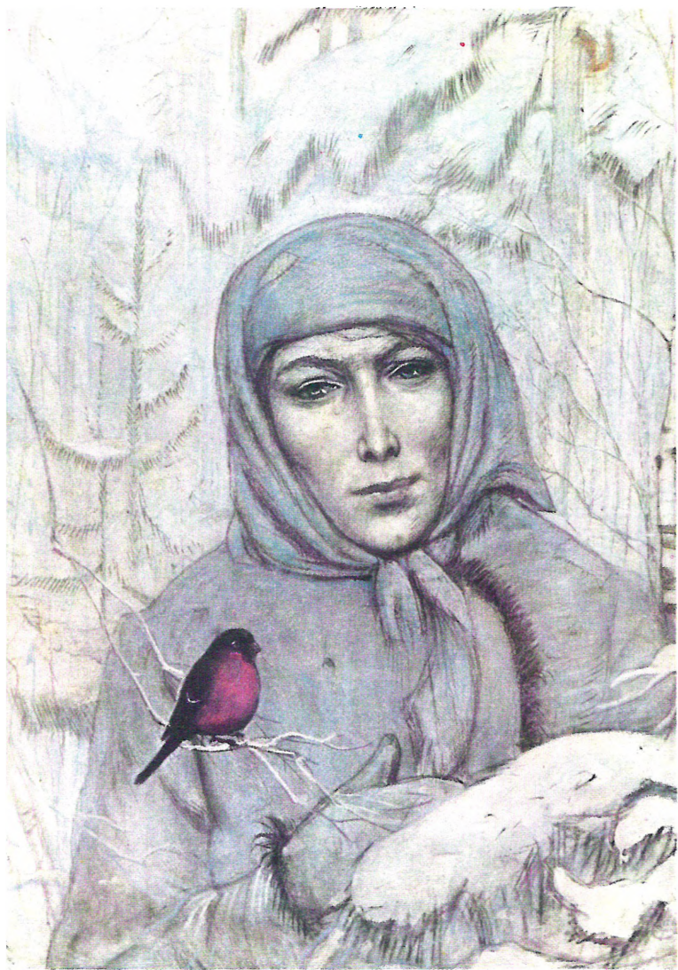
«МОРОЗ, КРАСНЫЙ НОС»