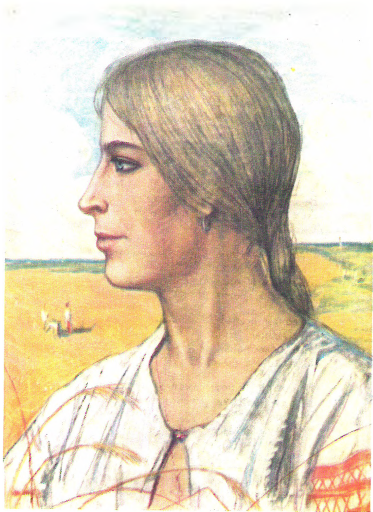
«МОРОЗ, КРАСНЫЙ НОС»