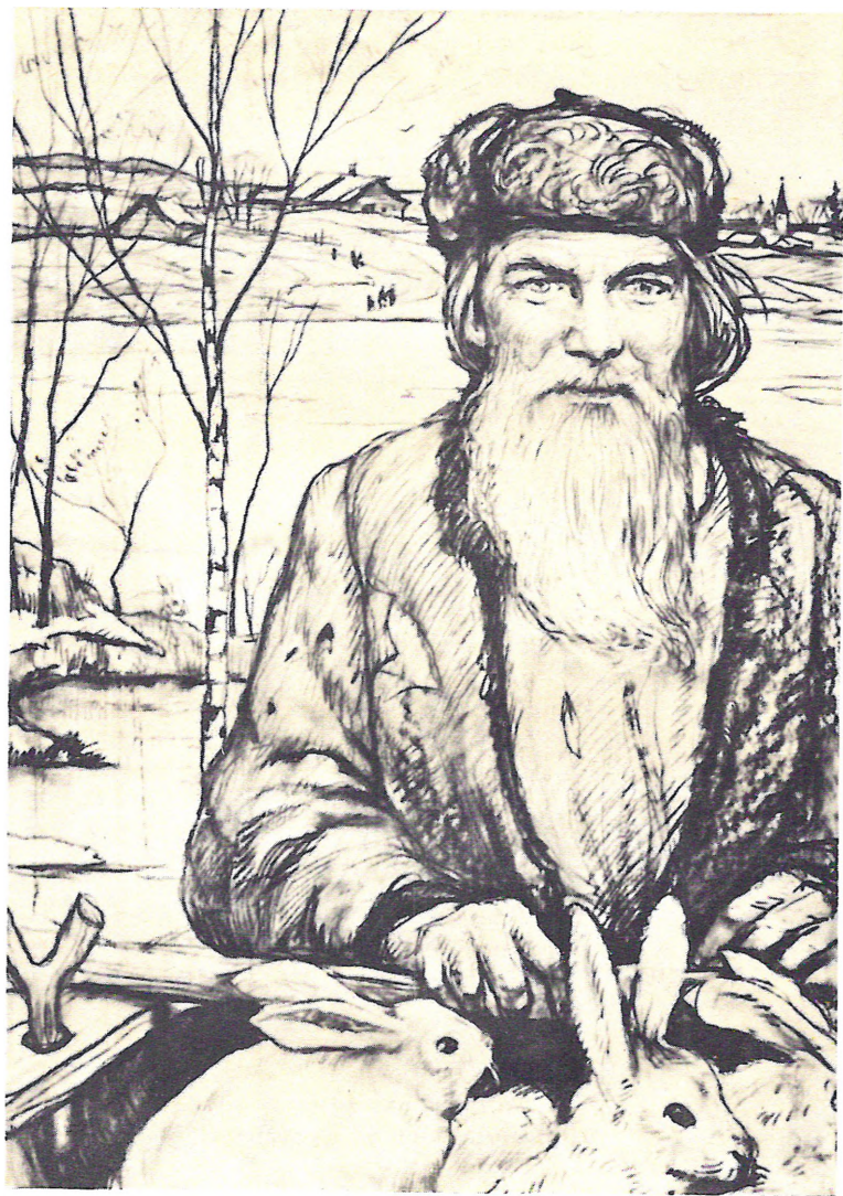
«ДЕДУШКА МАЗАЙ И ЗАЙЦЫ»