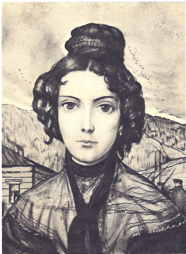
«РУССКИЕ ЖЕНЩИНЫ» («Княгиня М. Н. Волконская»)