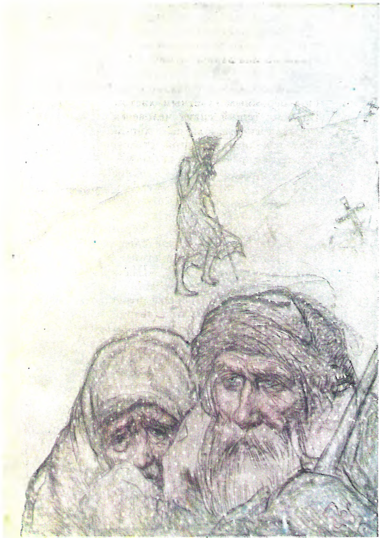
«МОРОЗ, КРАСНЫЙ НОС»