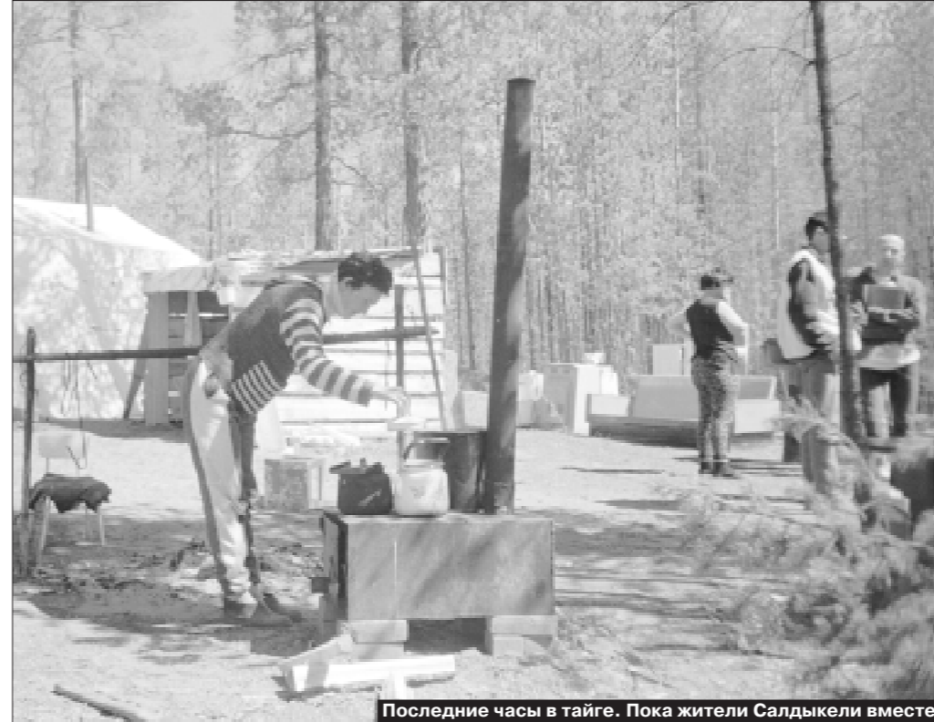
Последние часы в тайге. Пока жители Салдыкеля вместе