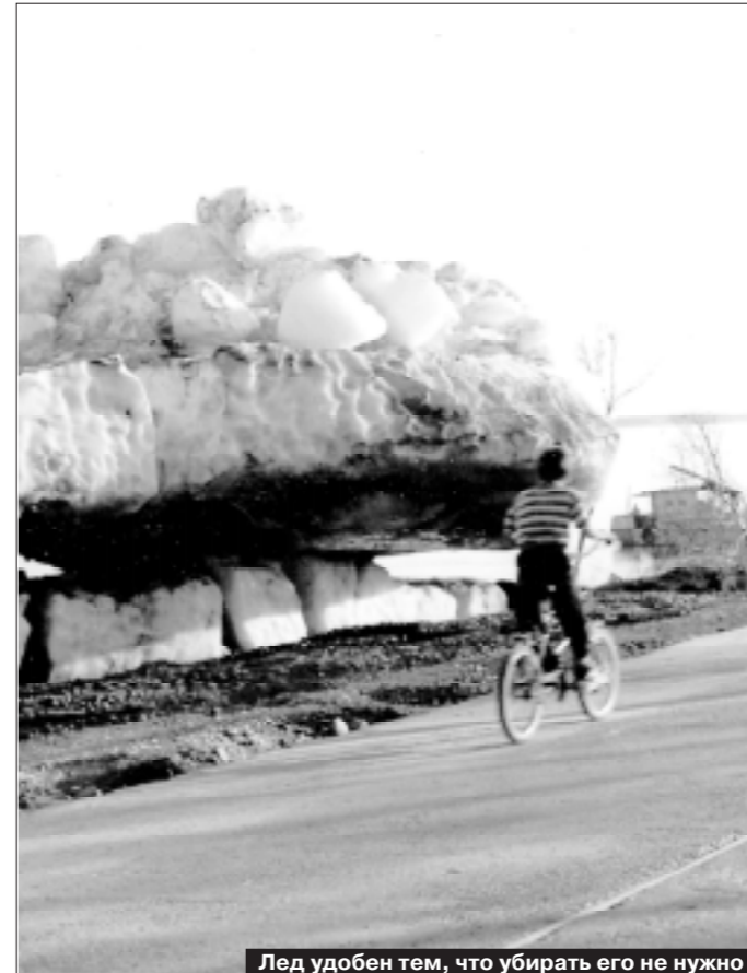
Лед удобен тем, что убирать его не нужно

Лаки-банк представляет собой такое же жалкое зрелище, как и любое здание Ленска, затопленное выше крыши. Стены, полы, потолки в потеках, разобраные для просушки компьютеры, неработающие факсы, безобразно врытые теперь счетные машинки для денег. Самое главное в банке — деньги. Совсем