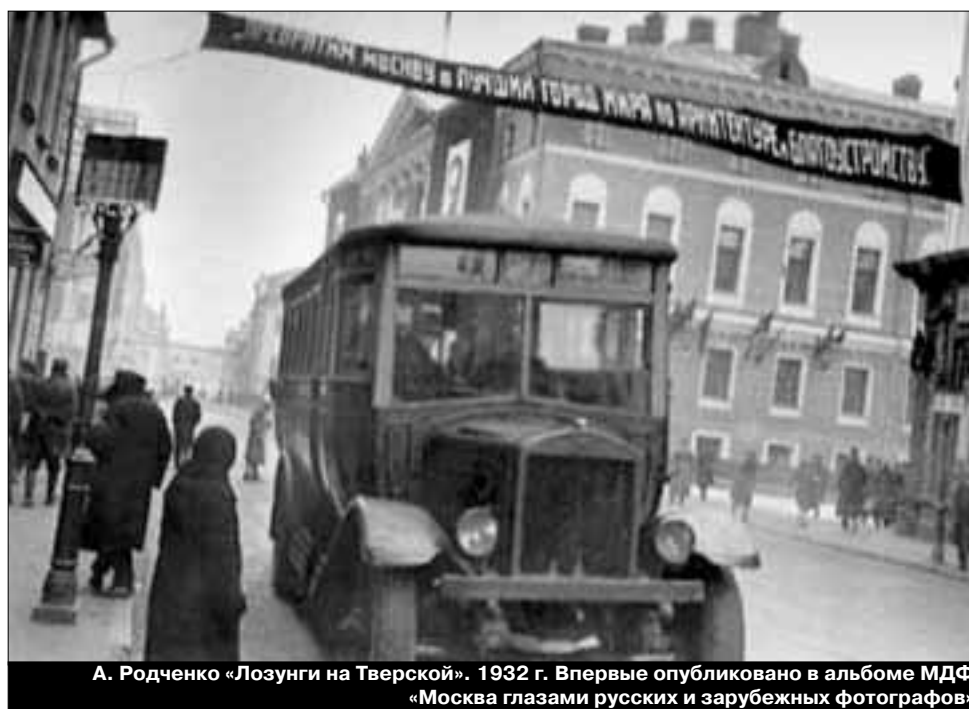
А. Родченко «Лозунги на Тверской». 1932 г. Впервые опубликовано в альбоме МДФ «Москва глазами русских и зарубежных фотографов»

телей. Мы стараемся держать уровень. Это наша задача.