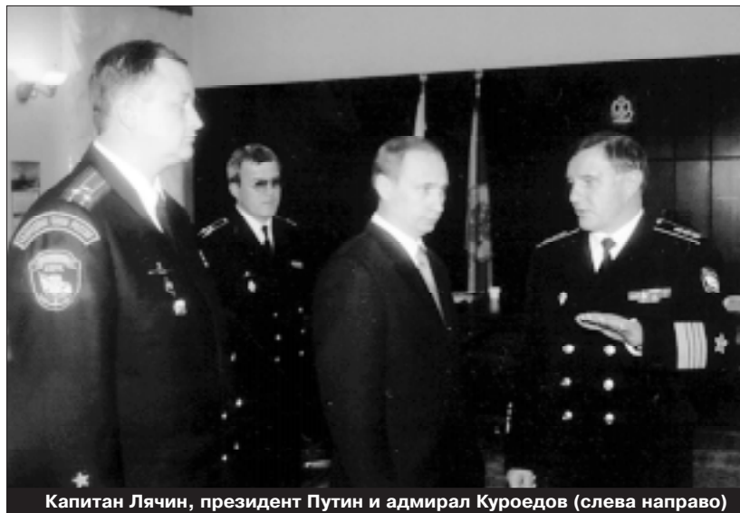
Капитан Лячин, президент Путин и адмирал Куроедов (слева направо)

Главком ВМФ Куроедов ответил на самые жесткие вопросы нашего специального корреспондента