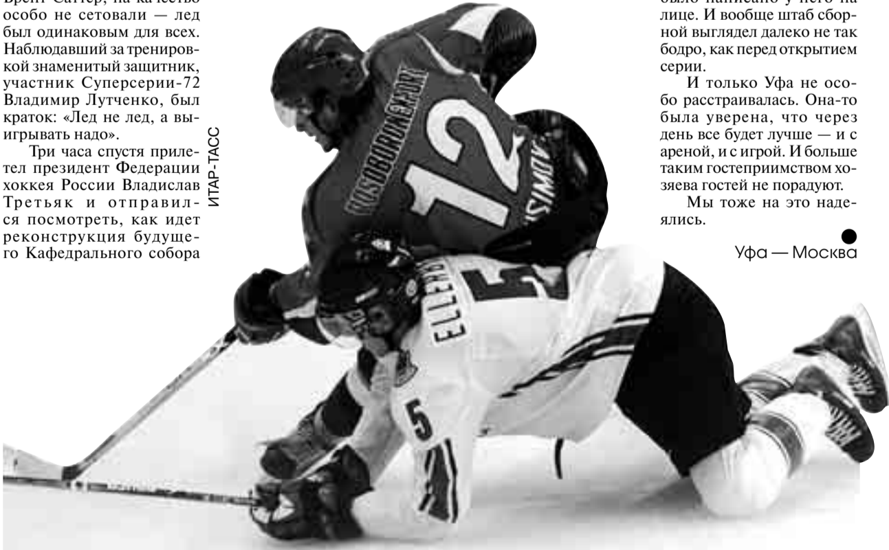
А как славно все начиналось...