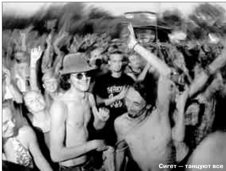
Сигет — танцуют все

● Алла ГЕРАСКИНА, наш спец. корр. Будапешт — Москва