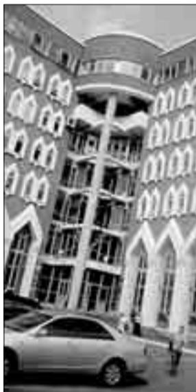
Офис ПФР в Омске

У других моих знакомых, которые извлекли по моей просьбе письма счастья из долгих ящиков, суммы вышли при подсчете более ощутимые — от 5,5 руб. (распространитель газет) до 57,2 (инженер автосервиса). А к чему они будут прибавляться? Вопрос непростой. Ни один респондент не смог на него ответить. Письма счастья для подавляющего большинства населения, даже с высшим техническим