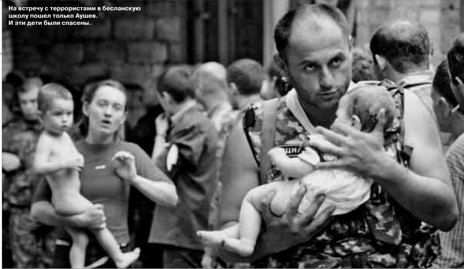
На встречу с террористами в бесланскую школу пошел только Аушев. И эти дети были спасены.

— Как вы можете оценить профессиональные действия официального пере-