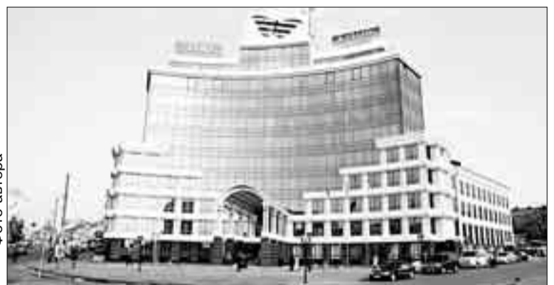
Дворец Казанского Пенсионного фонда знатоки сравнивают со штаб-квартирой ООН в Нью-Йорке

Разумеется, бухгалтерия редакции завершила меня, что перечислила