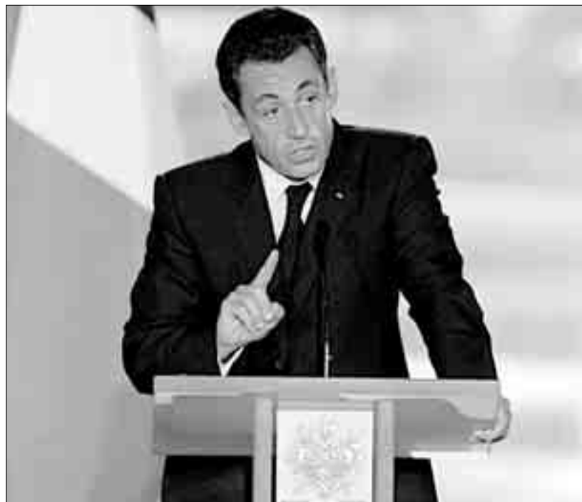
У президента Саркози гораздо меньше причин для «личной дружбы» с Россией, чем у его предшественников