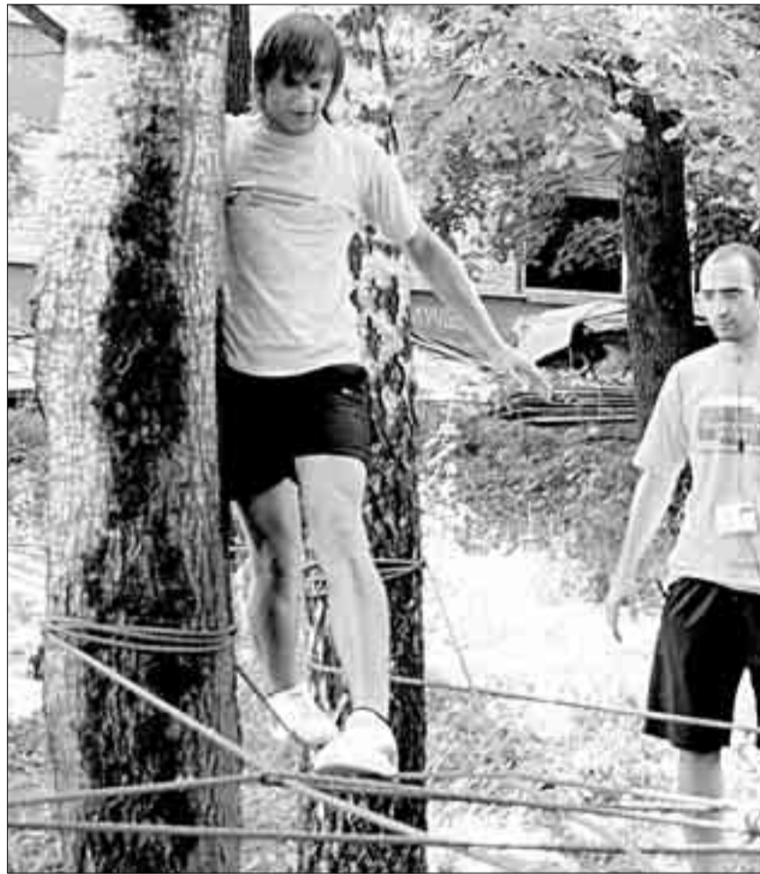
Молодых политиков учили балансировать в естественных условиях

Молодые «справедливые» не обиделись на Путина, хотя и говорили об «утраченном счастье»