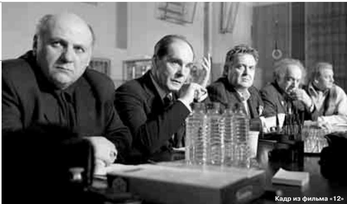
Кадр из фильма «12»