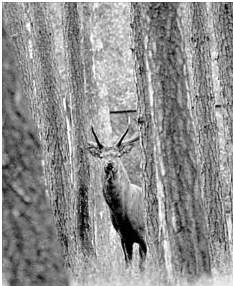
Эти заповедные леса могут оказаться на дне мертвого моря

Это наши неразумные предки обожествляли природу. Мы же добились того,