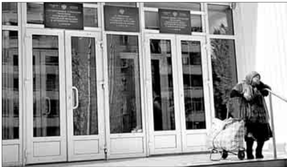
Подъезд Саратовского ПФР. Вот тебе, бабушка, денежки на старость от государства

Разбираться в «счастливых письмах» можно только по глубокой служебной надобности. Для начала гражданину надлежит сверить номер лицевого счета с цифрами на зеленой карточке страхового свидетельства. В первой таблице письма указано, сколько денег перечислил за меня работодатель в 2006 году и всего с 2002-го (начала реформы). Здесь же — мой доход от временного вложения взносов в государственные ценные бумаги (ПФ сам распорядился деньгами, которые поступали в течение года, пока будущий пенсионер не успел высказать собственные пожелания). Придется вспомнить математику — эффективность работы управляющей компании