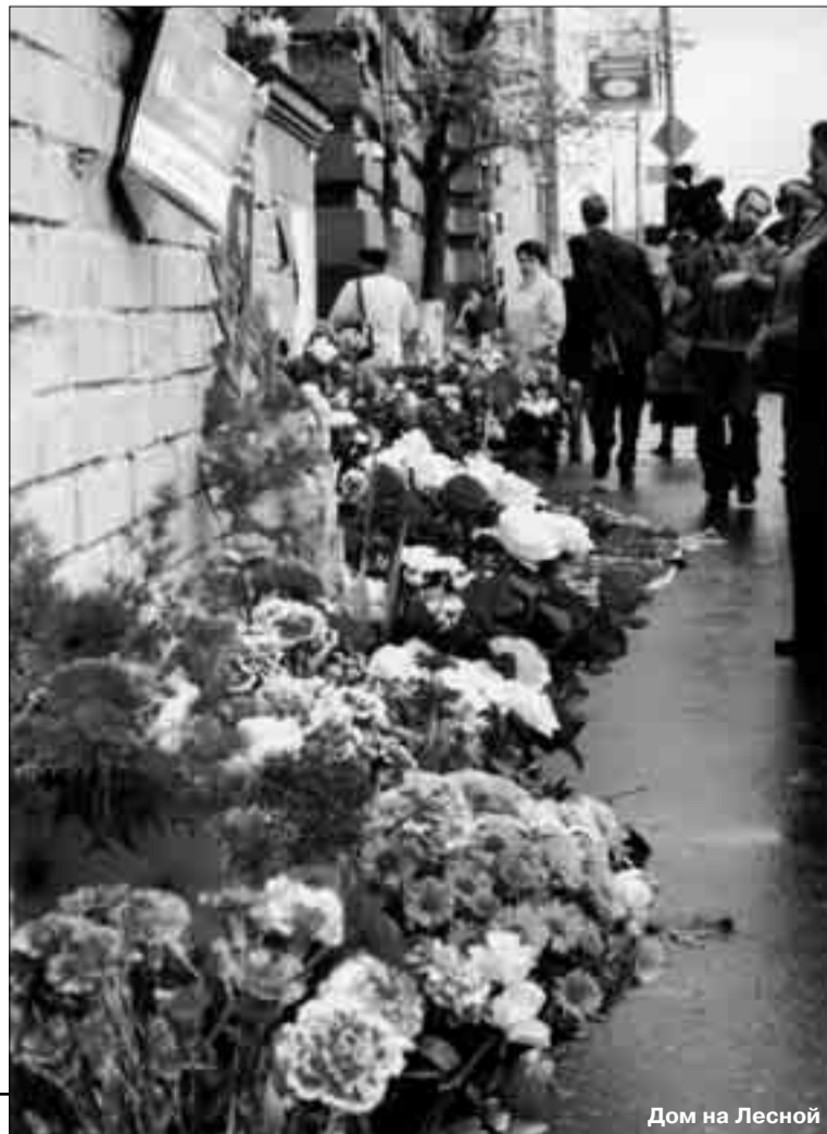
Дом на Лесной

Вокруг следствия и журналистов «Новой» все это время крутилось достаточное количество странных людей: мутный суповой набор из профессиональных про-