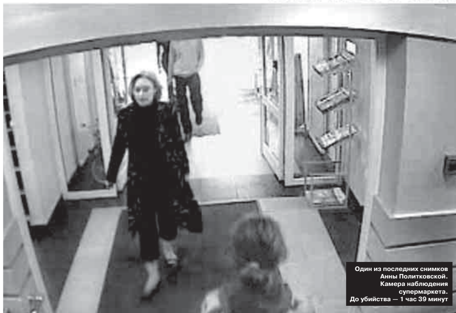
Один из последних снимков Анны Политковской. Камера наблюдения супермаркета. До убийства — 1 час 39 минут

Арестованы десять человек, подозреваемых в причастности к убийству Анны Политковской. В связи с чем было сделано официальное заявление: преступление раскрыто.