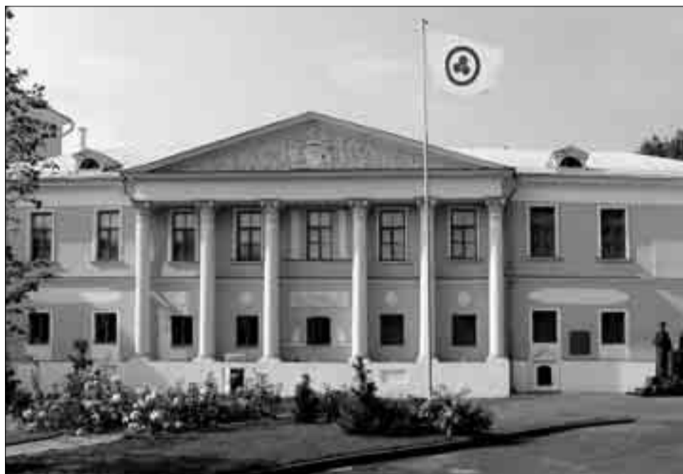
Усадьба Лопухиных. Сейчас здесь на законных основаниях располагается Международный Центр Рерихов