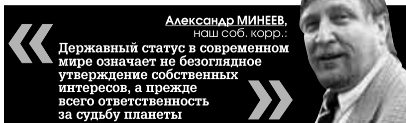
Александр МИНЕЕВ, наш соб. корр.:

Саркози объясняет Кремлю, что такое современный мир