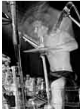
Шнуров и Барецкий заигнали в Венгрии не по-детски