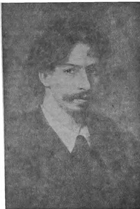
И. Е. Репин. Автопортрет. 1878 г.

чения и сырье, подлежащее обязательной переработке и дистиляции. Академия пользовалась своей монополией художественного образования и узаконяла зависимость художника от заказчика. От этой материальной зависимости Крамской прежде всего стремился избавить художника. Основная им артель художников была не только объединением единомышленников, но и экономическим предприятием. Идейную проповедь Чернышевского Крамской сумел связать с проблемами нового устройства быта художников. Артель добывала и распределяла заказы, и члены ее, будучи более или менее обеспеченными, могли свободно заниматься живописью. Скоро артель переросла в Товарищество