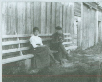
Родители незадолго до свадьбы. Кунцево, 1912 г.