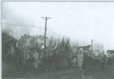
Школа на Первомайской демонстрации. Западная Двина. 1955 г.