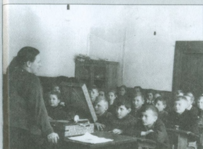
Музыкальный урок. 1957 г.