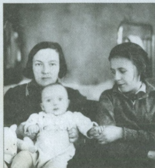
После ареста родителей и брата. С женой брата и их ребенком. Москва, март 1938 г.