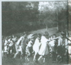
В летнем лагере. Детдомовцы везут бочку (лошадь забрали на нужды армии).