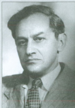
Альберт Захарович Манфред