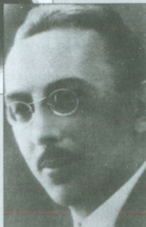
Валериан Валерианович Осинский (Оболенский)