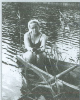
На Фофановом озере