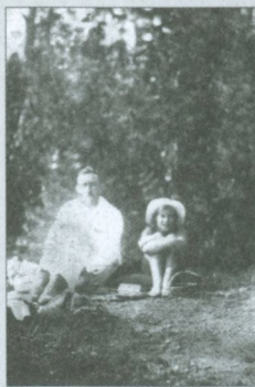
Последняя фотография с отцом. Валдай, лето 1937 г.