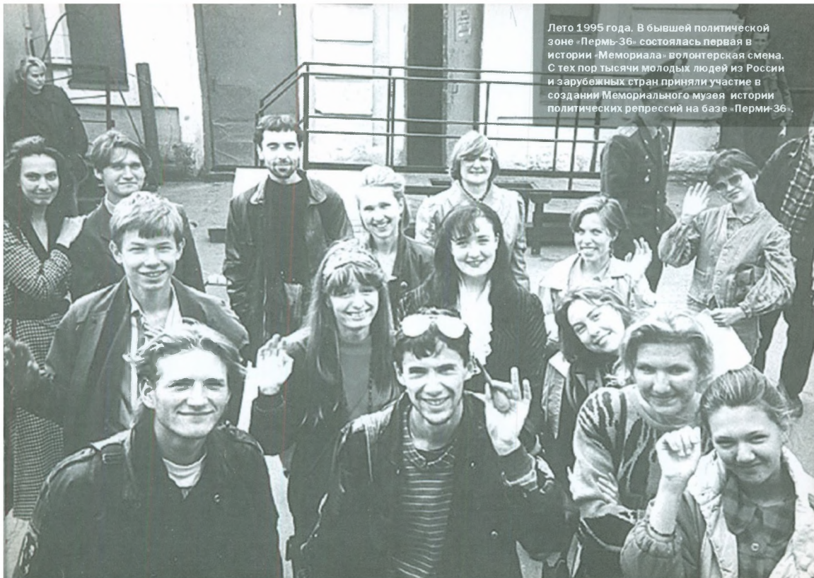
Лето 1995 года. В бывшей политической зоне «Пермь-36» состоялась первая в истории «Мемориала» волонтерская смена. С тех пор тысячи молодых людей из России и зарубежных стран приняли участие в создании Мемориального музея истории политических репрессий на базе «Перми-36».