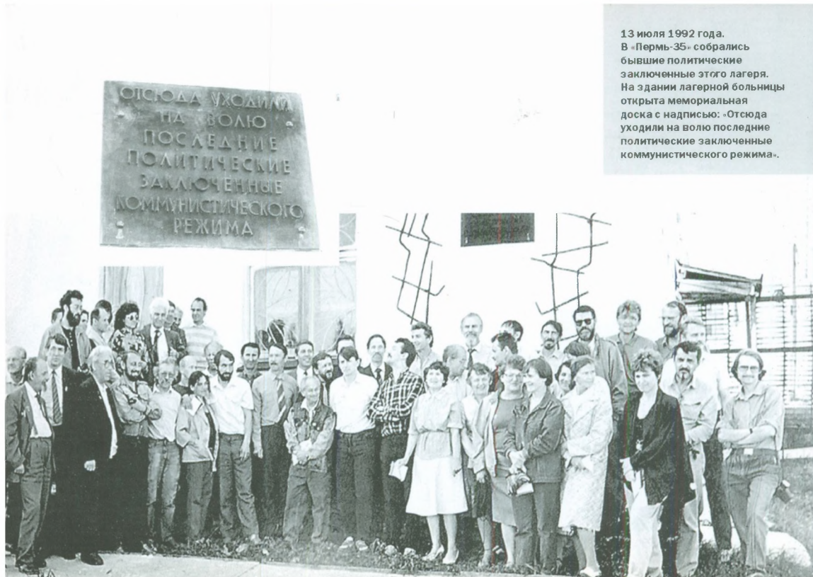
13 июля 1992 года. В «Пермь-35» собрались бывшие политические заключенные этого лагеря. На здании лагерной больницы открыта мемориальная доска с надписью: «Отсюда уходили на волю последние политические заключенные коммунистического режима».