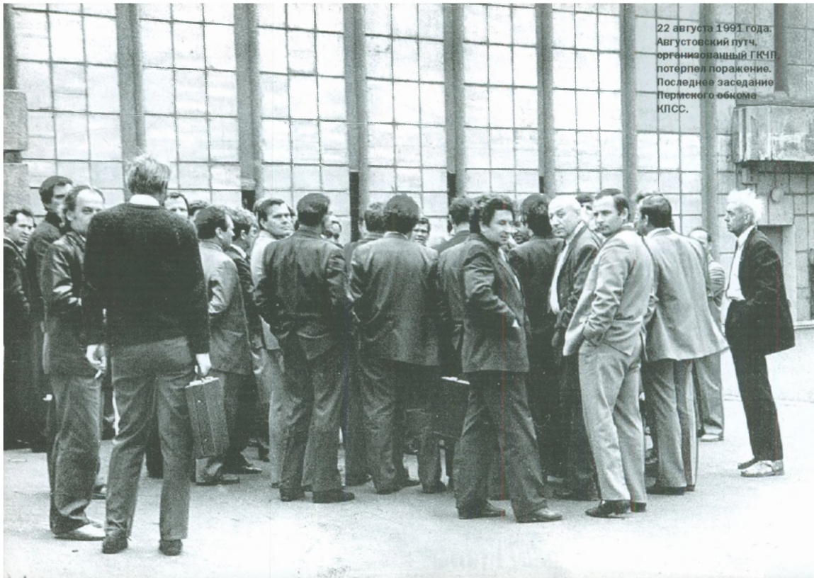
22 августа 1991 года. Августовский путч. организованный ГКЧП, потерпел поражение. Последнее заседание Пермского обкома КПСС.