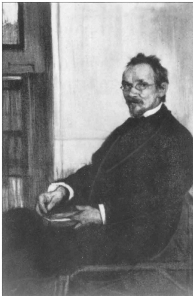
Портрет В. В. Розанова. Автор Л. С. Бакст. 1901 г. Пастель.