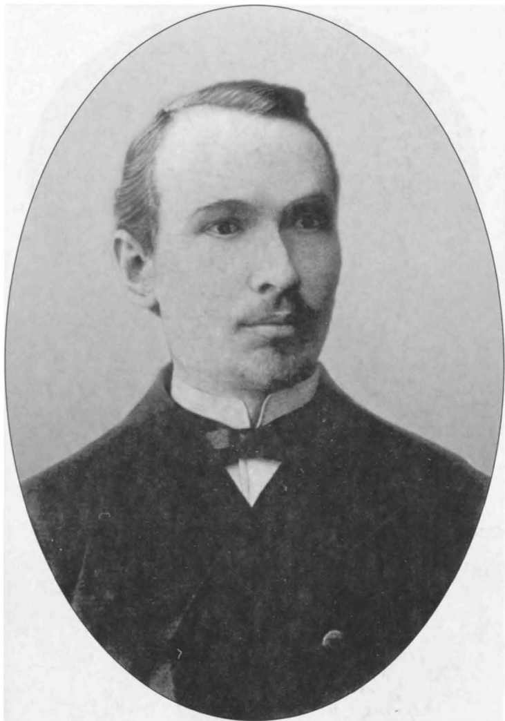
В.В. Розанов. Конец 80 — начало 90-х годов.