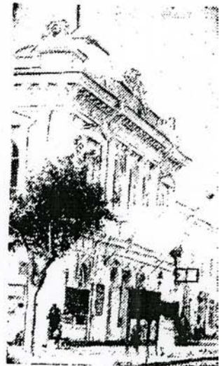
НА СНИМКЕ: Бердяевск. Театр