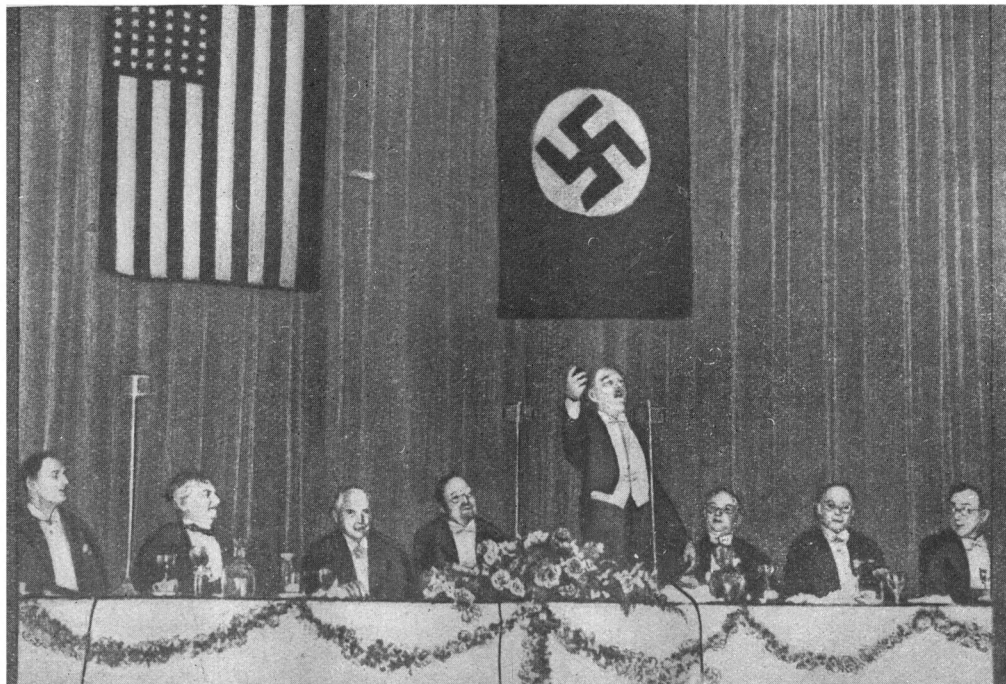
Выступление сенатора Эрнеста Ландина на банкете, организованном Германо-американской торговой палатой в нью-йоркском отеле „Валдорф Астория“ 20 марта 1940 г. Слева направо: германский генеральный консул д-р Ганс Борхерс, Отто А. Штифель, международный эмиссар нацизма герцог Саксен-Кобургский, председатель Германо-американской торговой палаты д-р Роберт Рейнер, сенатор Эрнест Ландин, генерал-лейтенант фон Беттихер, бывший германский консул Генрих Штамер и германский консул Фридрих Дрегер.