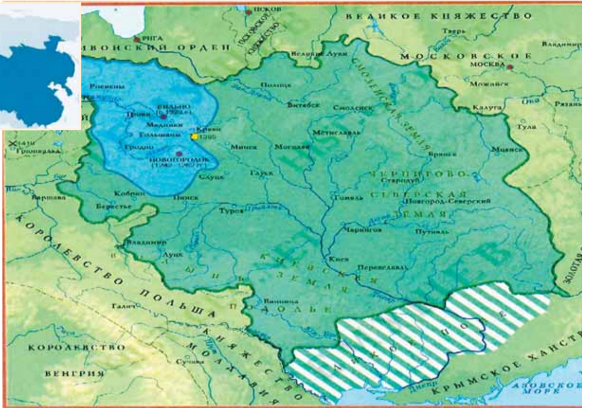
Карта Великого княжества Литовского XV века

— Долгое время территория полуострова входила в состав Крымского ханства, вассального государства Османской империи. Еще в Крыму присутствовали генуэзцы, армяне и прочие понемногу. Прочих, к слову, было предостаточно. Даже Гитлер, упомянутый Владимиром Путиным в интервью Такеру Карлсону, умудрялся считать Крым германским, потому что в нем жили племена готов. Причем национальные отношения у них тоже были весьма интересными — с XIII по XV век на