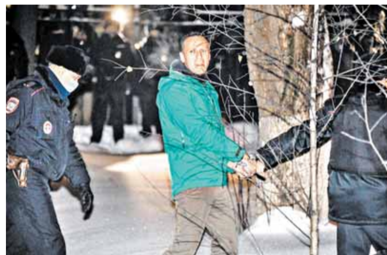
Алексея* задерживали бесчисленное количество раз

В феврале 2011 года Навальный* впервые произносит фразу, которая быстро становится мемом: «Единая Россия» – партия жуликов и воров». На последовавшие угрозы судебными исками он ответил опросом в своем блоге – является ли ЕР таковой, и почти все 40 тысяч участников опроса согласились с подобным утверждением.