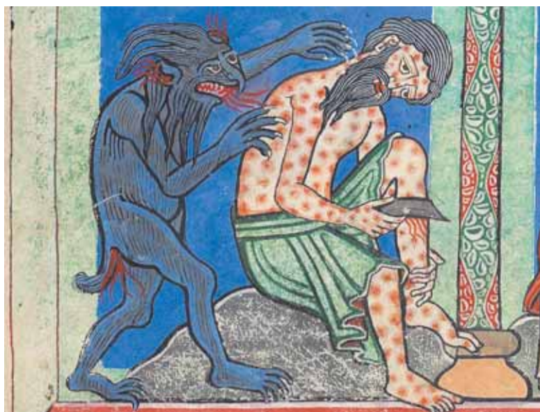
На древних гравюрах проказа всегда изображалась «в обнимку» с нечистой силой