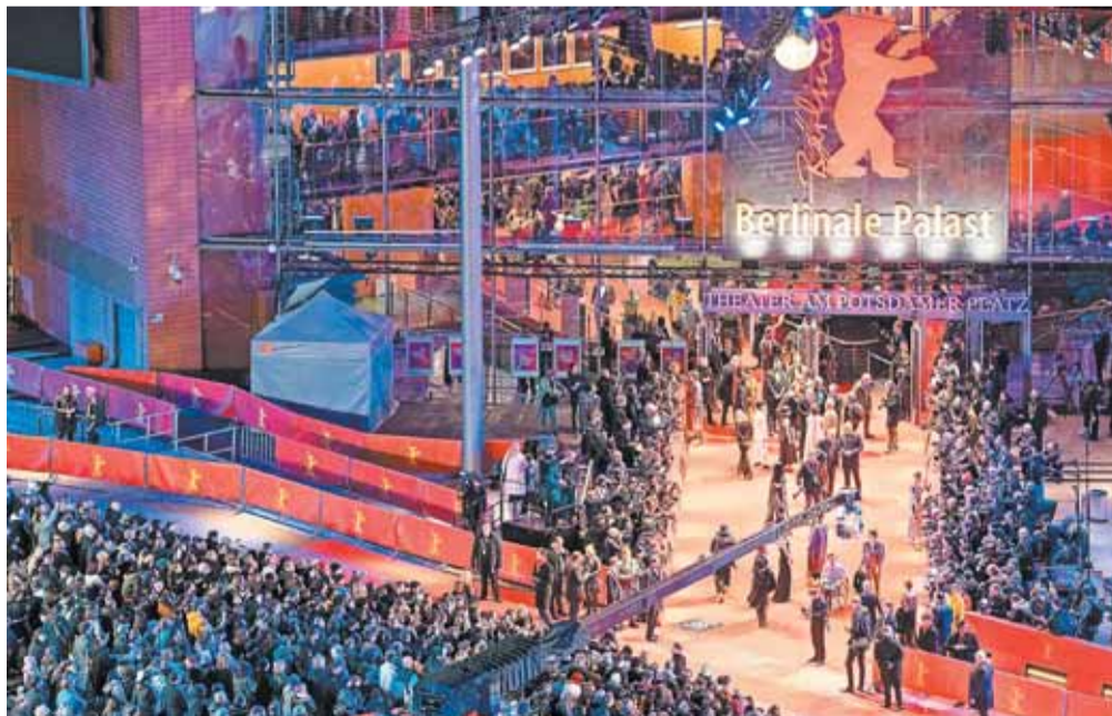
Берлинале. Церемония открытия