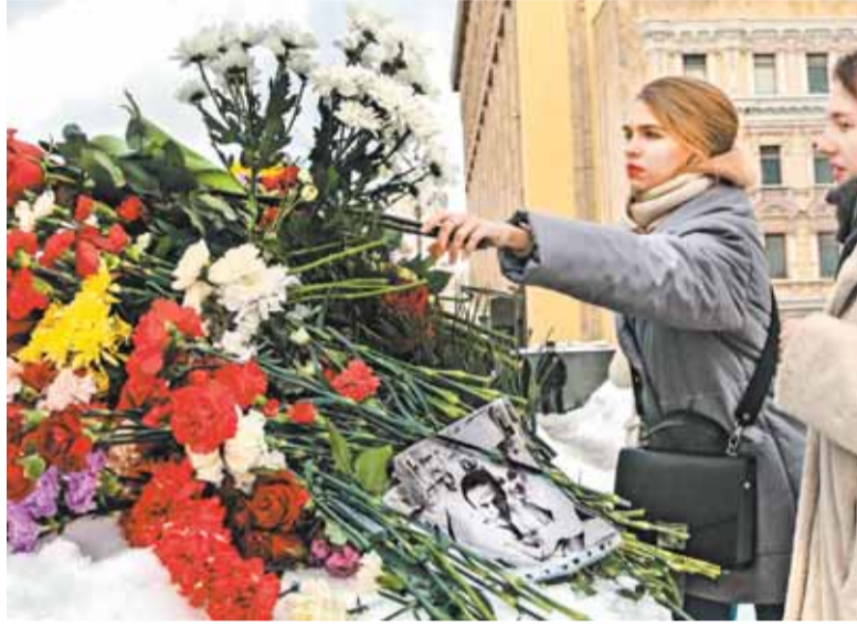
Цветов было море

В Москве один из стихийных мемориалов в память об Алексее Навальном* возник возле Соловецкого камня на Лубянской площади. Люди стали нести цветы к памятнику жертвам репрессий, как только появились сообщения днем 16 февраля 2024 года о смерти политика.