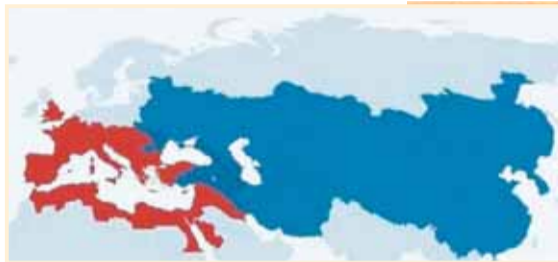
Экс-президент Монголии напомнил о территории своей империи в XIII веке (синим цветом) в сравнении с Римской (красным)

родственное современным латышам и литовцам, ушло с исторической и политической арены в 1283 году, когда территория их обитания была полностью подчинена Тевтонскому ордену. Название Пруссия, правда, сохранилось и стало передаваться разным немецким государствам — сначала на ее землях было герцогство, потом королевство, а затем она вошла в качестве провинции в Германскую империю и сменившую ее Германскую республику.