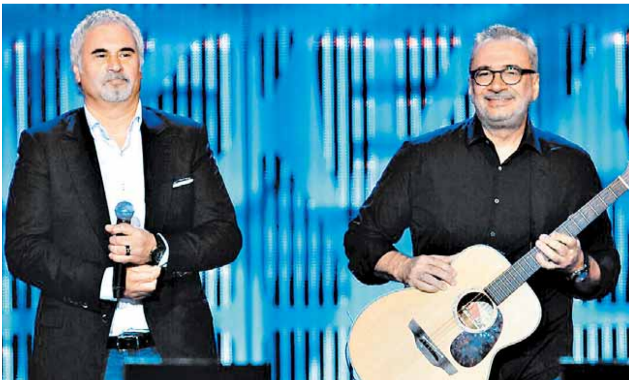
Валерий и Константин: прощальная самба белых мотыльков

Меладзе что-то отвечает шепотом, что явно радует просителя.