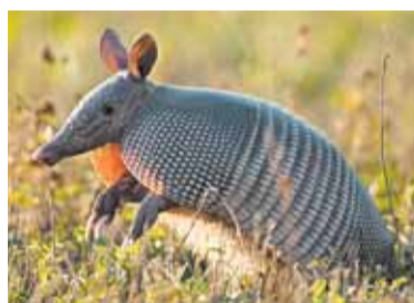
Броненосцы – разносчики лепры

терия лепры – ее «родственница». Вообще лепра – самый первый известный человеку возбудитель инфекционной болезни. Лепра упоминает-