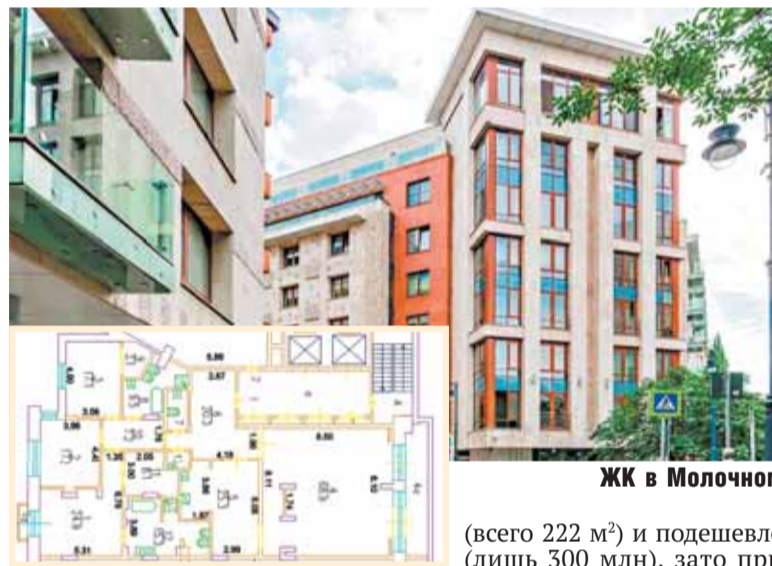
ЖК в Молочном

«Компания «Тепло-Инвест» была «дочкой» газпромского ОАО «Межрегионтеплоэнерго»,