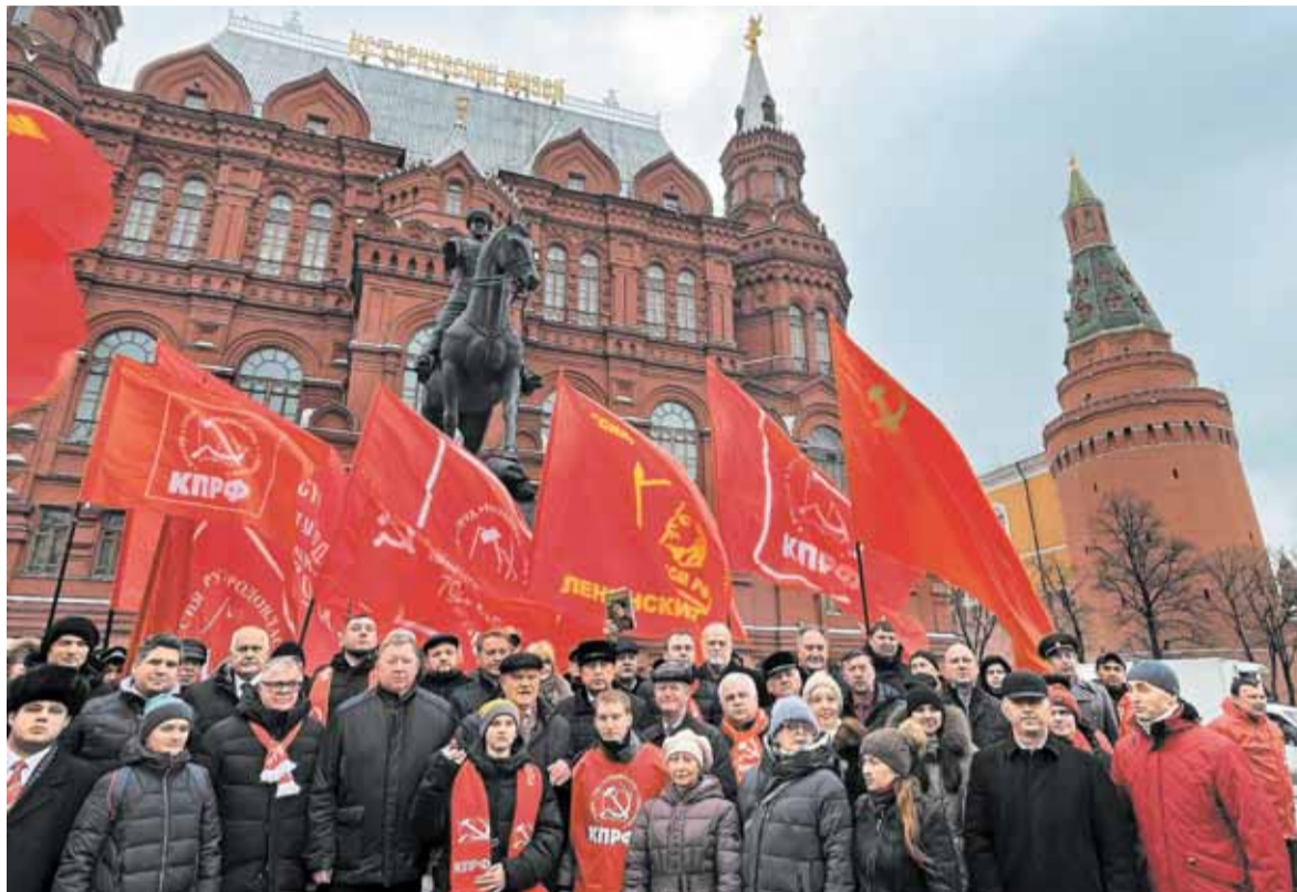
Геннадий Зюганов и Николай Харитонов с соратниками пришли возложить цветы на могилу Иосифа Джугашвили

Собравшиеся рукоплескали, а кто-то даже всхлипнул. Расчувствовалась и охрана, на минуту разрешив желающим подойти к оратору и пожать ему руку. И я подошла. Гляжу: батюшки, да никакой это не Путин, а другой кандидат на главный государ-