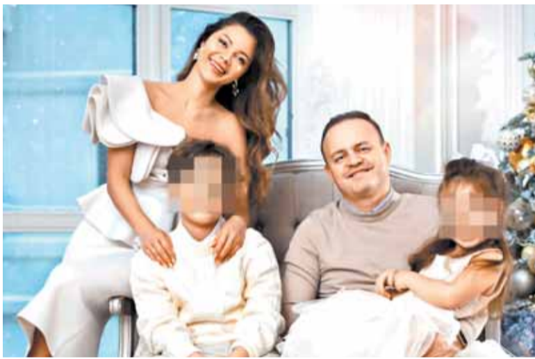
Супруги Даванковы и их «новые люди»

Лидер «Новых людей» оказался самым богатым кандидатом в президенты: Владислав Даванков и сам за последние шесть лет заработал, в том числе на выдаче микрораймов нуждающимся, 76 миллионов 915 тысяч 249 рублей 57 копеек. Да плюс супруга за все это время принесла в дом 810.984 руб. 32