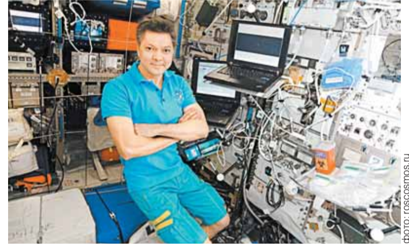
Космический долгожитель Олег Кононенко