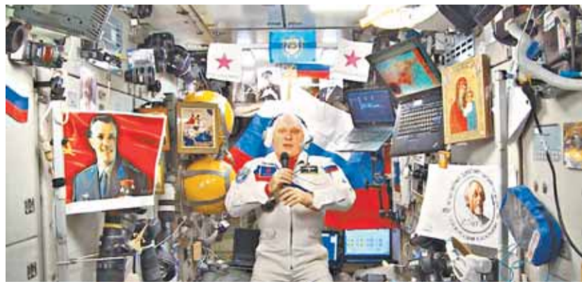
Небольшой российский блок на МКС под завязку забит портретами, иконами и выпелами

Кстати, эти портреты появились на станции после скандала, когда было замечено, что даже та часть МКС, которая попадает в поле зрения простых земных жителей, буквально-таки заве-