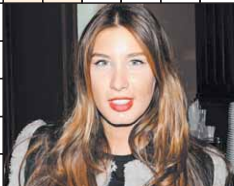
автор сканворда: Валерий Шаршукоев